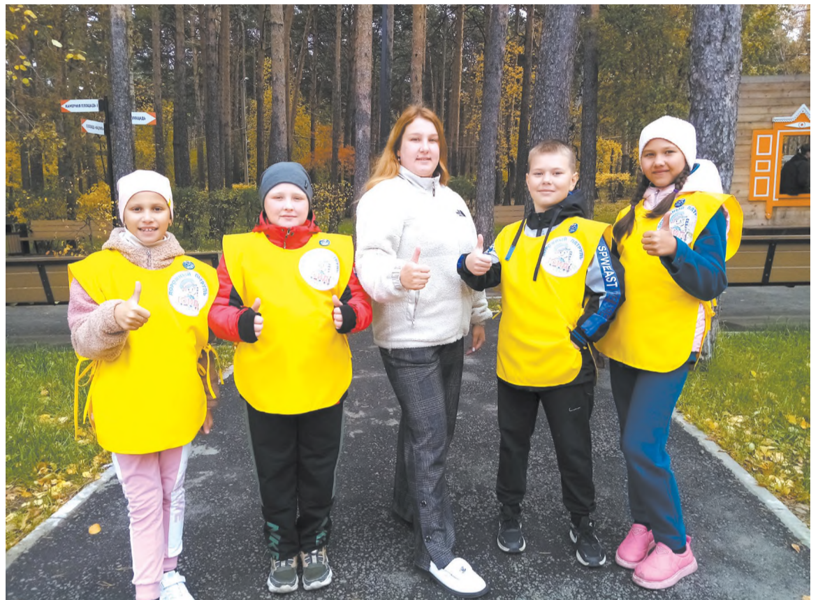
Команда ЮИД школы № 3

Муниципальный слёт юных инспекторов движения «Безопасное колесо» 2024-2025 учебного года начался с практического этапа – велоэстафеты.