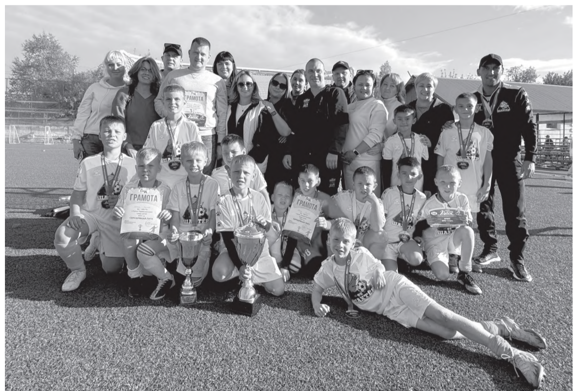
Юные футболисты с группой поддержки

В матче за третье место «СтройПроектСервис» (г. Иркутск) обыграл «Шквал» (г. Черемхово) со значительным