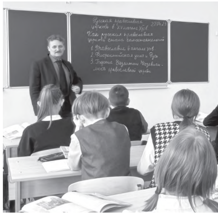
Идёт урок истории

На пороге прекрасный праздник - День учителя. В этот день принято поздравлять педагогов, благодарить их за нелёгкий труд и знания, которые они дают своим ученикам. Мы хотим рассказать об одном педагоге, с которым до сих пор встречаемся, общаемся и с удовольствием вспоминаем его уроки.