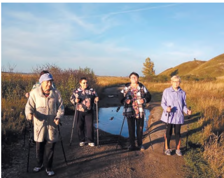
Скандинавская ходьба среди местного населения