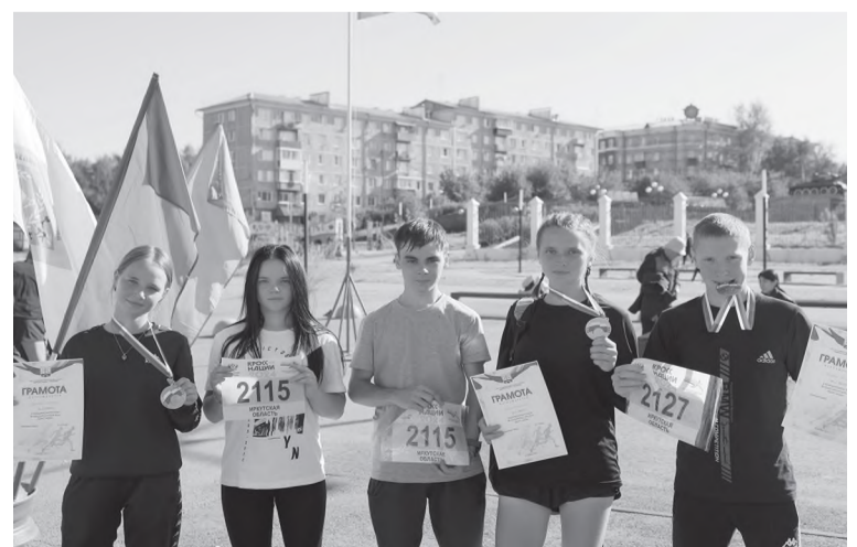
Участники всероссийского забега «Кросс нации»

Отдел по физической культуре и спорту города Черемхово