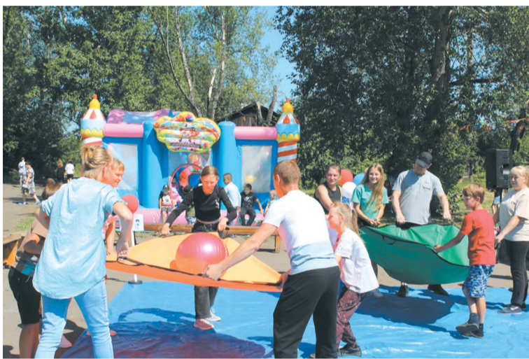
Новый спортивный инвентарь уже в ходу