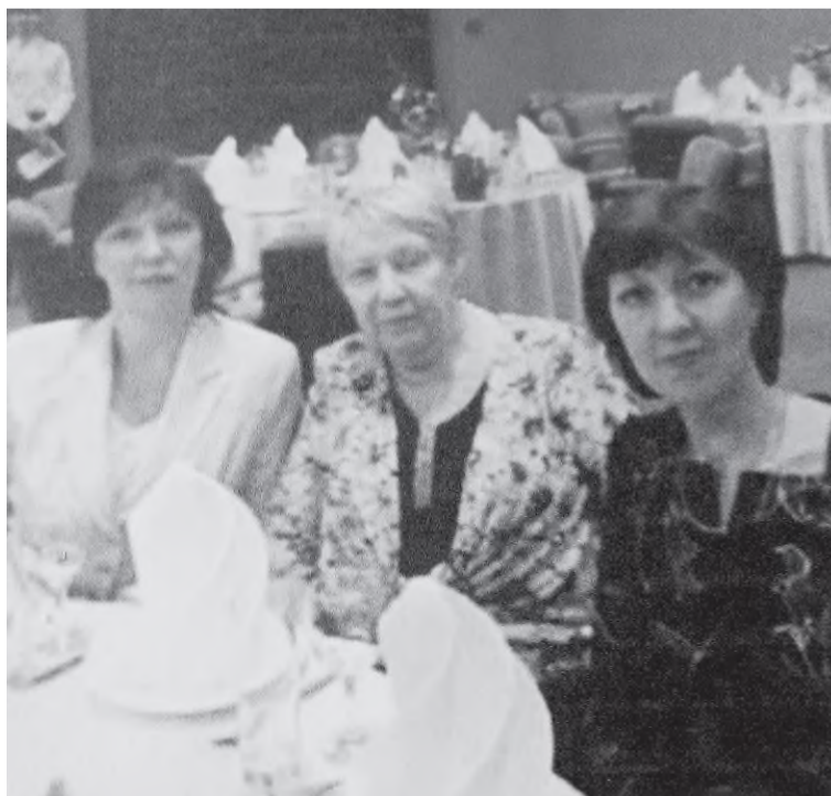
Мама и дочери (учителя)