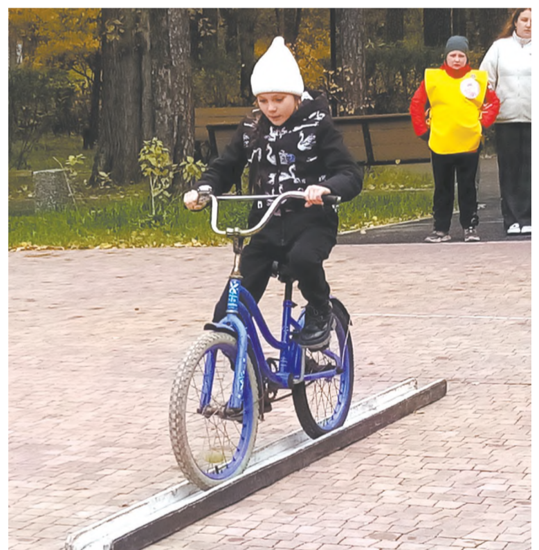
Езда по желобу