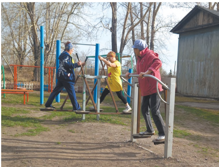
Поселковая спортивная площадка