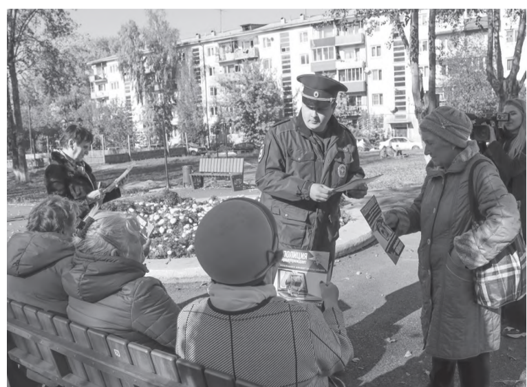
Межмуниципальный отдел МВД России «Черемховский»