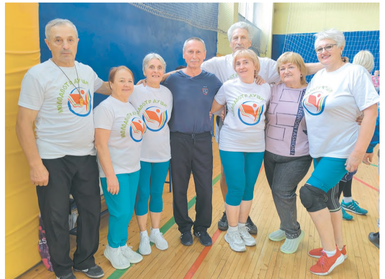
«Молодость души» - команда ветеранов-педагогов

В каждом этапе есть свои победители, и в этом этапе по результатам игр призовые места распределились следующим