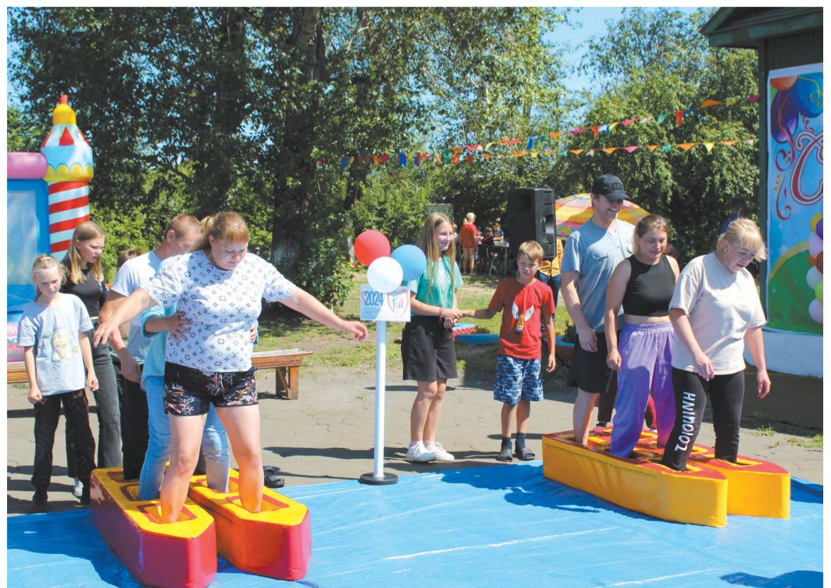
Праздники в Шахтёрском