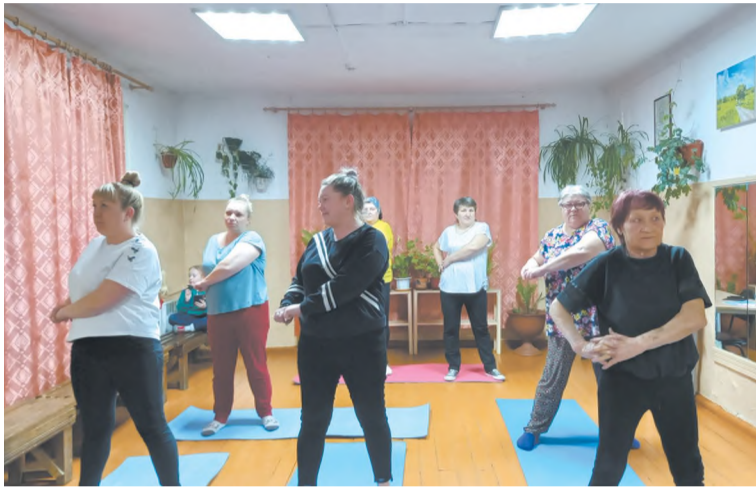
Идёт занятие в группе «Здоровье»