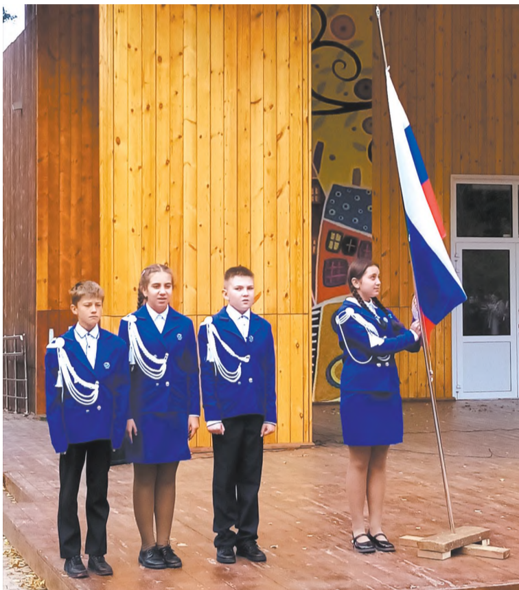
Момент поднятия флага