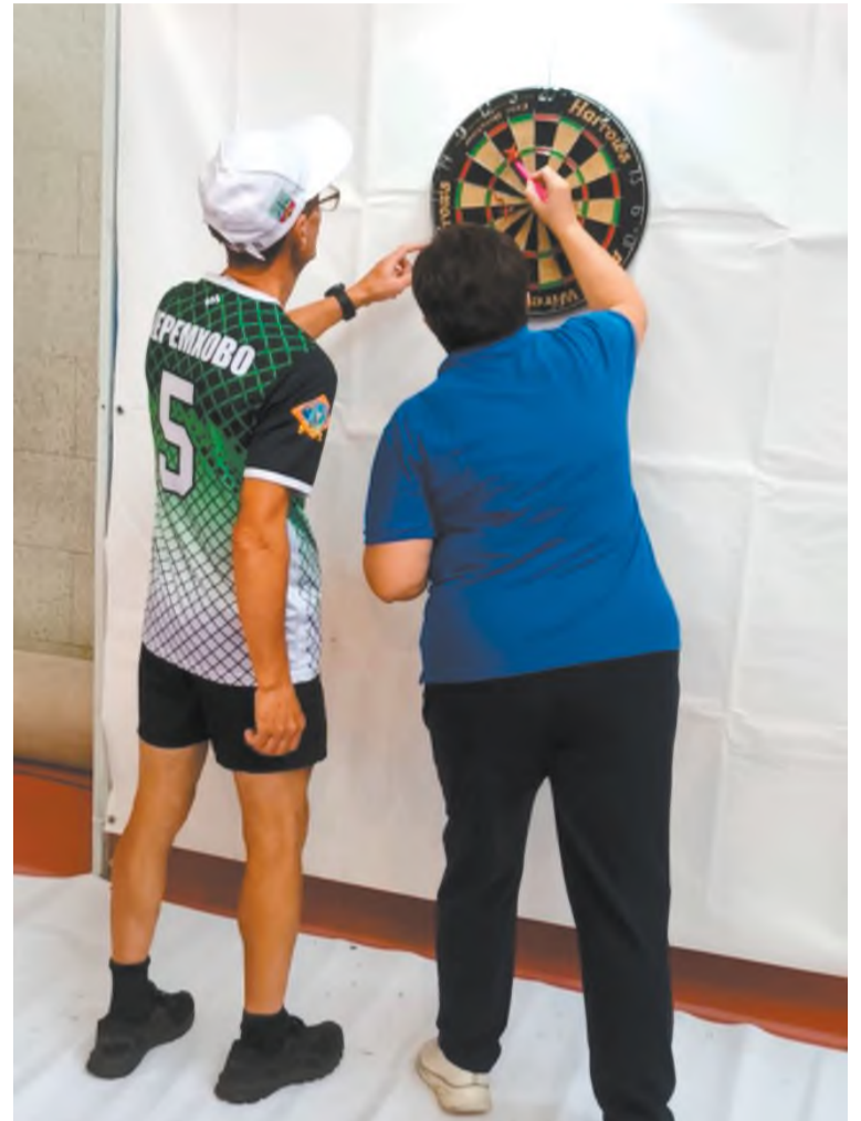
На этапе «Дартс»