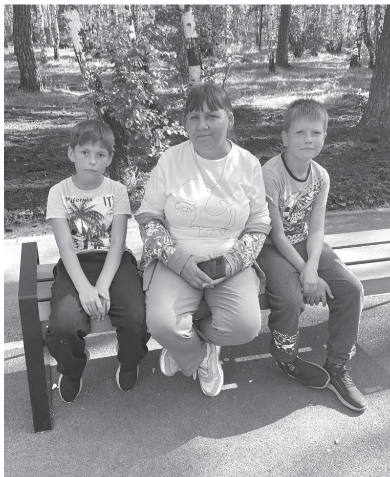
Мои дорогие мальчишки