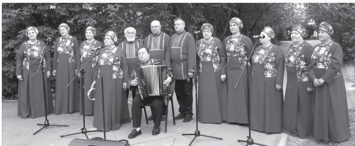
Выступает народный хор «Родник»