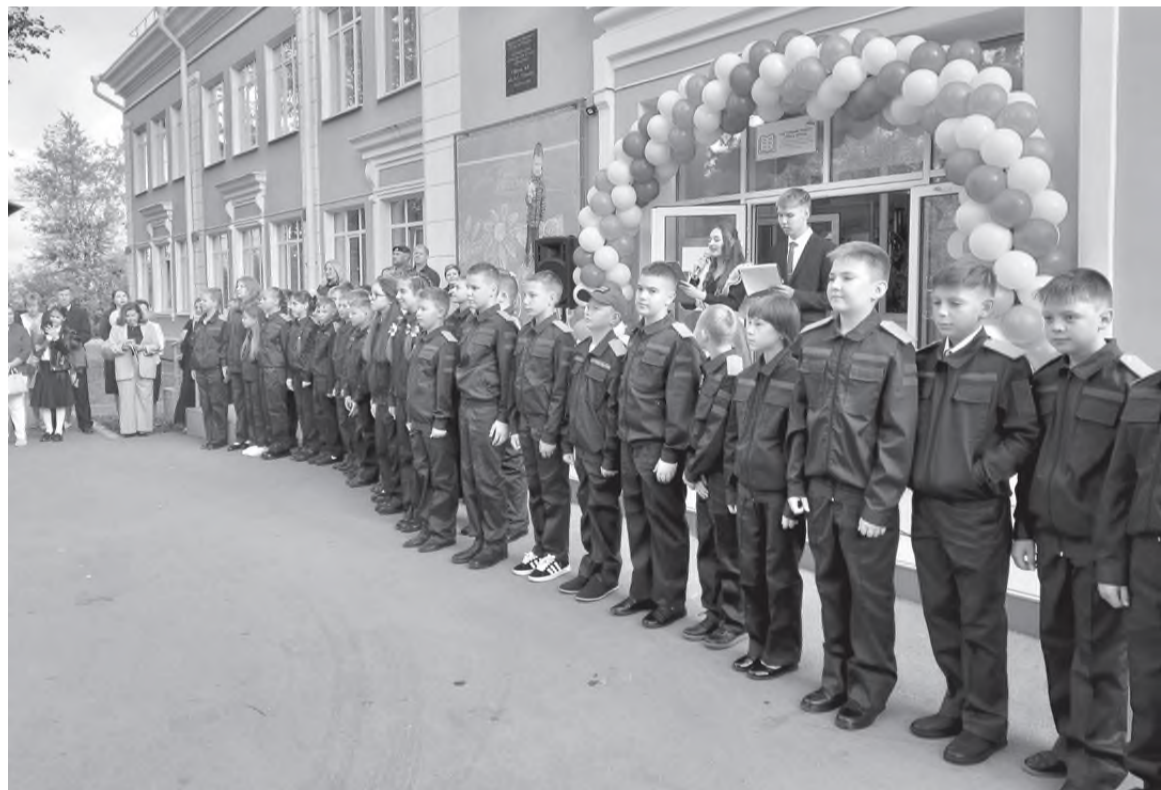
На торжественной линейке