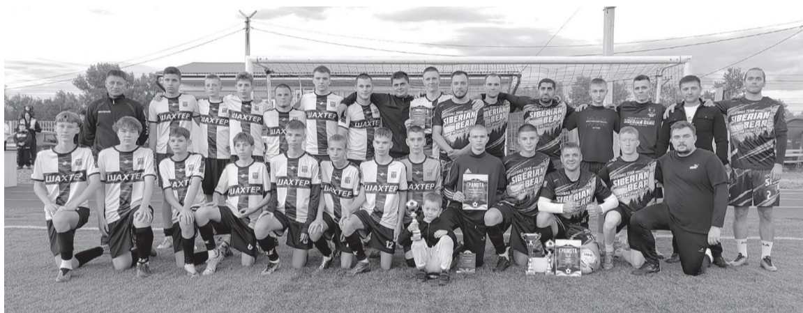
Трудовые коллективы на финале Кубка

Определился победитель Первенства города Черемхово по мини-футболу среди производственных коллективов 8x8. Пять команд с мая по сентябрь боролись за титул чемпиона - это «СШ Черемховская», «Локомотив», «Черемховуголь», «СК Сибирский медведь» и «Динамо». По результатам Первенства победителями стала команда «СШ Черемховская», набрав наибольшее количество очков – 28. На втором месте «СК Сибирский медведь» - 26 очков, в тройке лидеров команда «Локомотив» - 18 очков. Четвертое место в турнирной таблице занимают горняки из команды