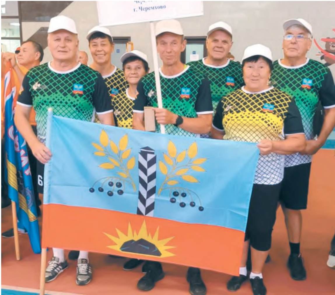
Команда «Ветераны Черемхово»