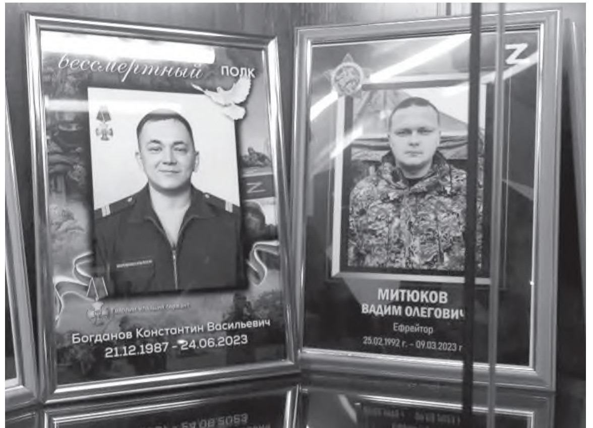
Защитники Земли Русской. (в музее г. Черемхово)

И вырастает исполинский подвиг парня, воина, мученика во Христе Евгения Родионова. Он как мерило человеческого долга,