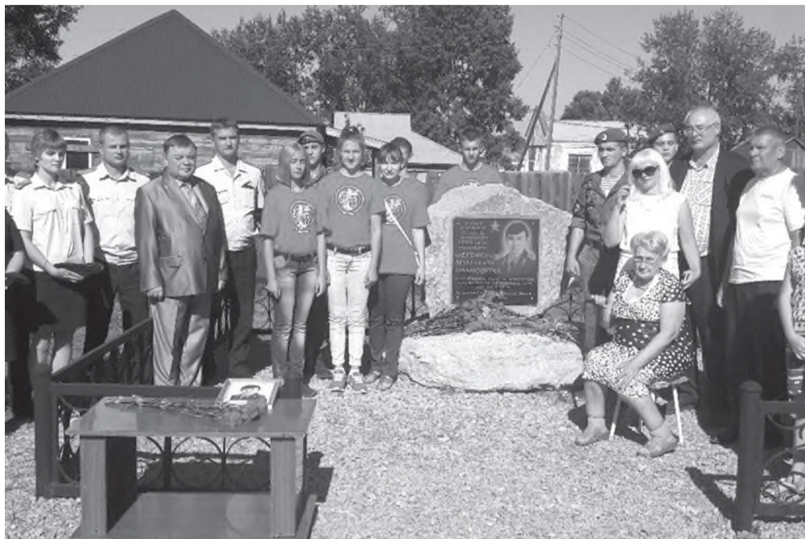
Моменты открытия памятного монумента милиционеру-герою