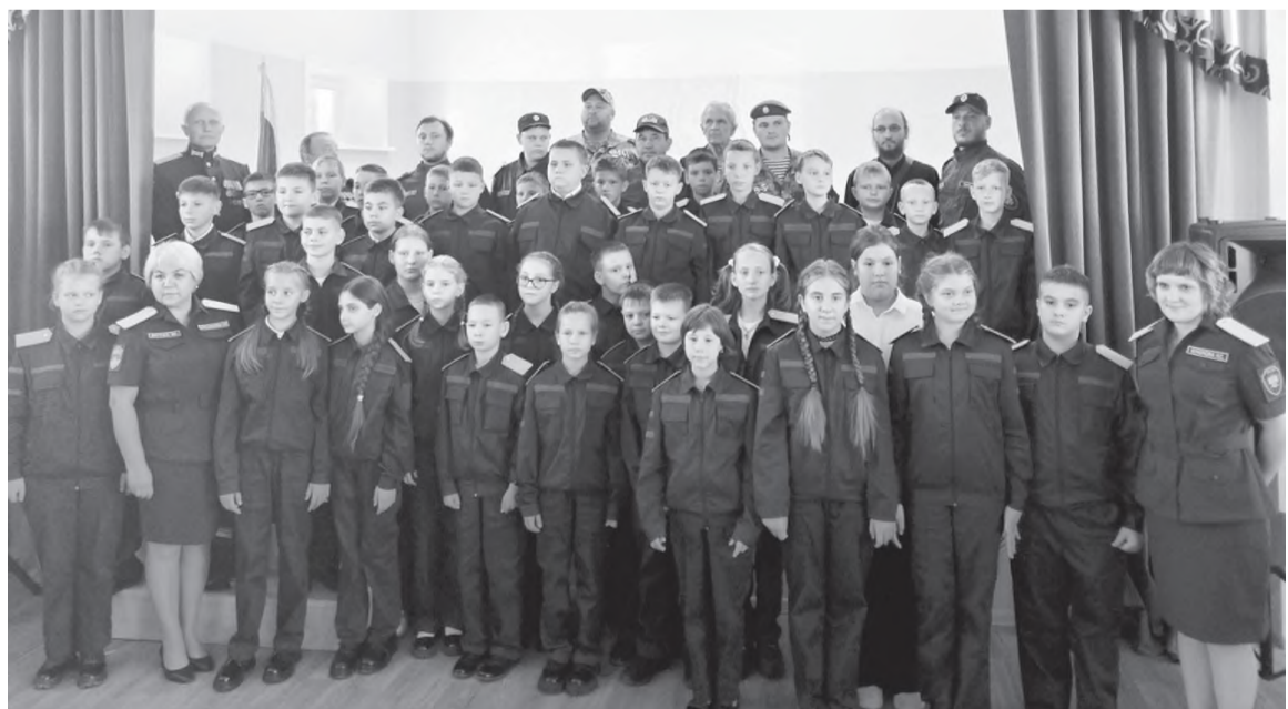
Пятиклассники – кадеты-казаки