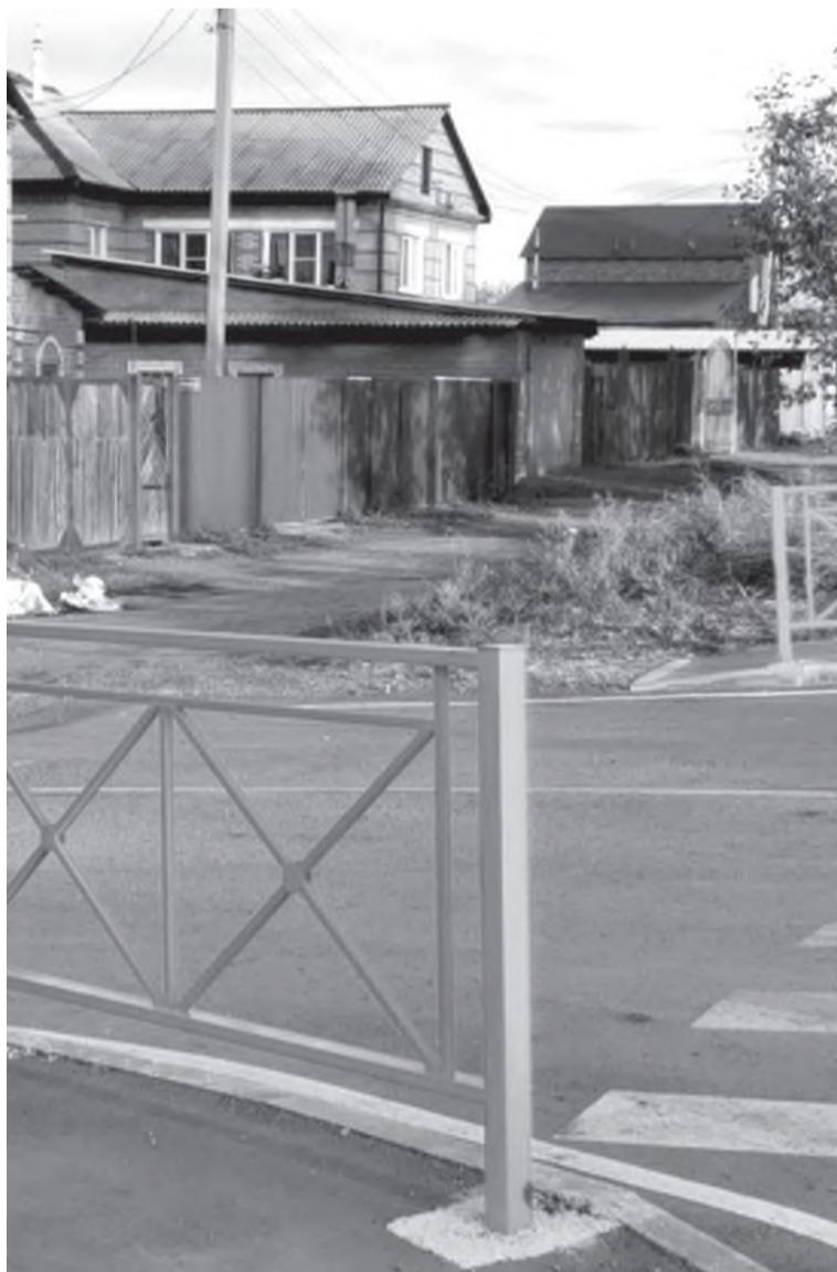
Жилые дома по улице Фереферова

- Конечно, знаю. В то время, когда эта история произошла в Черемхово, мне было двадцать лет, я только что вернулся из армии.