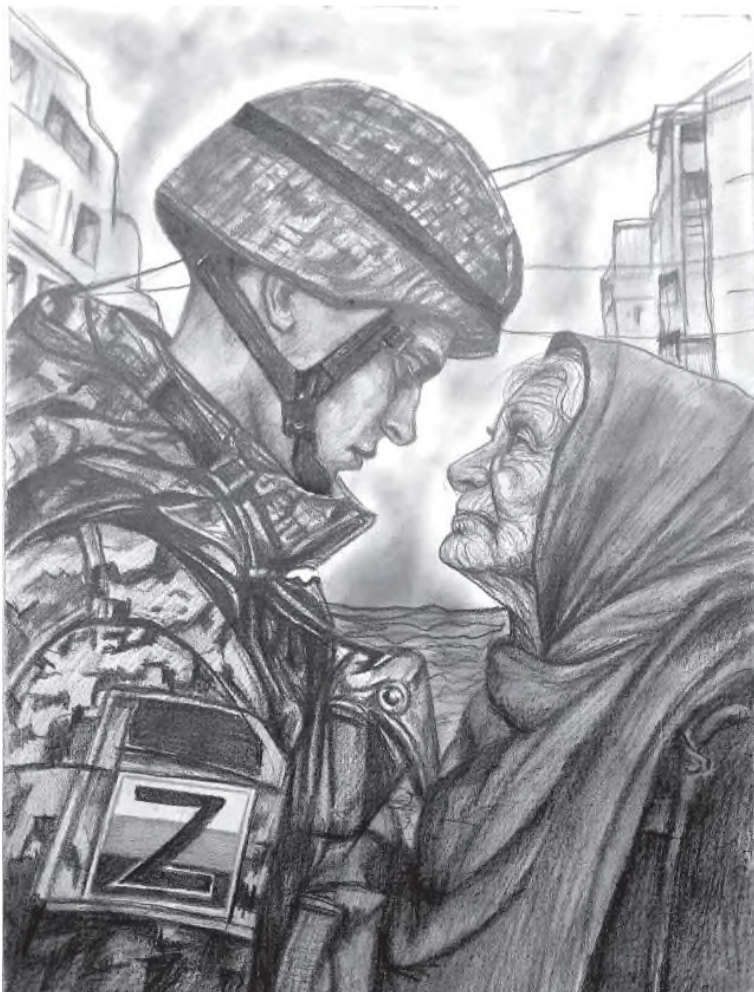
Автор работы Михаил Игумнов «Защитник Отечества»