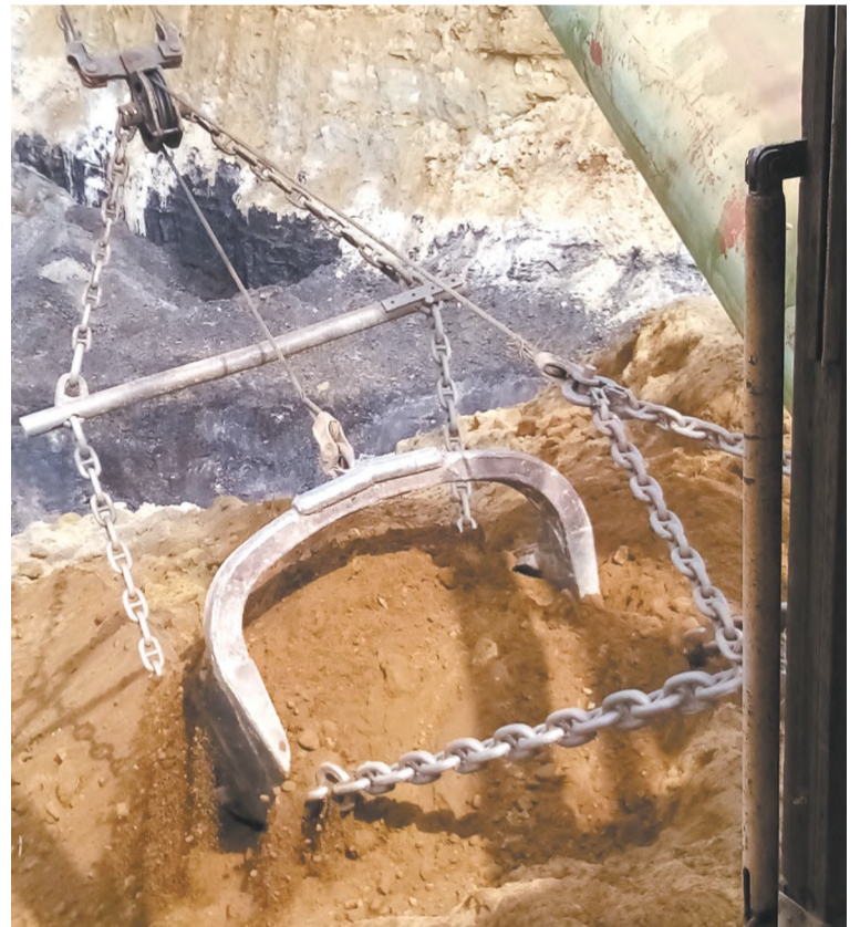
Фото из кабины машиниста. Огромный ковш в работе...