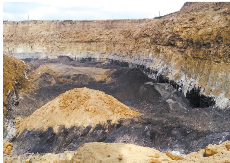
А под землёй несметные богатства (залежи чёрного золота)