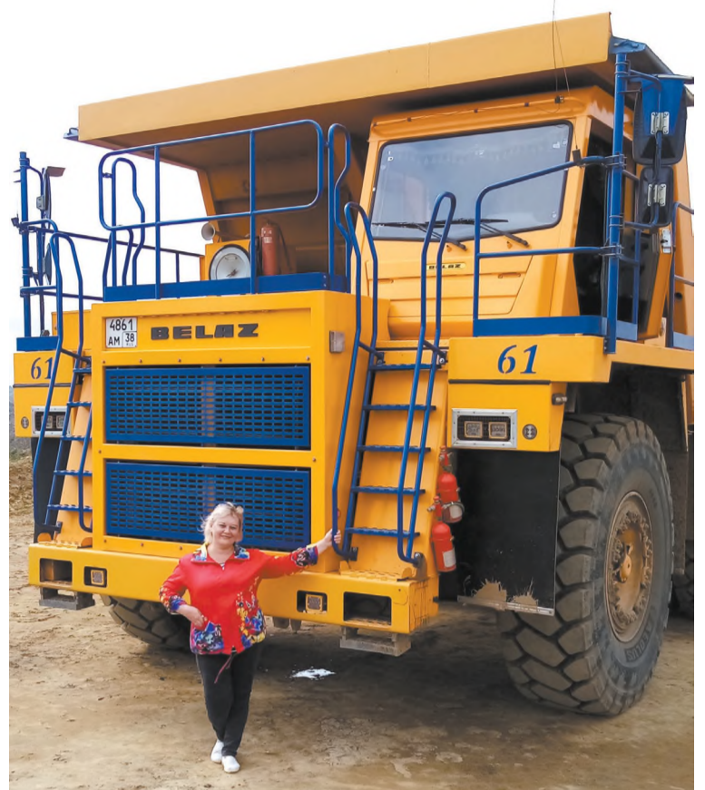
У того самого БелАЗа, который в детстве казался огромным

Прощаемся, в ответ получаю приглашение приехать на угольный участок ещё раз. Довольная, еду в редакцию, чтобы поделиться своими эмоциями от увиденного. Делюсь ими и с вами, уважаемые читатели.