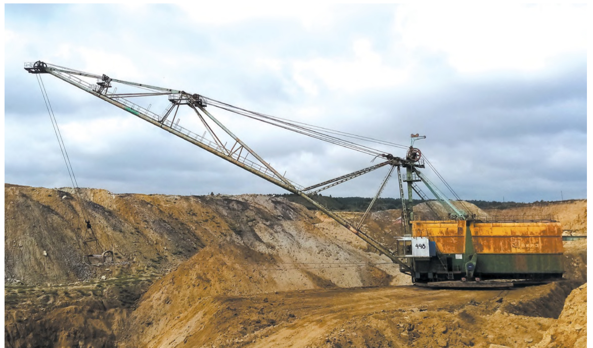
Шагающий экскаватор ЭШ 10/70