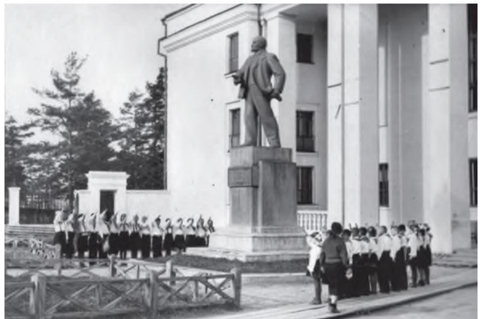
Пионерский слёт у Дома культуры им. Ленина (ныне драмтеатр)