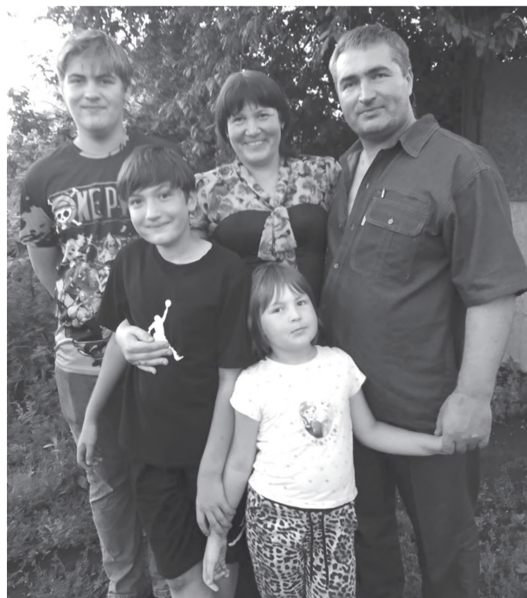
Наша дружная семья