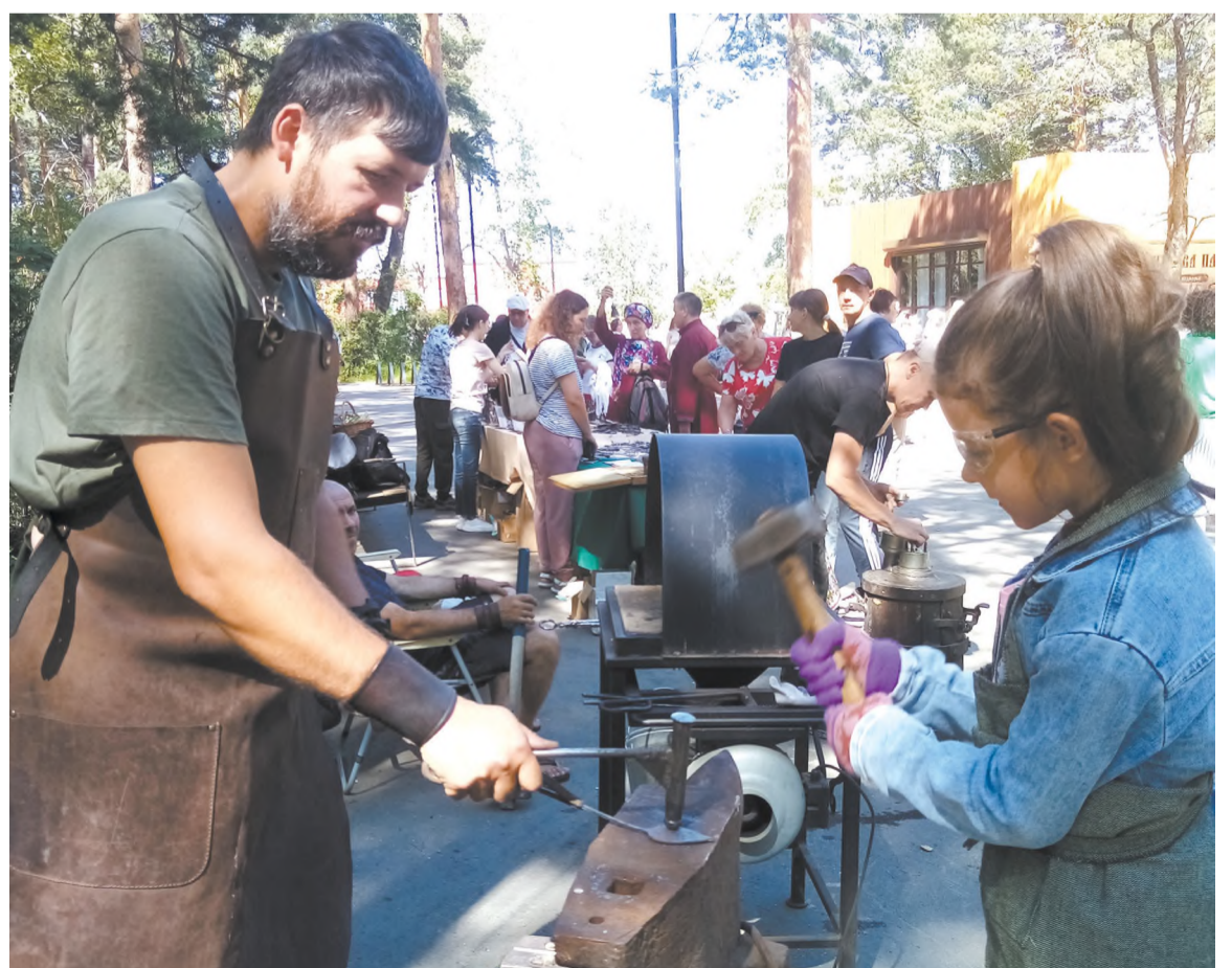
На ярмарке ремёсел. Кузнечное дело