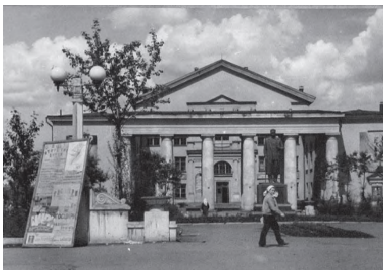
Дом культуры им. Горького в советское время