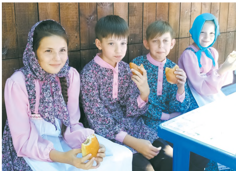
Ах, как вкусны пирожки с черёмухой...

В выходные в Черемхово прошёл VI «Черёмуховый фестиваль». Этот праздник расширил культурные границы, наполнил их новыми смыслами, внёс радость, объединил всех нас и помог завести новых друзей.