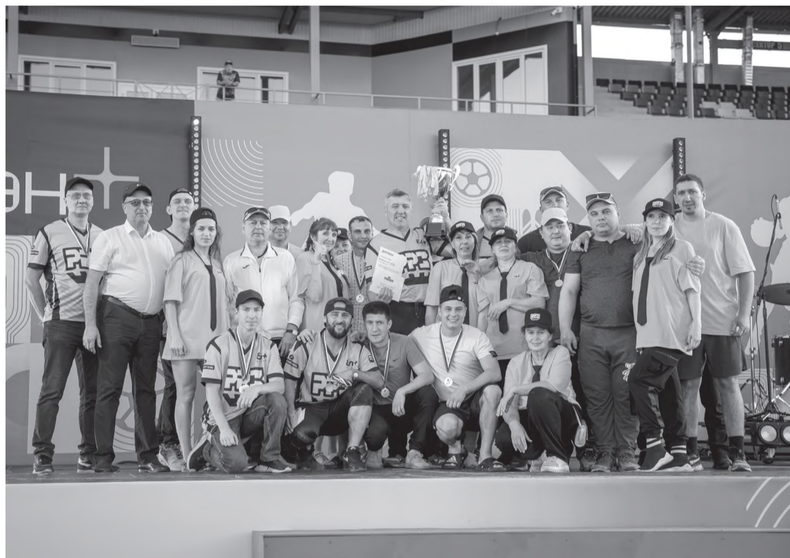
Серебро у Рудоремонтного завода

Пока шли игры по футболу и волейболу, рядом соревновались гиревики. Тяжёлая гиря в руках участников была словно невесомой. Не верилось, что ее масса 24 килограмма! Горняки с легкостью подкидывали ее в небо, со стороны казалось, что гиря игрушечная. Попытавшись в перерыве ее приподнять, я поняла, что снаряд не цирковой, а самый что ни на есть настоящий. Спортсмен