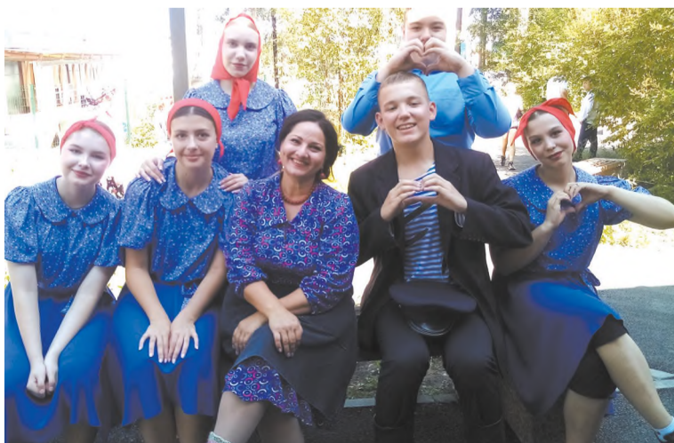
«Танцевальный лимузин» с актрисой А. Беляевской