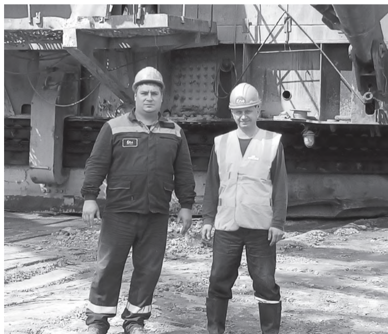
Машинист экскаватора со своим помощником