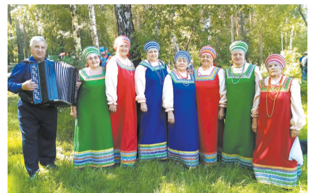
Народный ансамбль «Отрада»