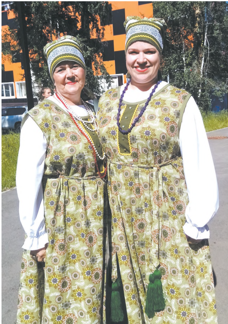
Певцы народного хора «Черёмушки»