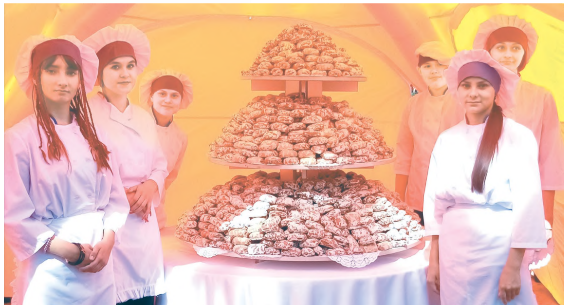
Угощение для всех - черемуховые пряники