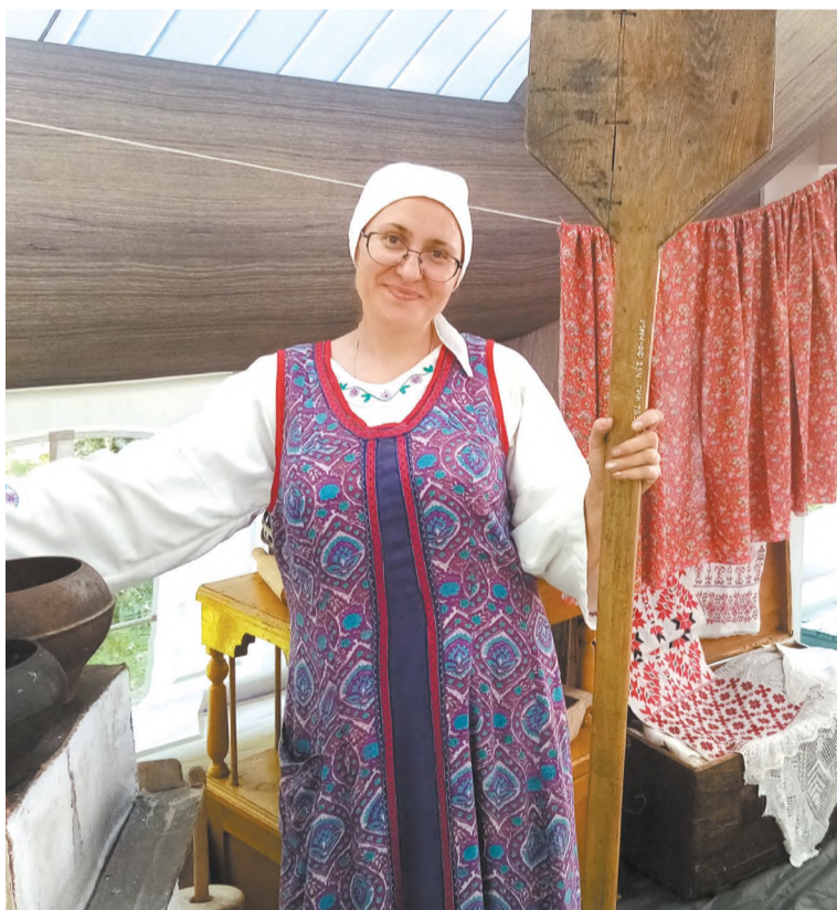
В русской избе