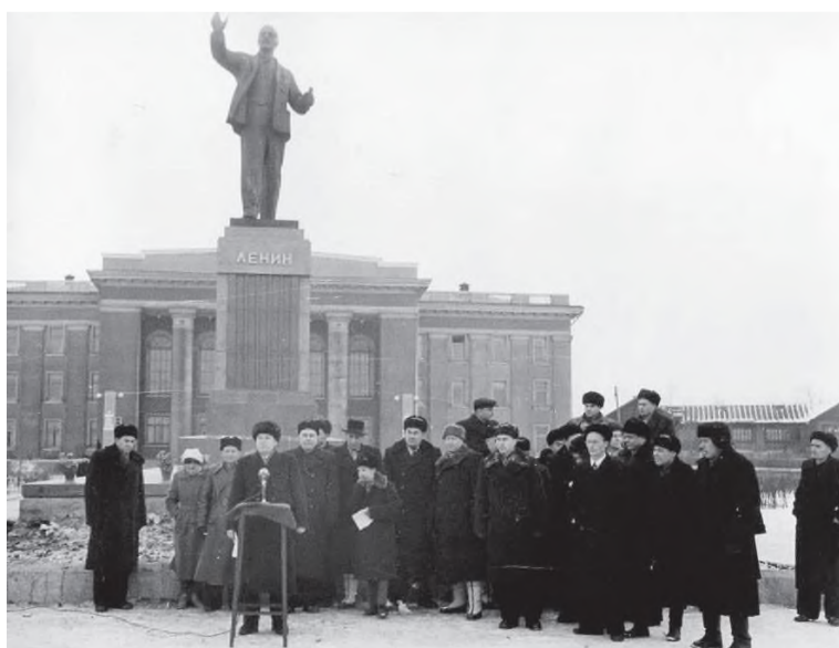
Митинг на площади Ленина (60-е годы)

Наверняка каждый житель нашего славного города, знает, что в начале своей истории Черемхово было небольшим селом, основанным в 1743 году на берегах реки Черемшанки. В XIX веке здесь был обнаружен уголь. Залежи этого черного камня привели к развитию промышленности и превратили Черемхово в крупный промышленный центр Иркутской губернии.