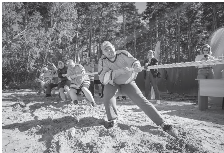
Тулунчане буквально вырвали победу в канате

Места распределились следующим образом: по итогам общего зачёта спартакиады победителями стали спортсмены «Тулунугля» - 1 место, «Рудоремонтный завод» - 2 место и «Жеронский разрез» - 3 место.