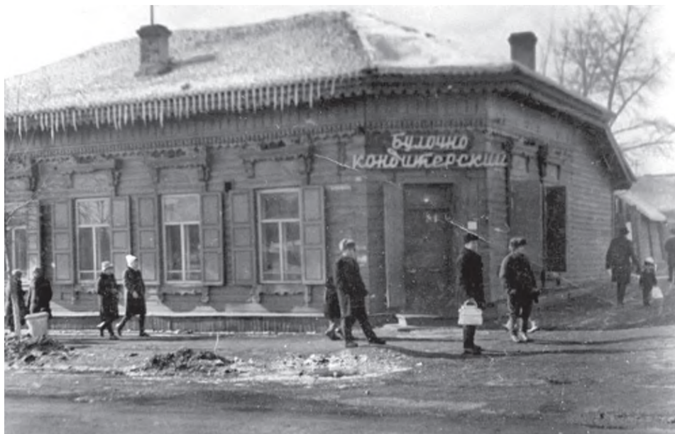
Узнали? Магазин канцтоваров на ул. Первомайская, а раньше булочно-кондитерский...