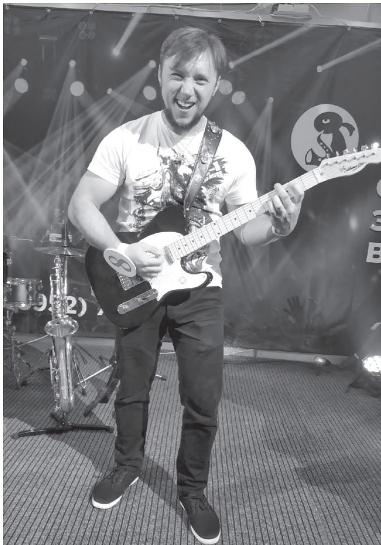
Гитара со мной всегда!