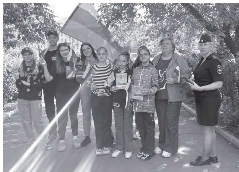
Межмуниципальный отдел МВД России «Черемховский»

В завершение акции леди в погонах вручили местным жителям тематические памятки и призвали беречь своих детей и не оставлять их без присмотра.