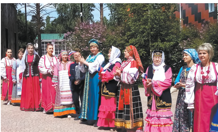
Мы все едины!