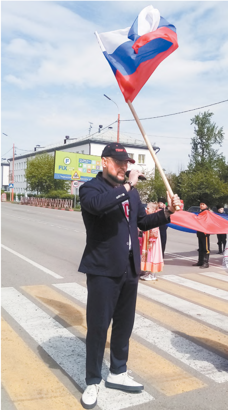
Поздравления от мэра города