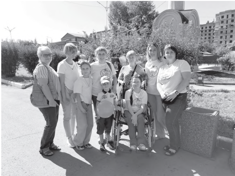
У нас в клубе нет места для скуки

Многие ребята входят в составы хореографических студий, вокальных кружков, обучаются в музыкальной и художественных школах, посещают занятия