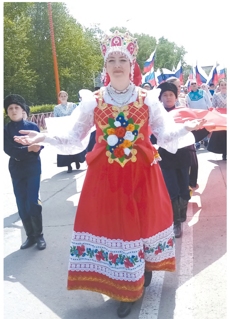
Впереди колонны «Матушка – Россия»