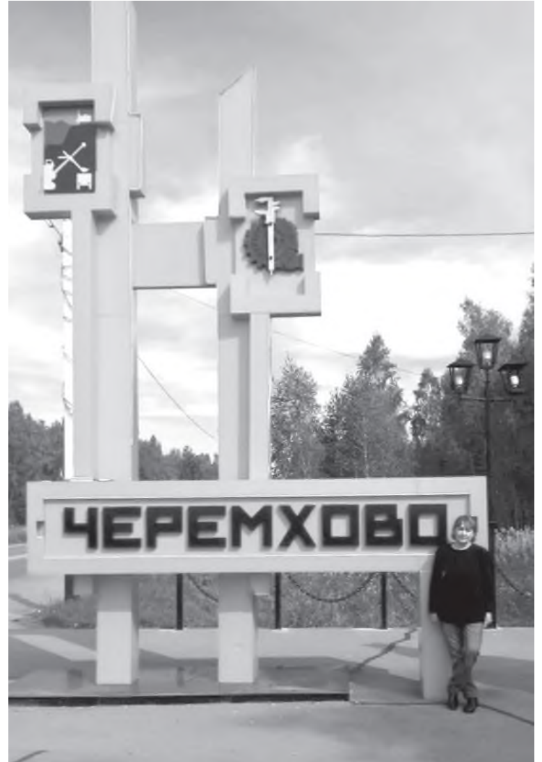
Вот я и дома!