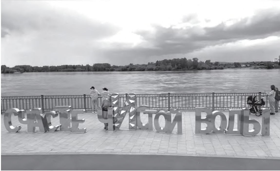
На набережной в Иркутске