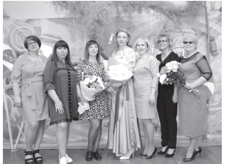
Мы вместе! (родители нашего клуба)

В 2023г. стали победителем конкурса социально значимых проектов Иркутской области «Губернское собрание общественности». Проект: «Семейный инклюзивный центр «ДОБРОдеево» направлен на создание инклюзивного пространства, развития творческого потенциала, социализации и обучения бытовым навыкам, учитывая индивидуальные осо-