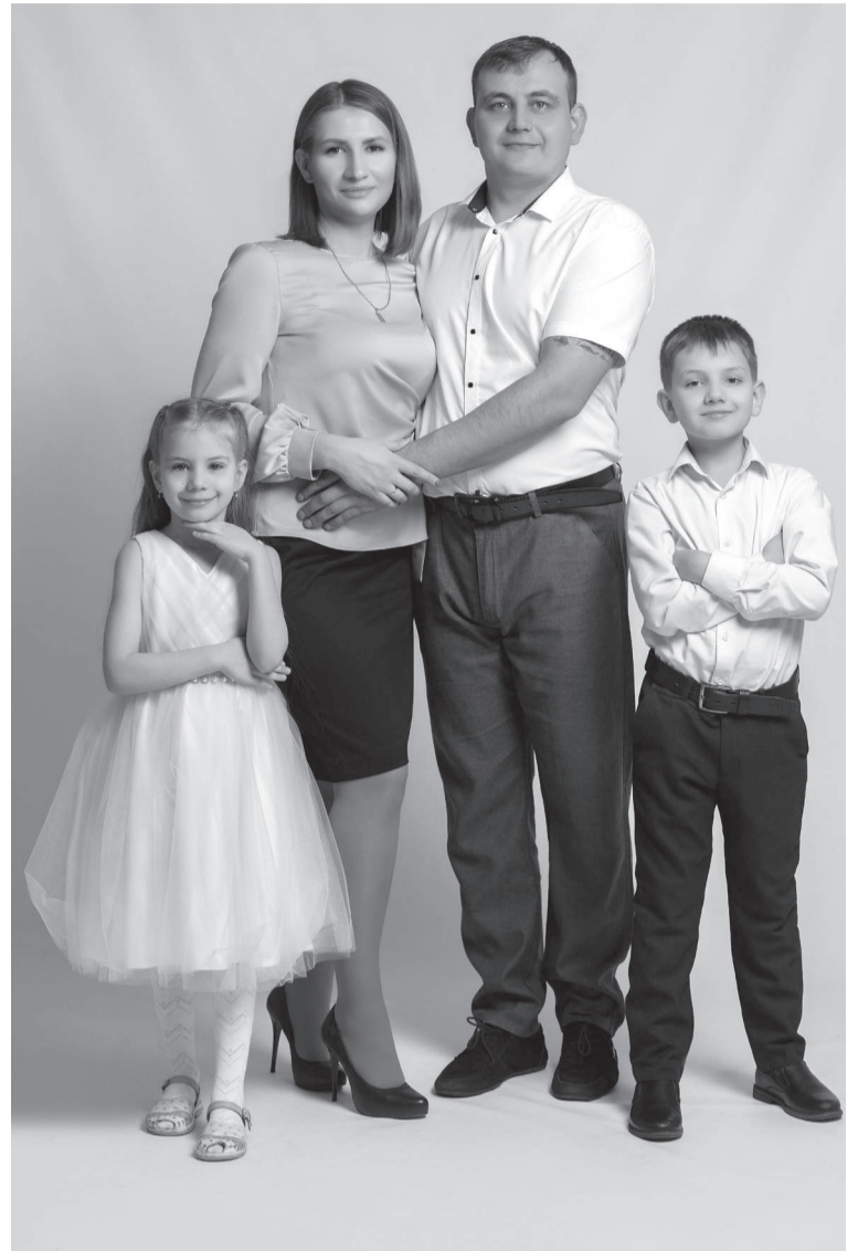
Моя любимая семья

- Совершенно верно. Работа в детском саду мне очень нравится. Дети - это маленькие пытливые искатели, почемучки и всезнайки. Они мои вдохновители на новые открытия и новые знания. Работая с детьми, я как будто возвращаюсь в детство. Как только начала работать в детском саду, я стала много узнавать и изучать, проходить различные курсы повышения квалификации и работать над своим саморазвитием. Я с удовольствием стала участвовать в различных конкурсах. Прошлый год для меня стал значимым: я стала победителем регионального конкурса грантовых проектов. Выиграла грант на 125 тысяч рублей и сейчас активно работаю над реализацией моего проекта медицентр «Кругозор»