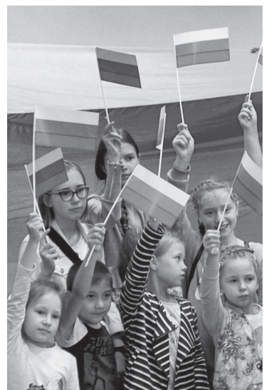
Мы любим свою страну!

На государственном уровне 12 июня начали отмечать лишь в 1995-м. В этот день в Кремле