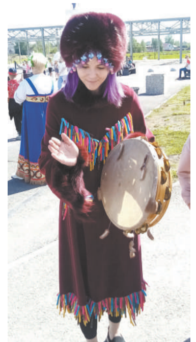
Игры с бубном...