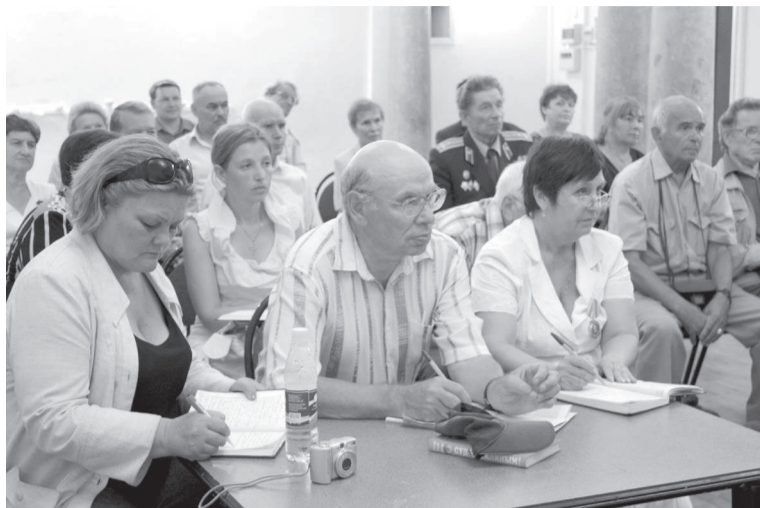
Среди членов КИРФ