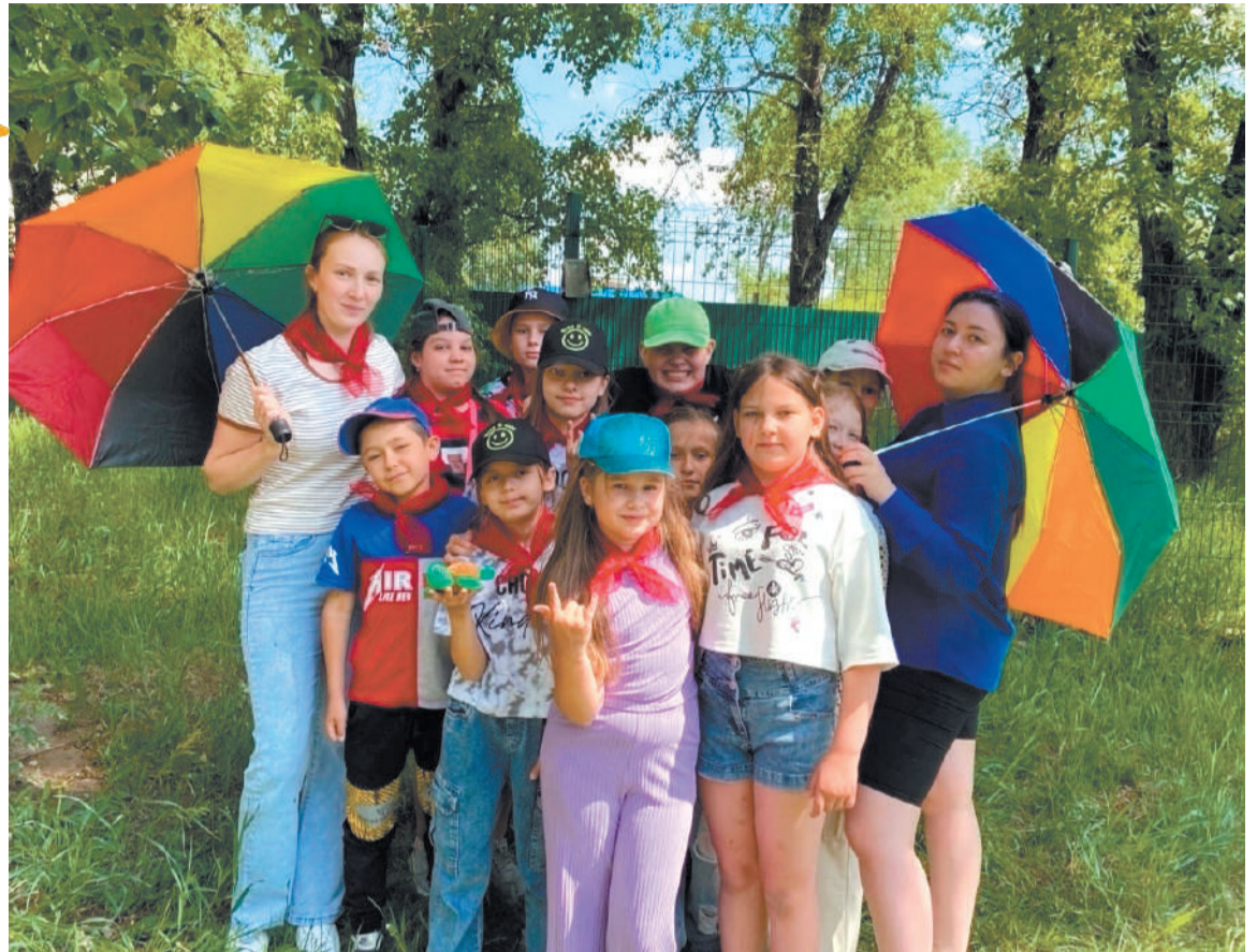
Красочные каникулы (площадка школы № 5)