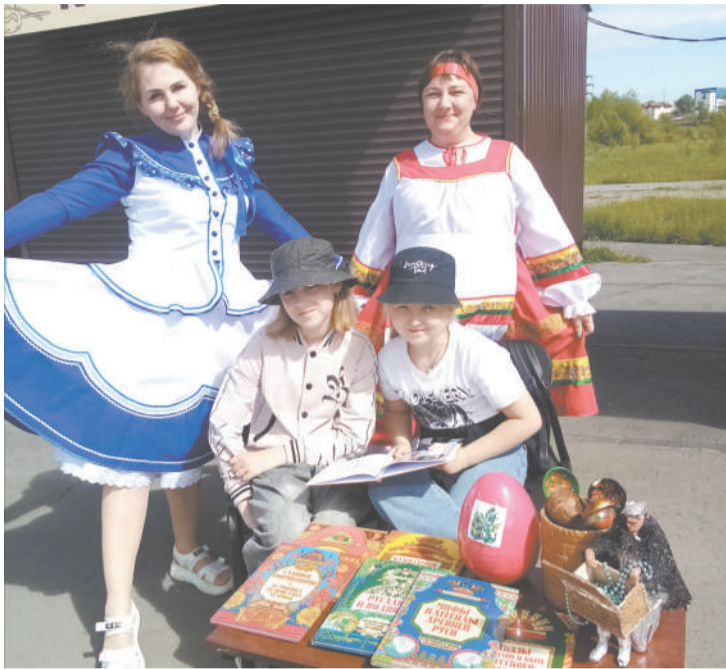
Подходите к нам на сказочную викторину...