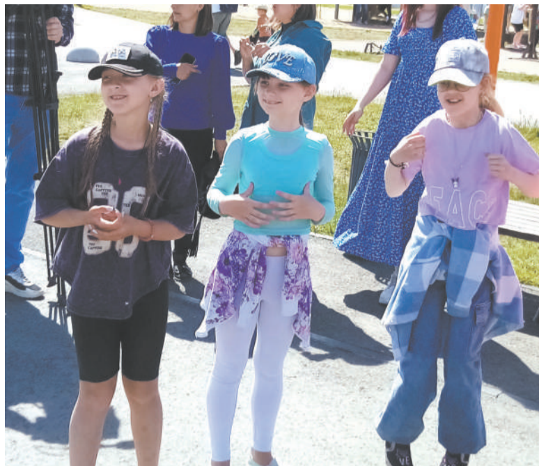
Слушаем правила игры