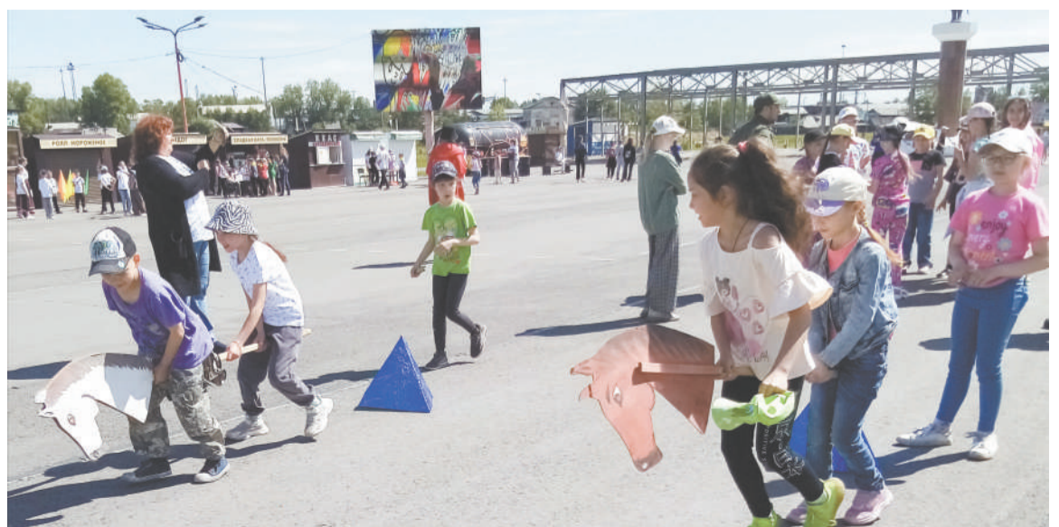
Эстафета с лошадкой