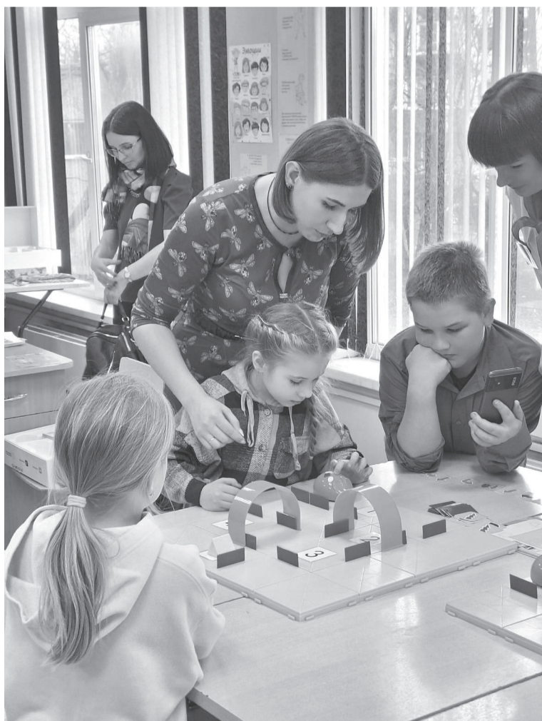
С детьми всегда интересно!