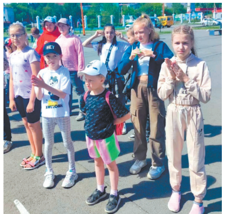
Ребята лагеря дневного пребывания спортшколы «Старт»