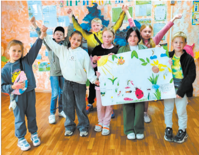
Лагерь «Зелёный островок»