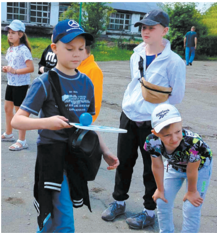
Нам в ДЭБЦ очень весело!

Провести летние каникулы в городе? А почему бы и нет. В Черемхово во многих образовательных организациях и учреждениях дополнительного образования работают лагеря дневного пребывания, в которых отдыхают более тысячи черемховских детей.