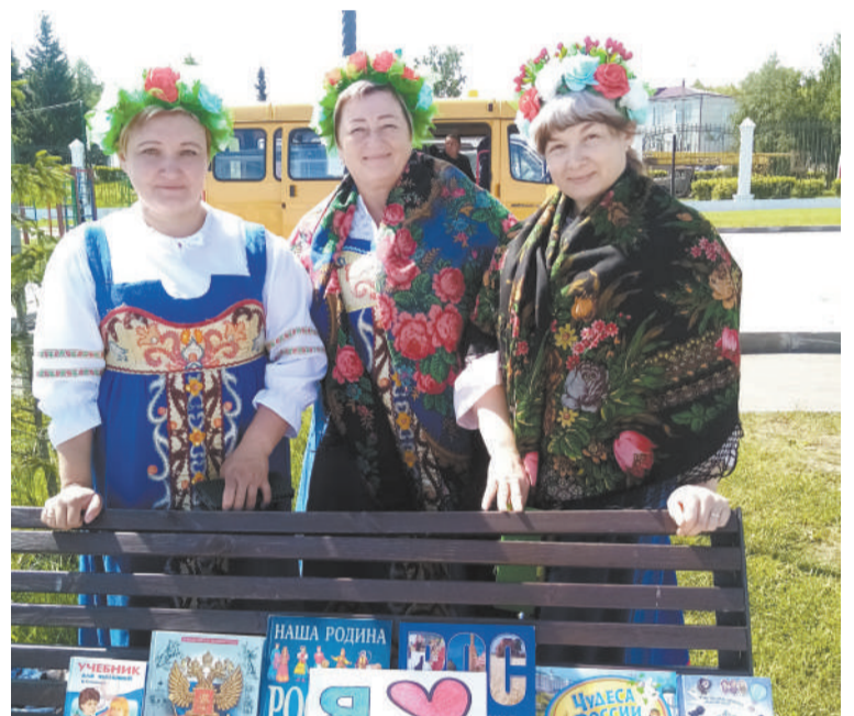
Красотки в русских народных костюмах