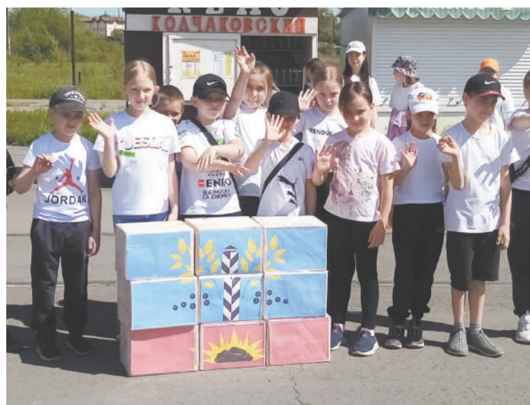
У нас получился герб Черемхово