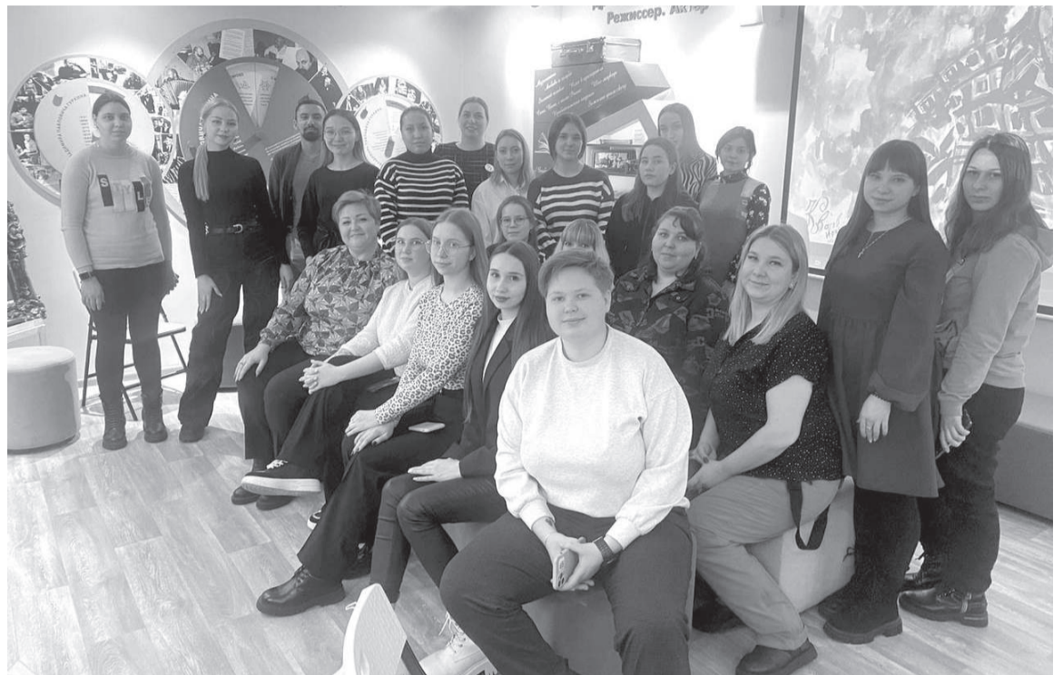
Совет молодых педагогов в музее Гуркина

В зале нашлось немало тех, у кого есть наставники, мудрые навигаторы педагогического