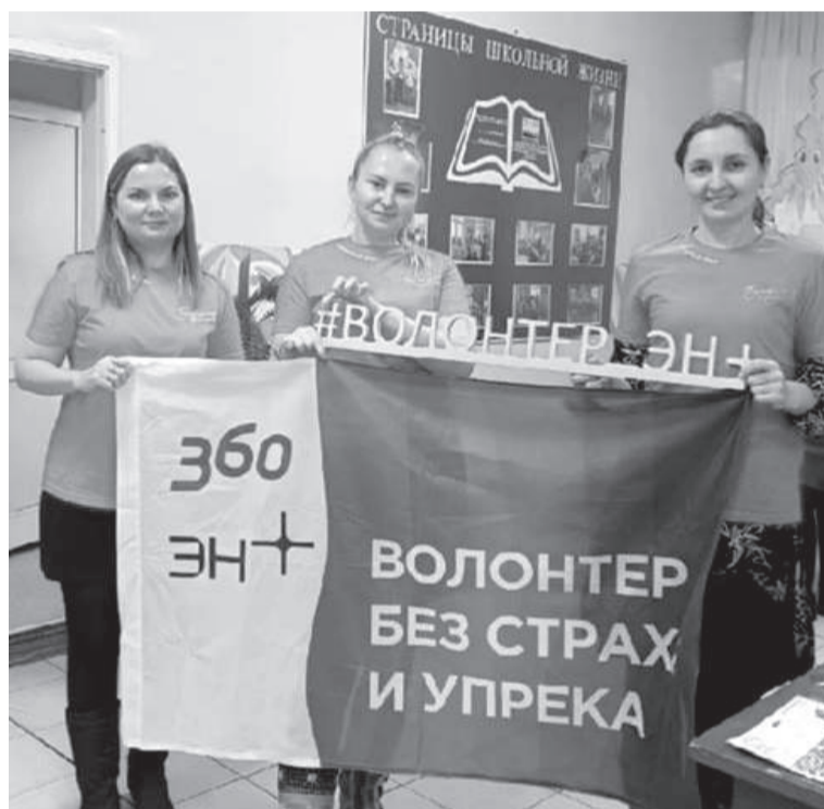
Коллеги – участники волонтерской акции