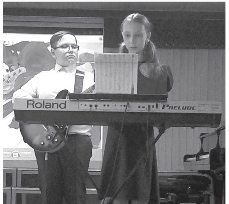
На сцене ансамбль «Орион»