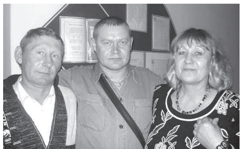
Встреча с любимыми учениками