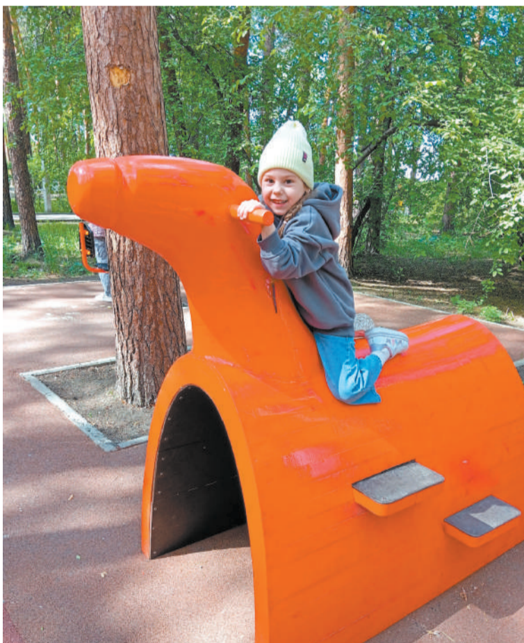
Здорово и весело!