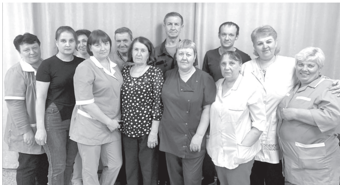
Наш дружный коллектив