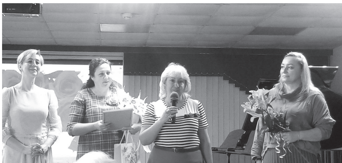
Поздравления от партнёров