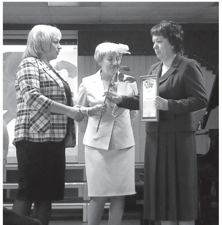
Момент вручения грамот