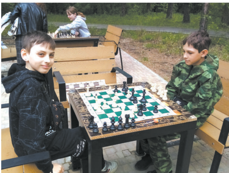
Место для интеллектуальных игр