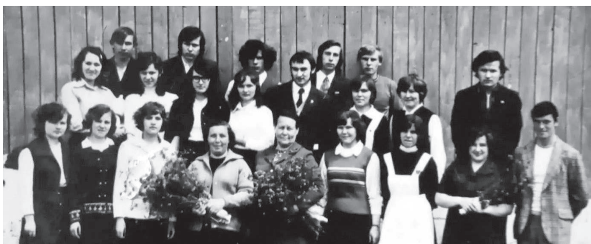
Учились мы читать стихи...