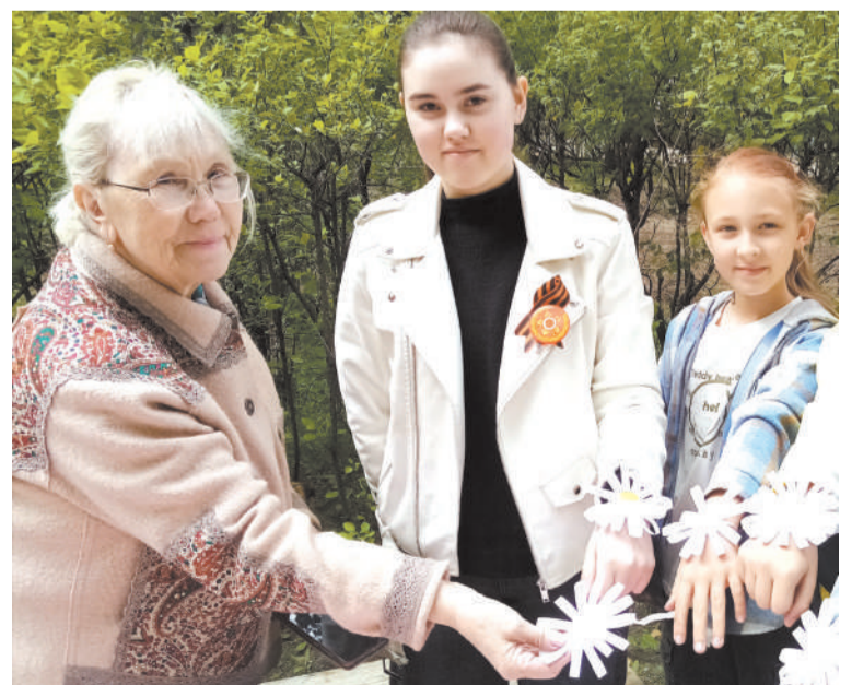
Вот такой браслет ромашка у нас получился!