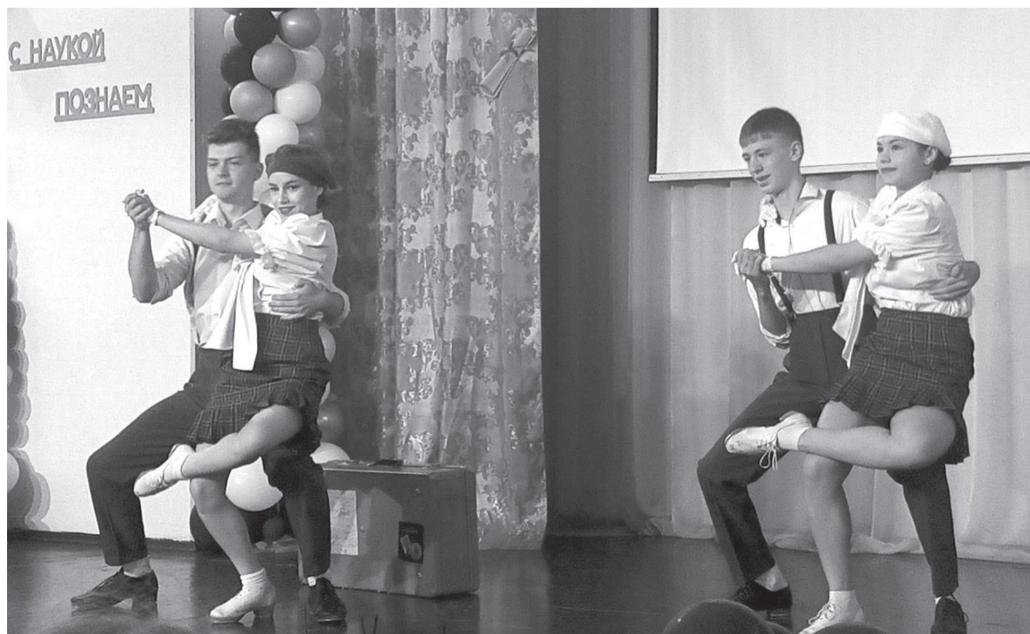
На сцене танцевальный коллектив «Джем»