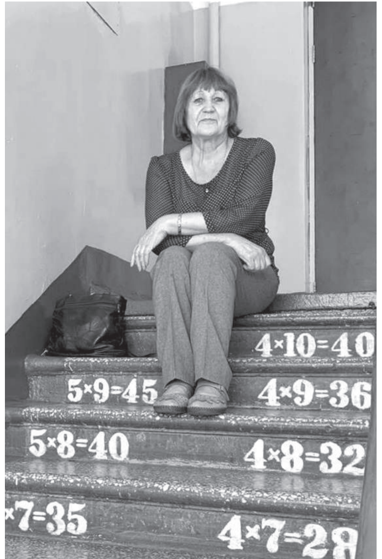
В любимой школе № 30