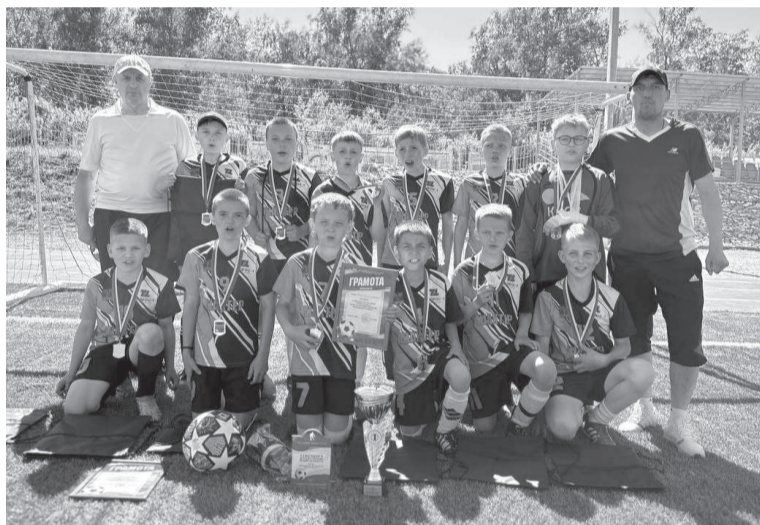
Победители турнира черемховская команда «Шахтер-Сибскана»

Соревнование организовано отделом по физической культуре и спорту администрации города Черемхово, команды награждены Кубками, медалями, статуэтками и грамотами. Благодарим команды за участие, спонсоров за подарки детям. Турнир получился настоящим праздником футбола. Погода выдалась по-настоящему футбольной, солнечной! Все получили массу положительных эмоций и впечатлений от турнира!