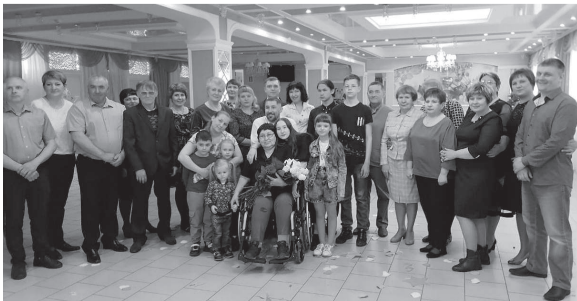
В окружении родных и друзей. Любимый праздник День рождения