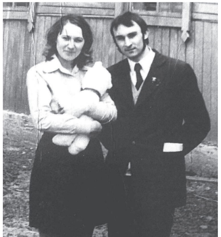
Первый год работы