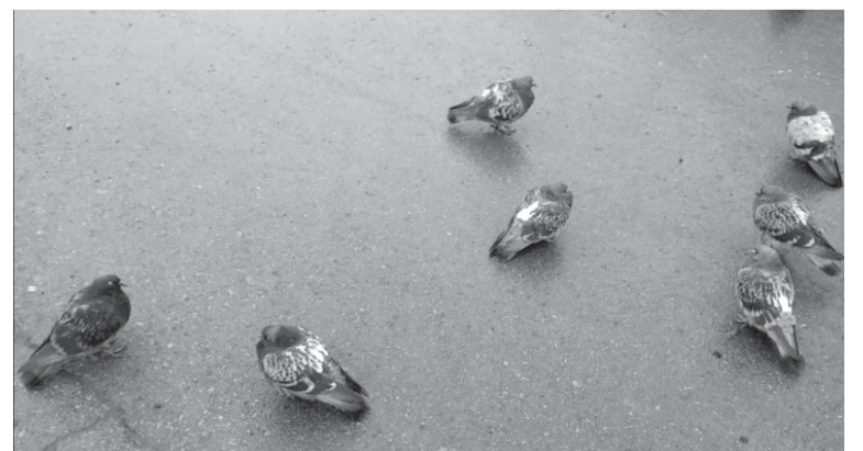
Голуби после дождя