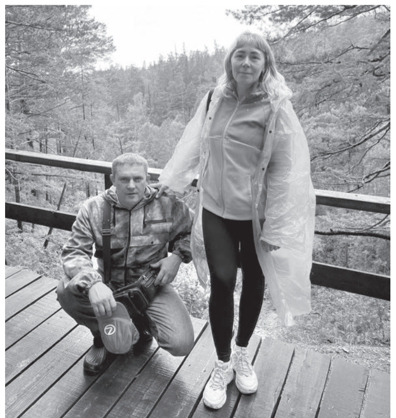
С супругом на природе