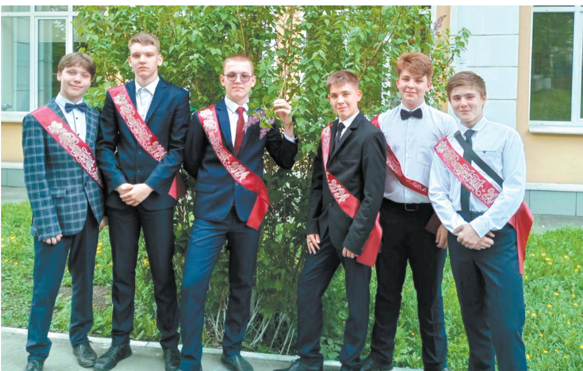
Бравые парни восьмой школы