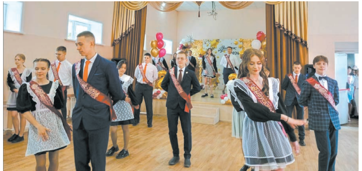
Вальс выпускников в школе № 8

Педагоги поздравляли свои любимые классы со значимым в их жизни событием, пожелали своим девятиклассникам успешной сдачи основного