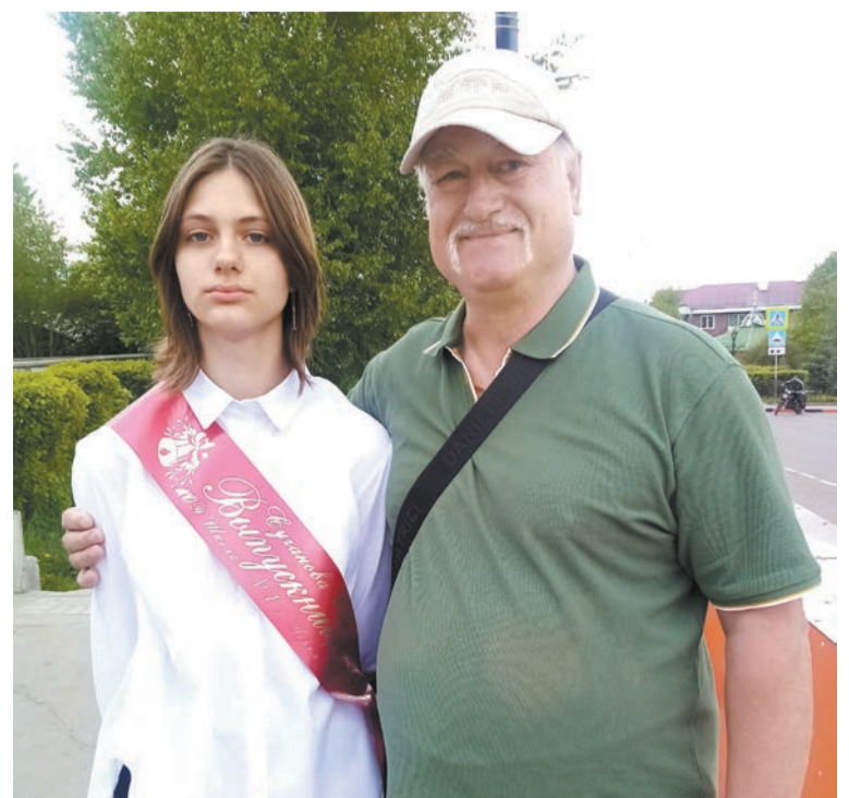
Дедушка пришёл поздравить внучку