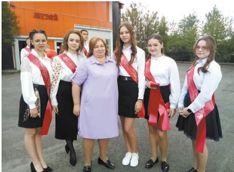
С любимым классным руководителем (девятиклассники школы № 1)

На прошлой неделе в городских школах нашего города прозвенели последние звонки для 225 одиннадцатиклассников и 819 девятиклассников.