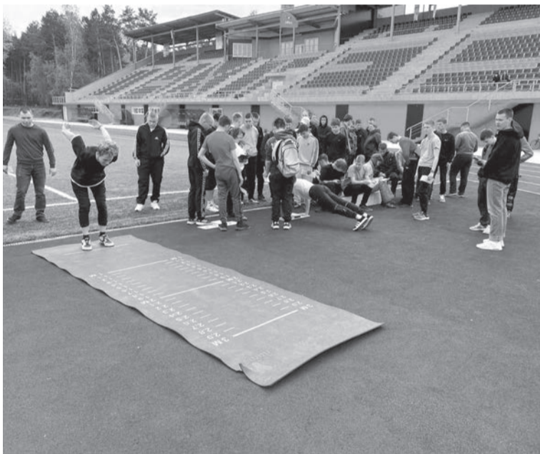
Студенты в движении ГТО

Все студенты успешно справились с прохождением испытаний. Желаем и дальше вести здоровый образ жизни, удачи, оптимизма и дальнейших побед над собой!