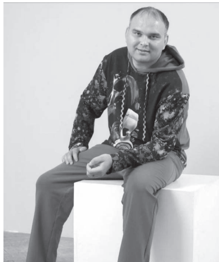
Я всегда непредсказуемый...

Безусловно, в моей работе есть немало сложностей. А у кого их нет? Сложности в том, что приходится быть и художником, и оформителем, и костюмером, и составителем сценариев. Я не занимаю позицию – сидеть