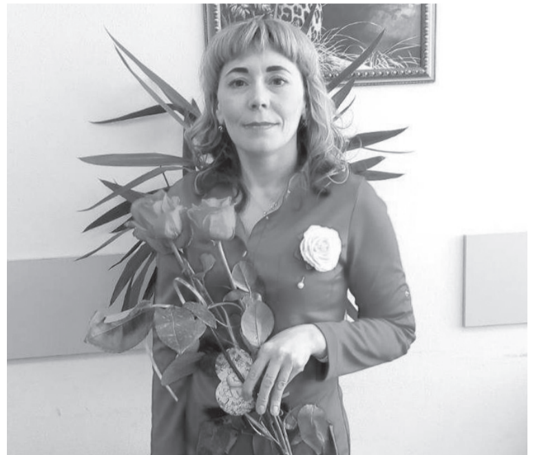
Всегда в хорошем настроении