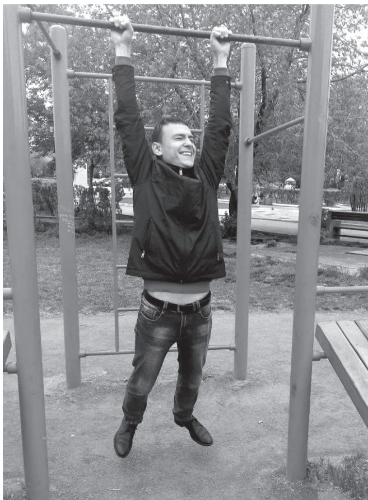
Растём товарищи, растём!