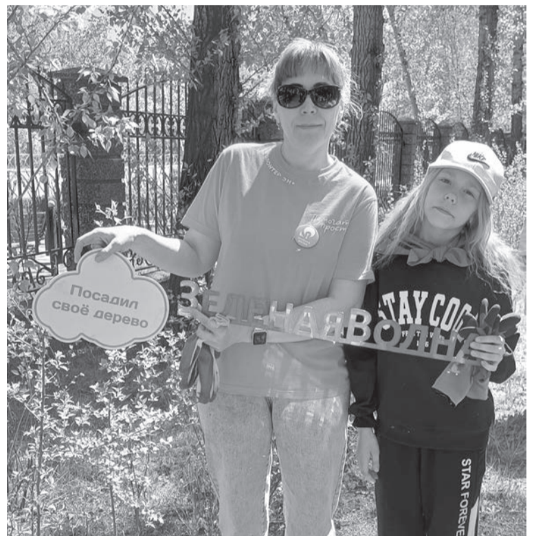
Участие в акции «Зеленая волна»