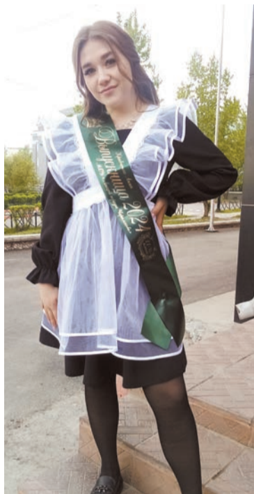
Немного грустно мне...

На прошлой неделе в городских школах нашего города прозвенели последние звонки для 225 одиннадцатиклассников и 819 девятиклассников.