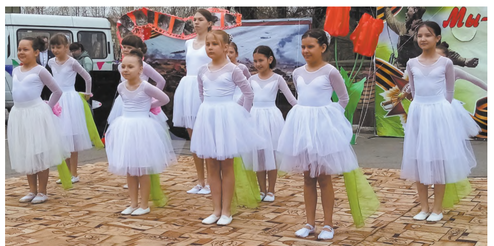
«Цветочный вальс» (хореографический коллектив «Браво» ДДЮ)