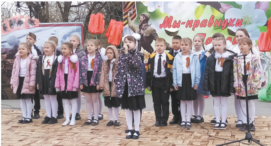
Хор школы № 1