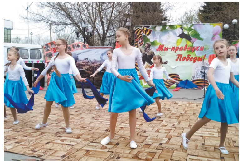
Танец «Синий платочек» (школа № 4)