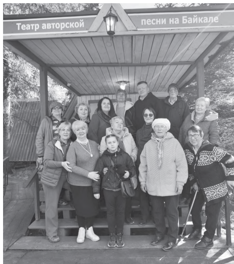
Черемховцы-ветераны в Листвянке