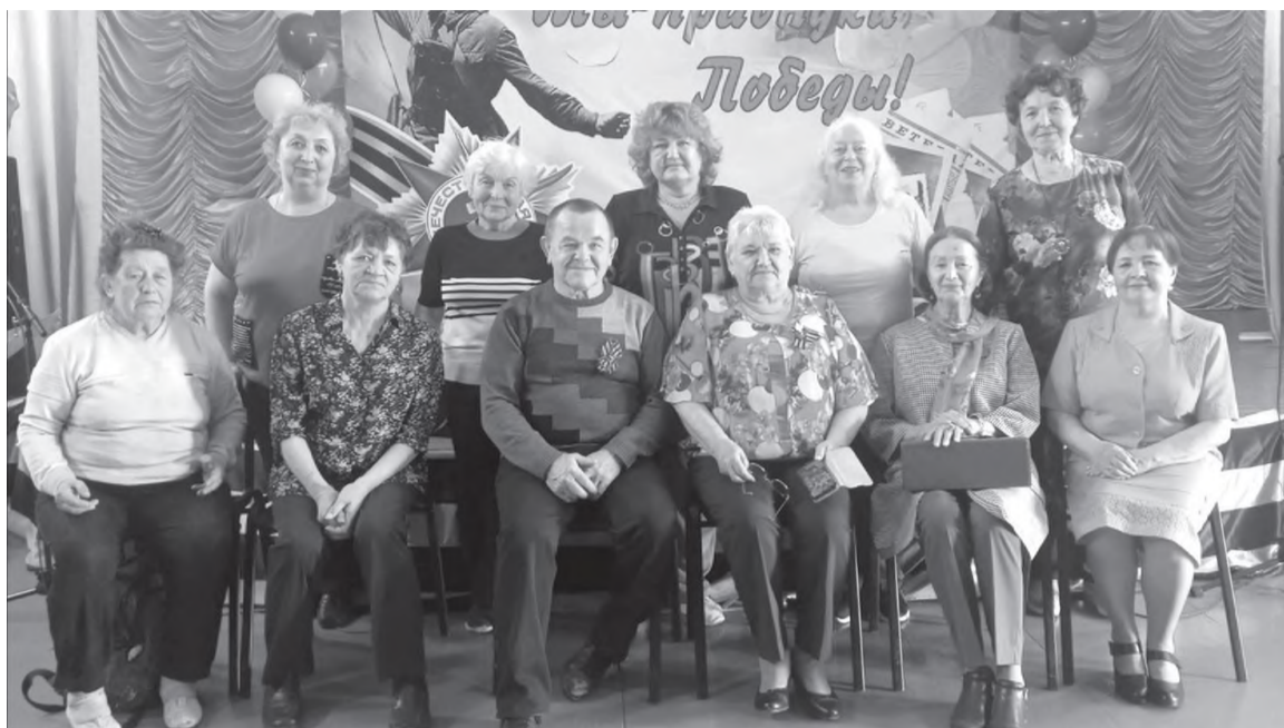
Ветераны-педагоги (участники праздничного мероприятия)

Война закончилась, а жизнь продолжается. Послевоенное время - это время экономического роста, надежд на светлое будущее. Это было время вступления человечества в космическую эру. Жили трудно, бедно жили - всего лишь десять лет прошло, как закончилась страшная война. Не жаловались.