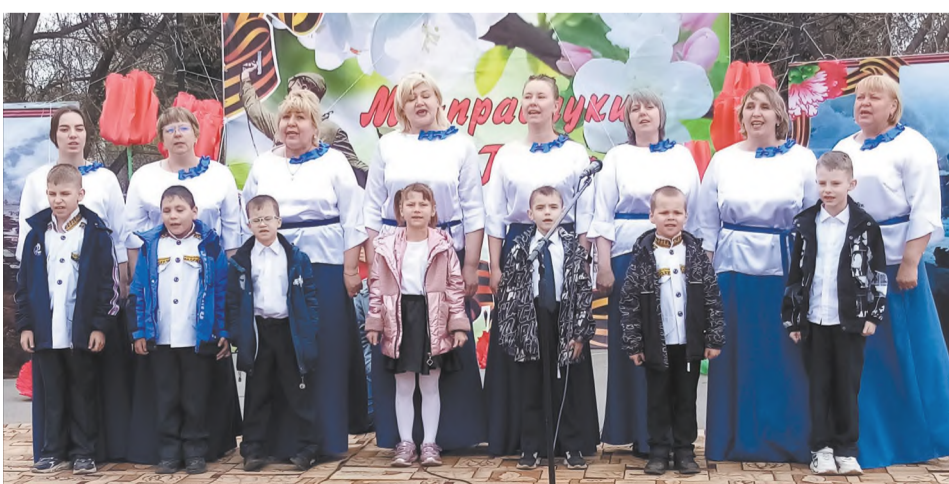
Педагоги и воспитанники детского сада № 43