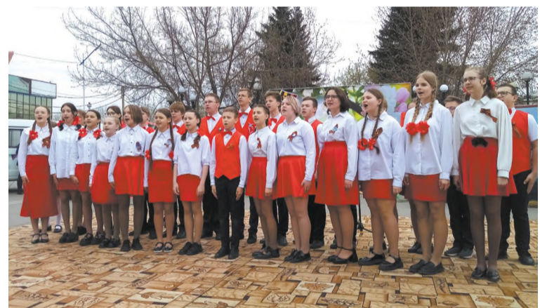
С песней «Россия моя» - хор лица