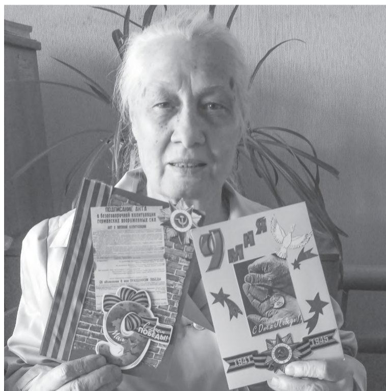
Вот такие праздничные открытки подарили нам дети