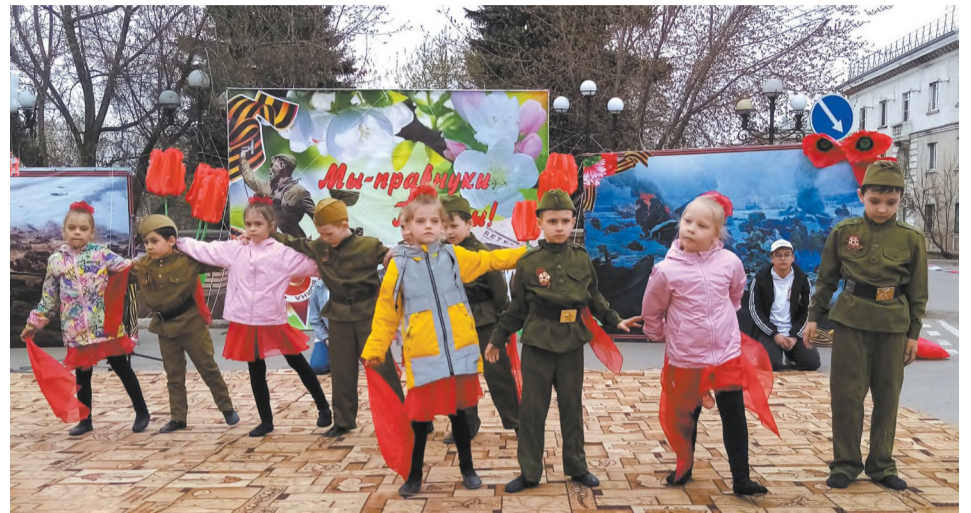
Выступает детсад № 11 «Красные маки»