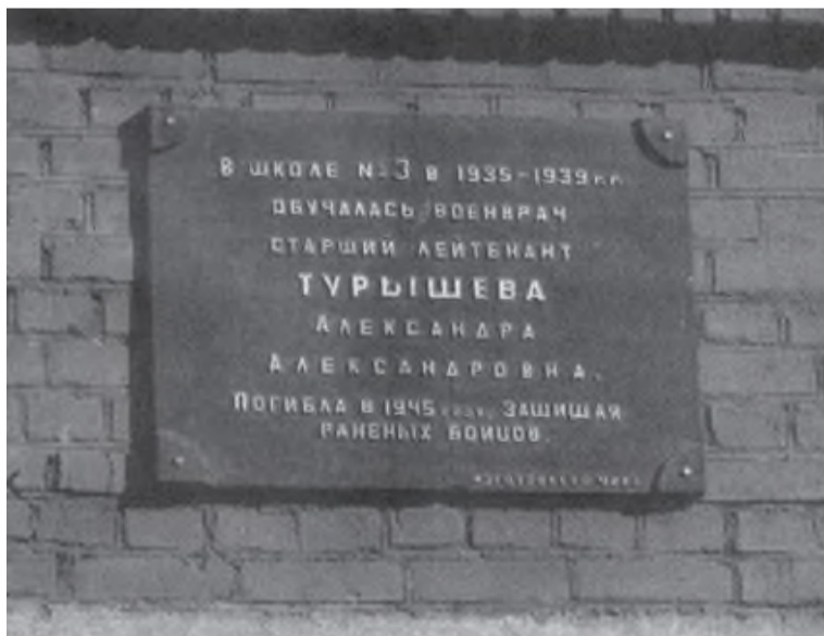
Мемориальная доска на школе № 3