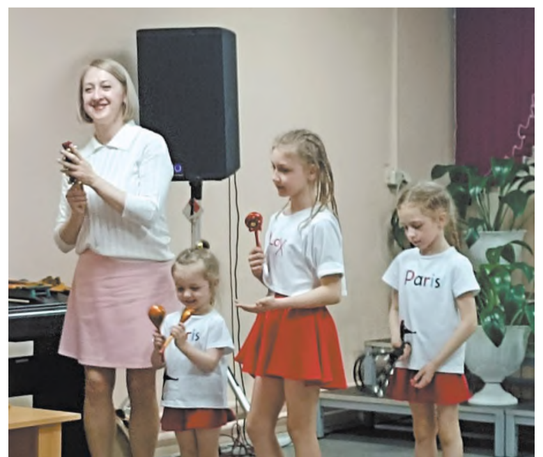
Дружная семья Чеботарёвых