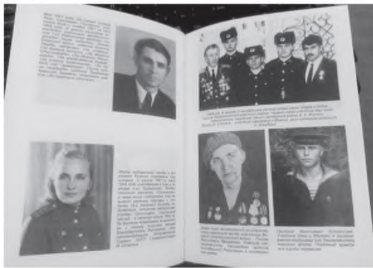
Страницы книги «Память сердца»