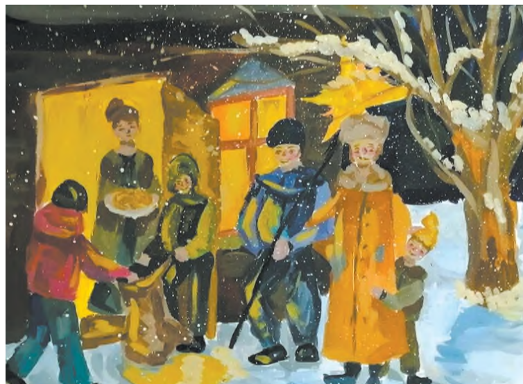
Картина «Рождественские колядки»