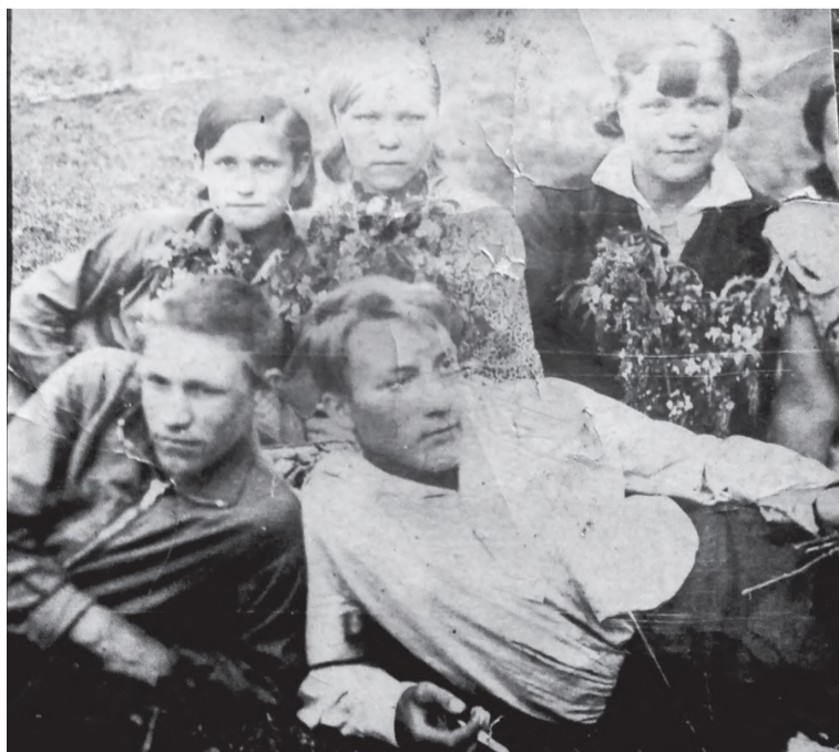
Фото 1940 года. Выпускной вечер