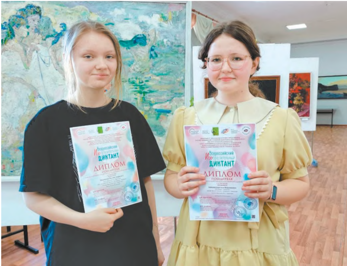
Ученицы ДМХШ № 2 (победительницы конкурса)

В центральном доме работников искусств состоялось торжественное награждение победителей пятого Всероссийского изобразительного диктанта. Этот праздник искусства для детей был посвящен теме года «Наши традиции».