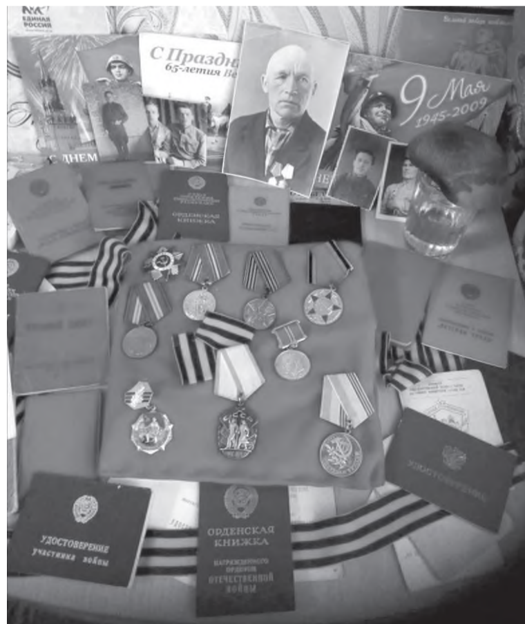
Семейные реликвии бесценны...