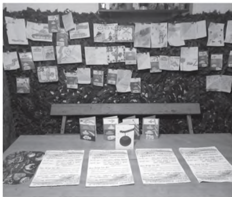
Уголок из детских писем - у солдат на СВО