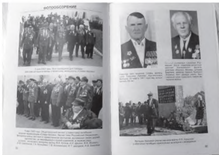
Листая сборник «Вахта памяти»