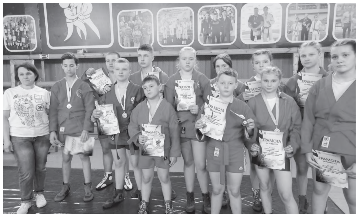
Команда черемховских самбистов

Отдел по физической культуре и спорту города Черемхово