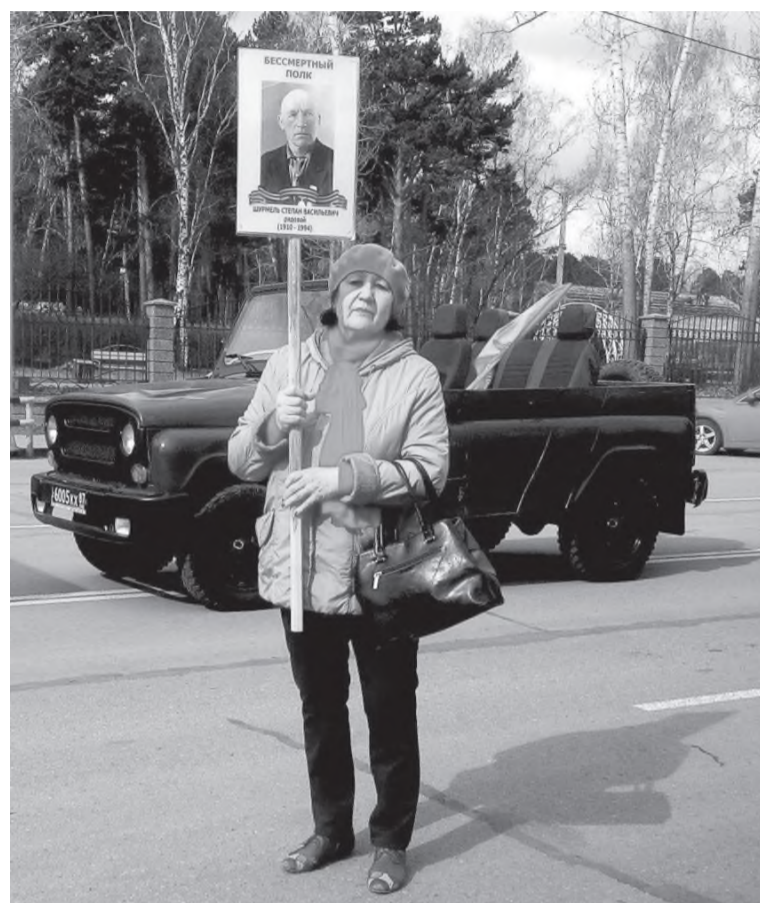
Каждый год я в «Бессмертном полку» несу портрет отца

ласти удостоены звания Героя Советского Союза. И это тоже в нашем «музее». Это тоже моя семья, моя Родина.