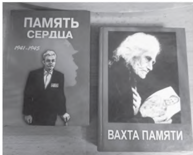
Те самые книги...