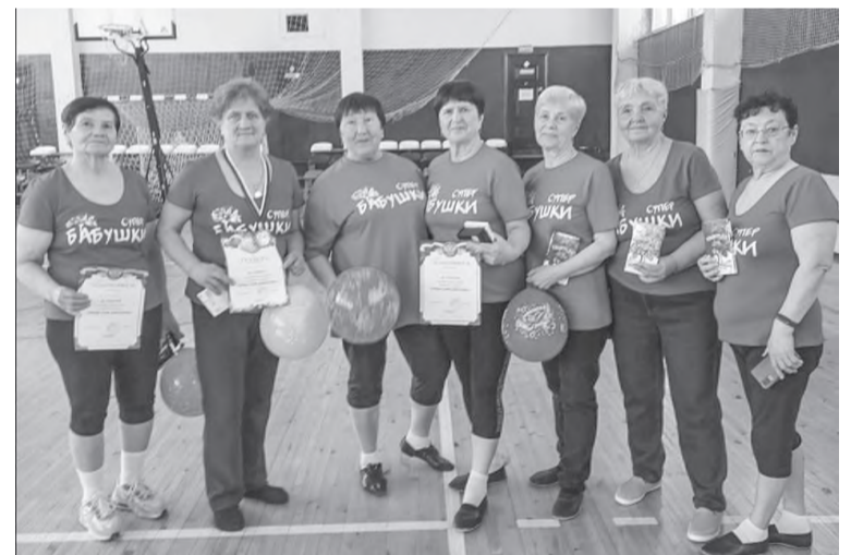
Оздоровительная группа «Супер-бабушки»