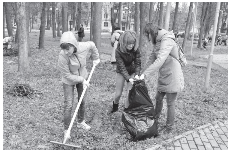
Субботник в наши дни

Помните в «Маленьком принце» А. Экзюпери?! «Есть такое твёрдое правило. Встал поутру, умылся, привёл себя в порядок - и сразу же приведи в порядок свою планету». «Если давать