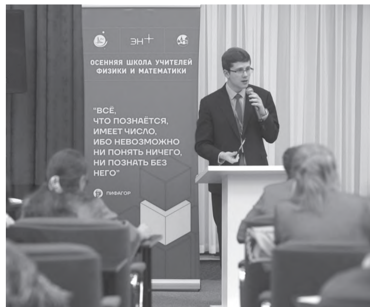
Образовательный проект стартовал в прошлом году с лекций для учителей физики и математики

Олег Дерипаска начал развивать образовательные программы в Иркутской области более 15 лет назад. Сейчас здесь успешно работает система подготовки кадров для энергетической отрасли со школьной