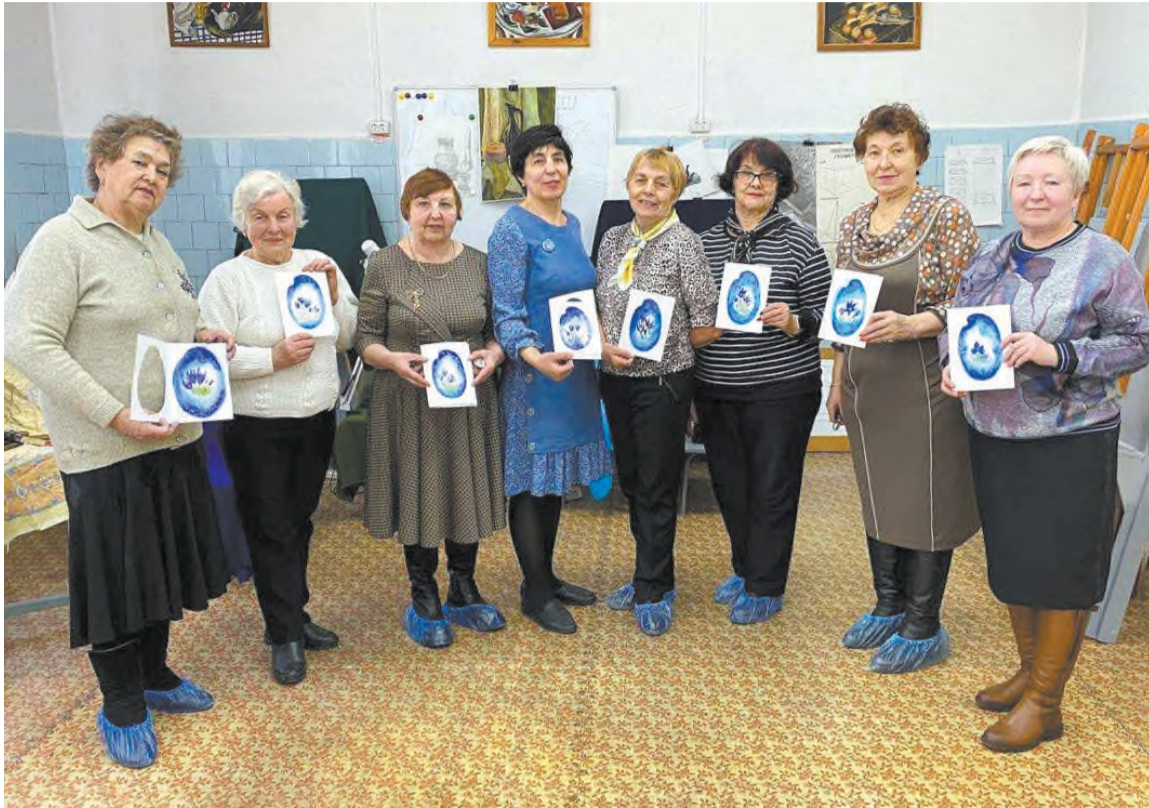
Вот что у нас получилось!