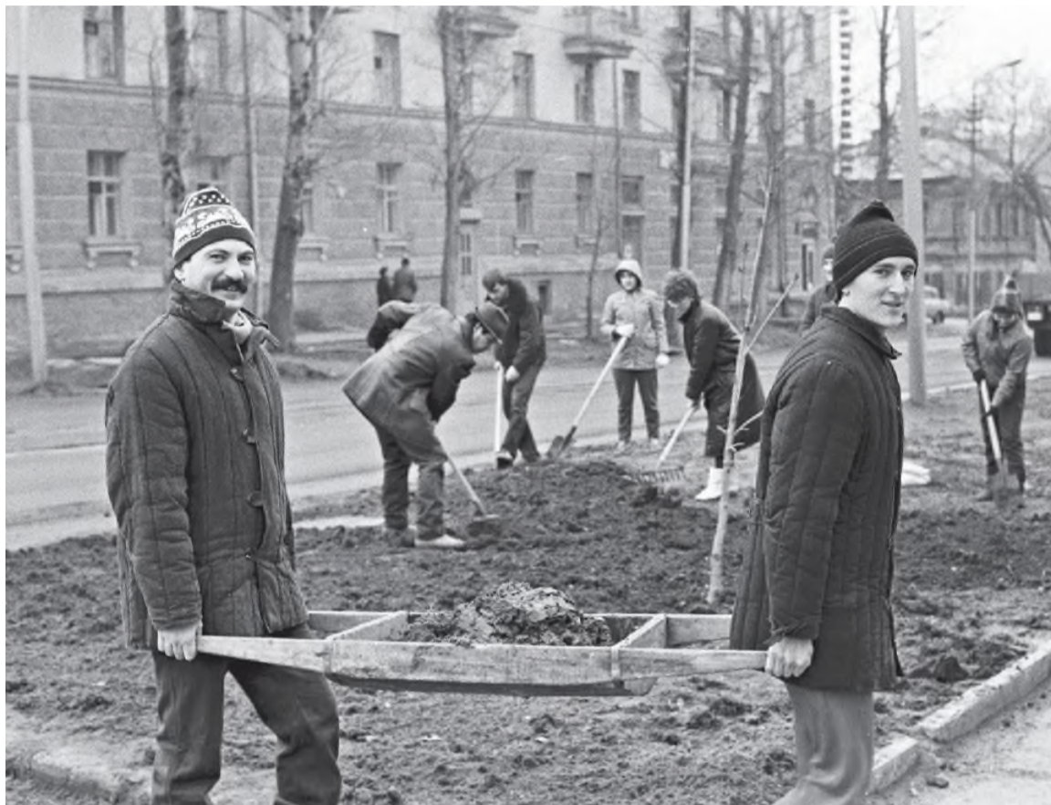
Субботник времён СССР

Но напрасно я так «разнылась»: дом напротив славится своей летне-осенней красотой. Возле каждого подъезда - кра-