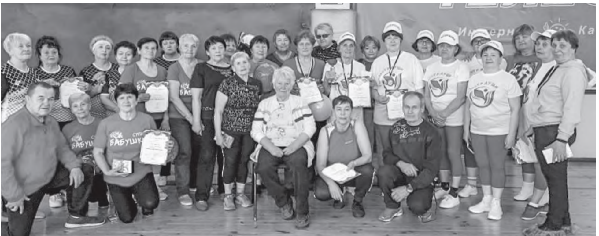
Участники спортивного фестиваля