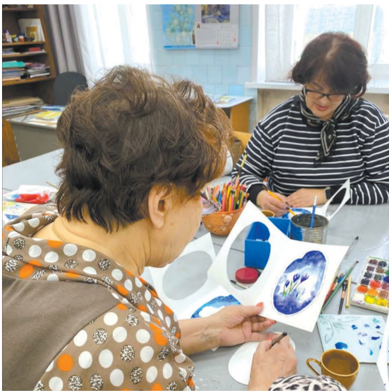
Рисуем с душой...