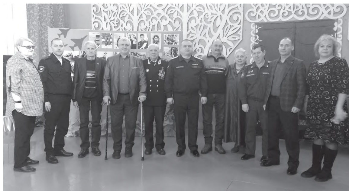
Патриотическая встреча в ДДЮ

Присутствующие на встрече почтили память погибших воинов минутой молчания. Встреча боевых товарищей получилась необыкновенно душевной и теплой.