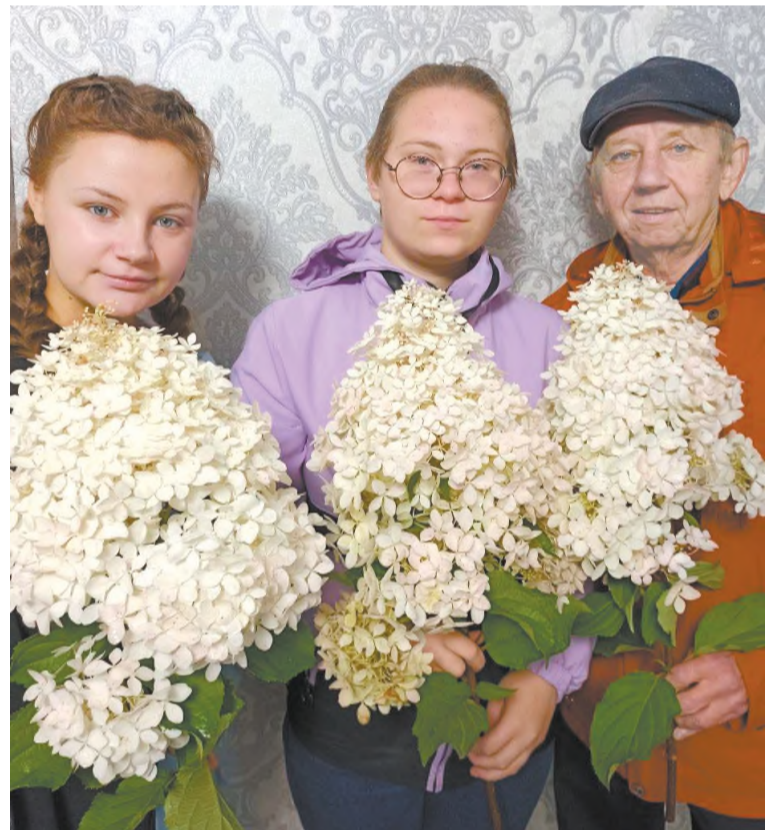
Вот такие гортензии мы выращиваем!