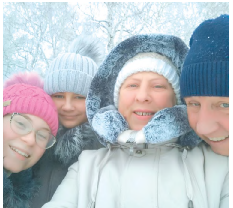
Мы любим зимние забавы