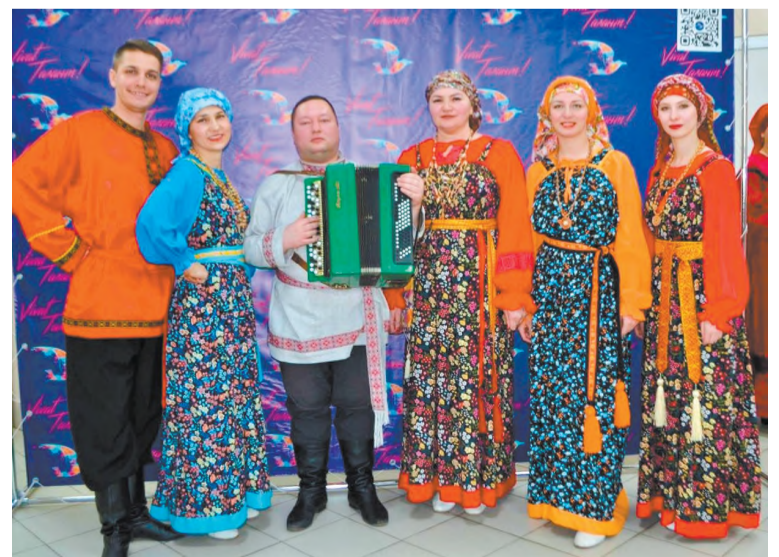
Народный фольклорный ансамбль «Жаворонки»