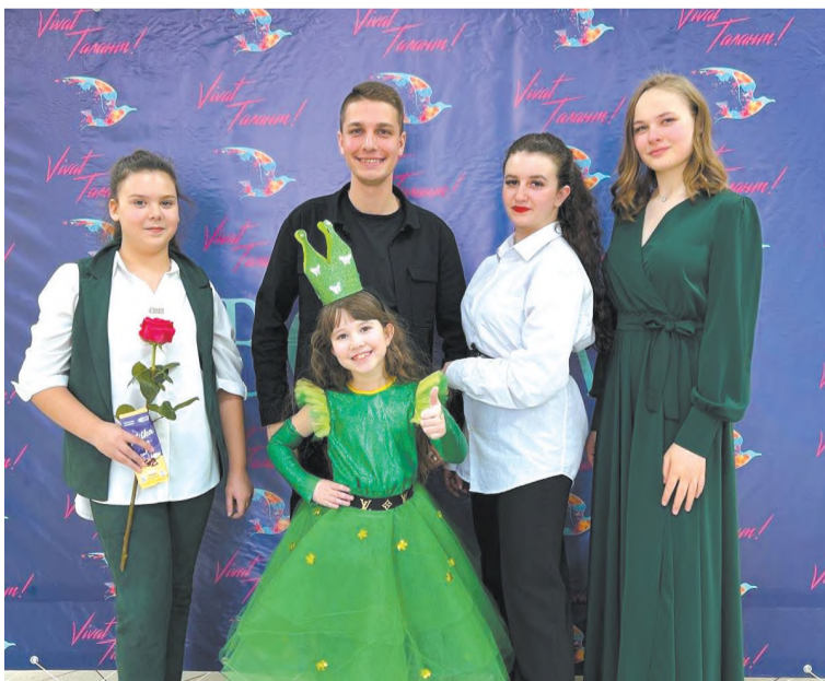
Солистки вокальной студии «Мелодайн»