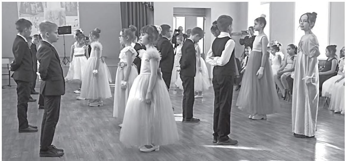
«Минует» танцует 3 «В» класс