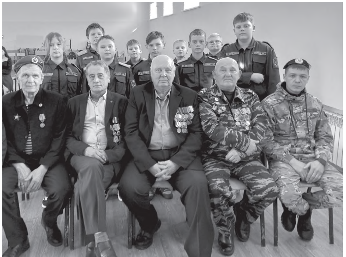
Ветераны в гостях у школьников

Ты служишь достойно, ты всем помогаешь! Честь и хвала, благодарность и слава - Знай, что тобою гордится держава! Минутой молчания школьни-