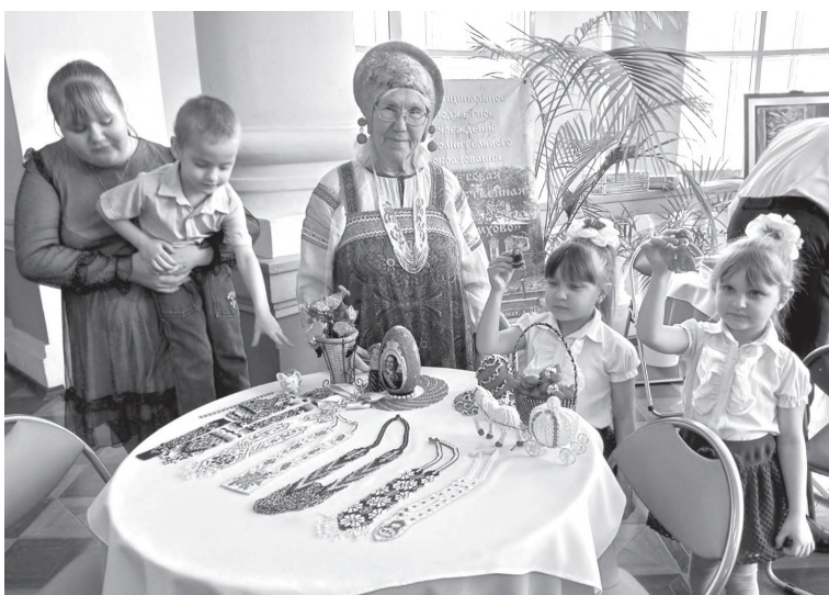
В фойе театра организованы разные выставки