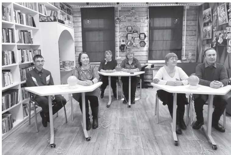
Брейн-ринг в разгаре