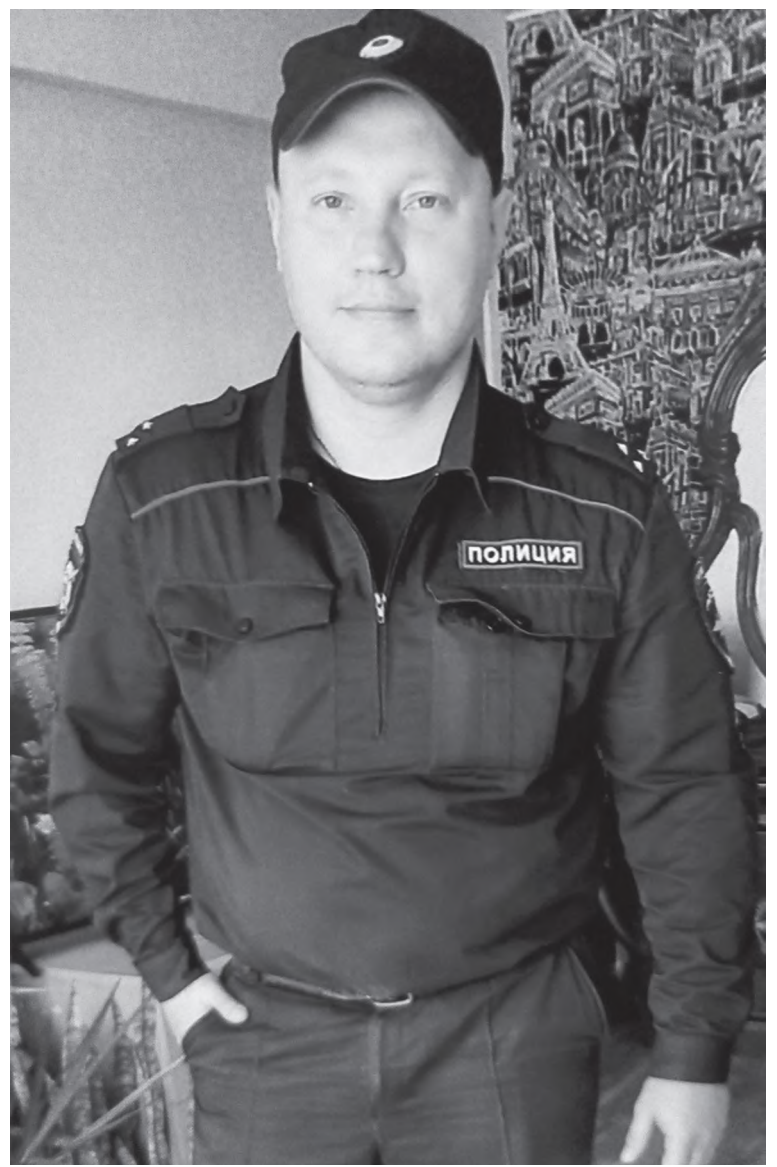
На службе в полиции