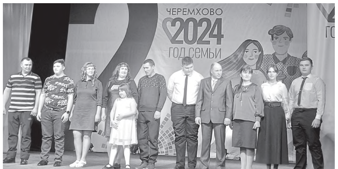
Чествование черемховских семей