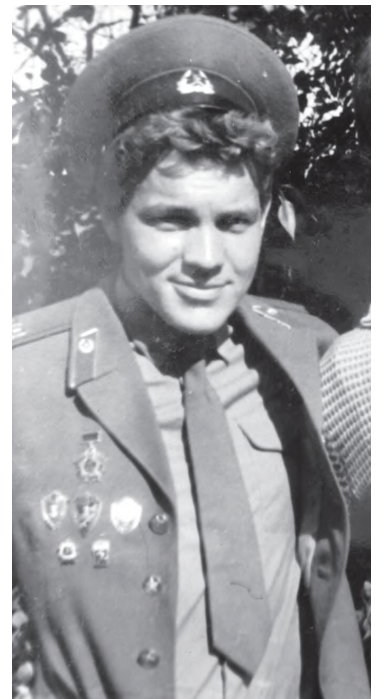
Вернулся со службы

В нашей семье все мужчины служили. Два моих деда воевали в Великую Отечественную войну (один пропал без вести, второй был два раза ранен). Слушая рассказ своего деда о войне, я никогда не думал, что мне са-