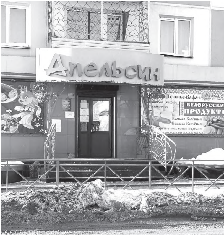
Храмцовка. Тот самый магазин