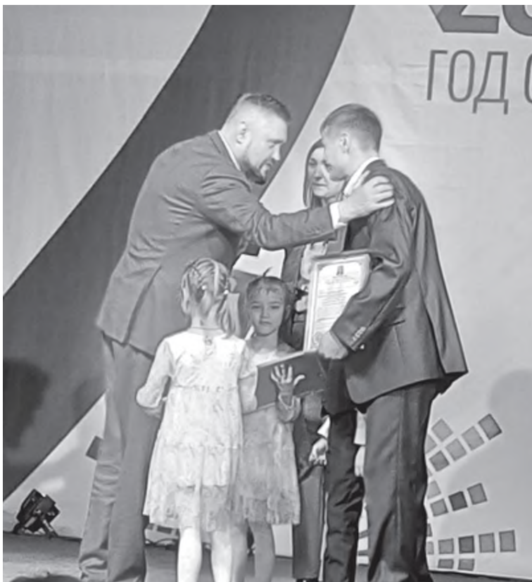
Мэр вручает жилищные сертификаты семьям