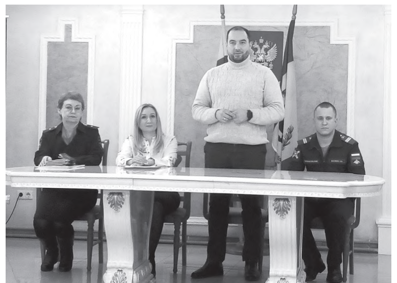
Приглашённые поздравляют ребят