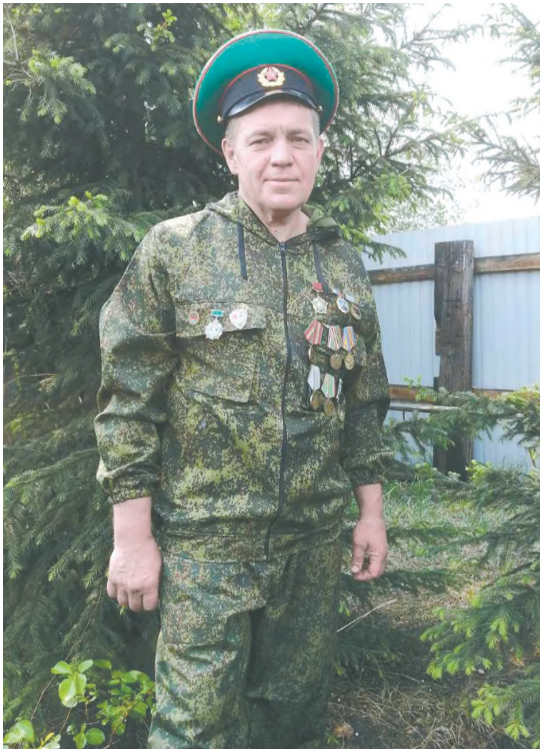
Любимый цвет пограничной формы

В феврале исполнилось 35 лет со дня вывода советских войск из Афганистана. Это знаменательная и героическая страница в жизни всей страны эпохи СССР. В этот день мы вспоминаем о великом подвиге тех, кто с риском для собственной жизни, храня верность Родине, исполнял свой воинский долг. Только через афганскую войну, которая длилась почти десять лет, прошло 620 тысяч военнослужащих, патриотов нашей Родины.