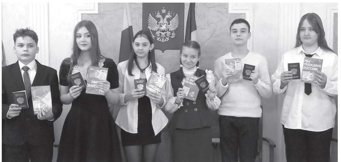
Теперь у нас есть - паспорт!