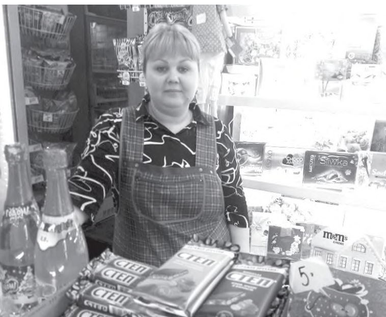
Приглашаем в наш «Апельсин»

- С вахты только. Забежал за подарком дочери. Смотрите, какую красоту мне девчата сотворили! Люблю у этих людей покупать. С добротой к людям относятся. - За качеством сюда хожу. Всегда свежее. - Я хожу сюда редко. Но знаю: если что нужно, тут есть. (Из диалога с покупателями «Апельсина»)