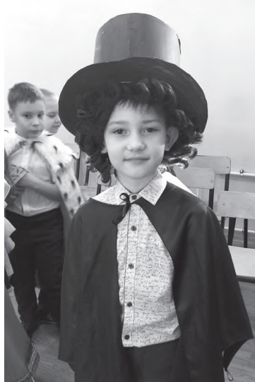
А вот и сам Пушкин