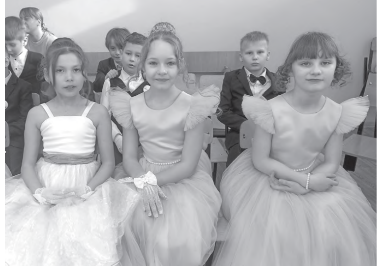
Юные дамы на балу