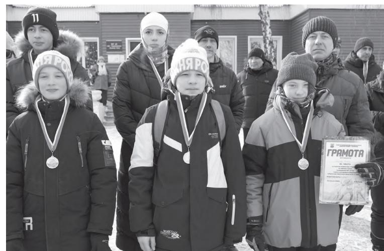
Победители и призеры лыжной гонки

Отдел по физической культуре и спорту города Черемхово