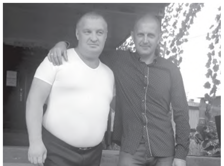
Спустя много лет. Гордимся своей мужской дружбой!