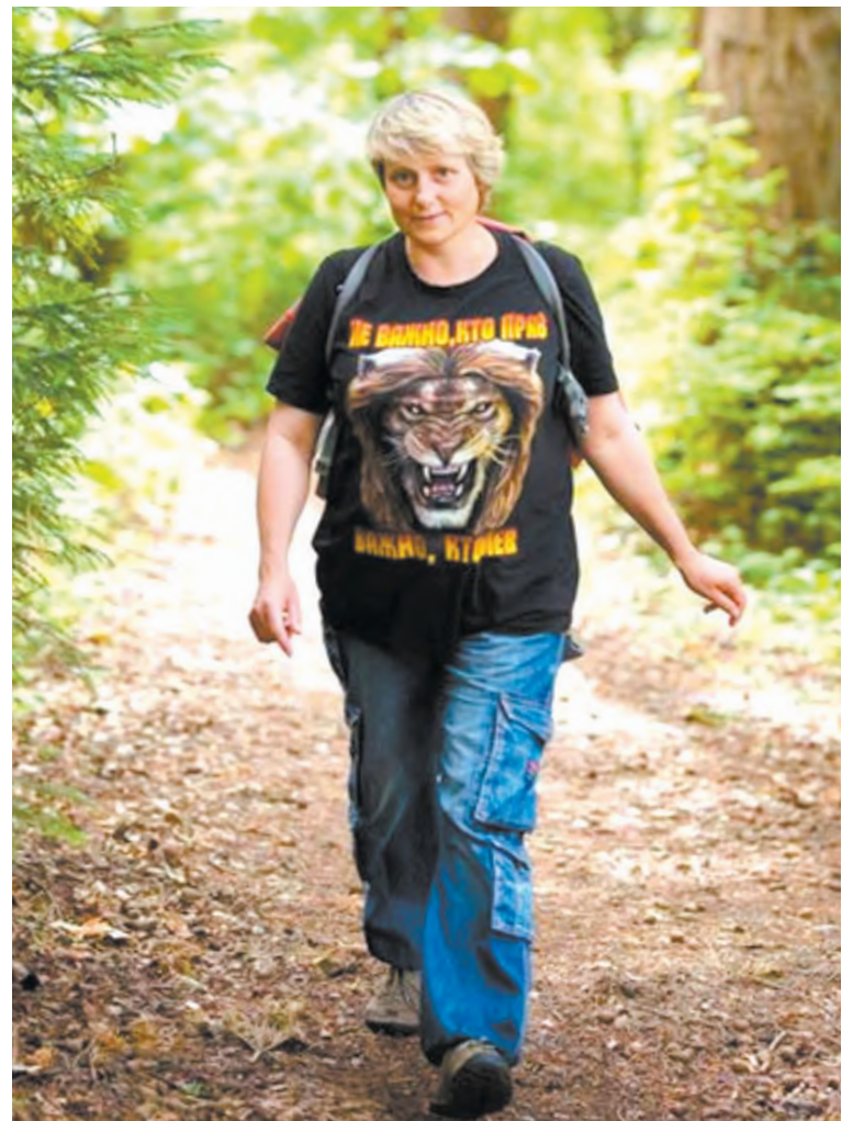
Как здорово шагать по лесу...

- В приметы верить перестала, считаю, что всё это несерьёзно и всё в моих руках. Если задумаю что-то, обязательно стремлюсь к этому и не реагирую ни на какие приметы. Из времён года больше всего люблю лето, потому что именно оно даёт больше возможностей в плане путешествий. Хотя и зимой тоже неплохо. Что касается чтения, то я очень люблю книги. Люблю читать Булгакова, Лукьянова, а также научную фантастику,