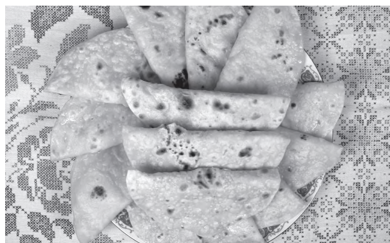
«Кыстыру» - татарские лепёшки