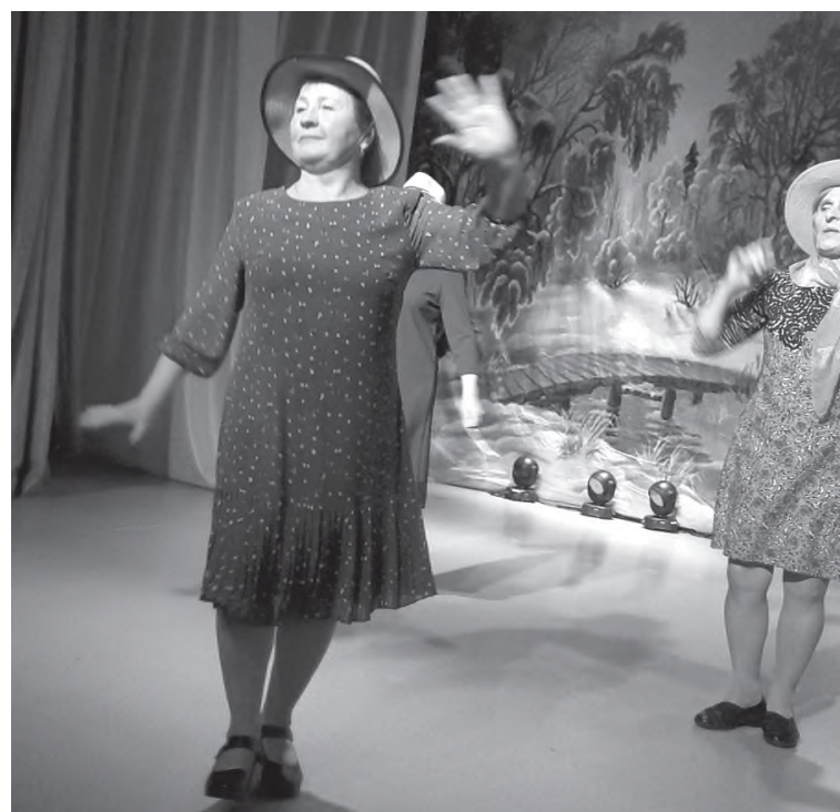
«Вдохновение», куда мы ещё не раз обязательно заглянем.

«Шляпа мыслей», конкурс весёлых поговорок, «Угадай, что за место», конкурс костюмов и другие забавные задания проводила ведущая одно за другим. В этот вечер никто не скучал, наоборот, вдохновение било ключом. Танцевали, шутили, рассказывали анекдоты, пели песни – всё, как говорится, прошло на одном дыхании. Расходиться не хотелось, уж очень интересной стала нынешняя встреча в клубе