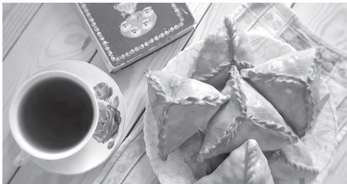
Те самые треугольные пирожки «Эчпочмак»

Манты – замечательное татарское блюдо, которое поражает не только потрясающим вкусом, но и аппетитным внешним видом. Сочные и сытные манты делают из баранины и говядины. Кроме того, в меню татарской кухни пользуются популярностью нетрадиционные для нас варианты: сладкие манты с фруктами, дополненные йогуртом или фруктовым (ягодным) джемом, а также острые манты, фаршированные маслом и сыром.