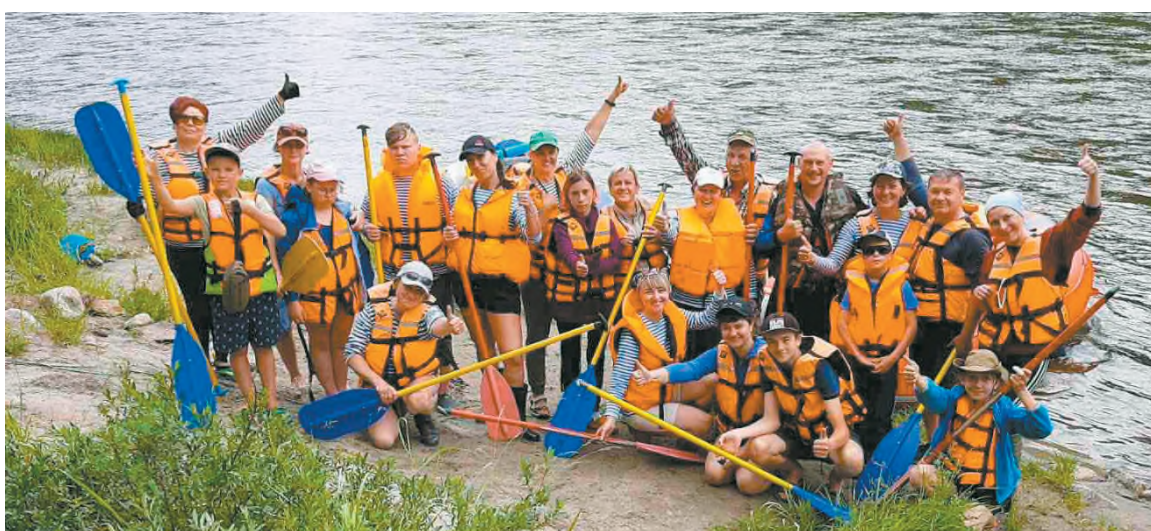
Елена в команде туристов