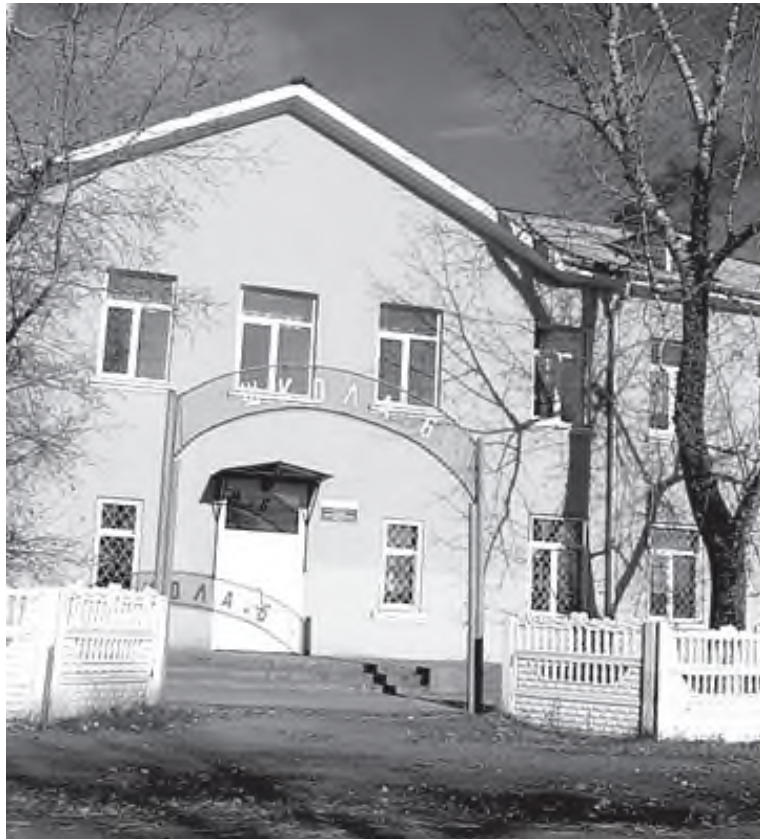
Школа № 6 п. Касьяновка

Школьная воркаут-площадка и интерактивное ограждение для детского сада появятся в этом году в Черемхово при участии компании Востсибуголь (входит в холдинг Эн+). Предприятие поддержало предложение горожан и взяло на себя затраты по первоначальному взносу, который позволил проектам пройти отбор и получить финансирование из областного и муниципального бюджетов.