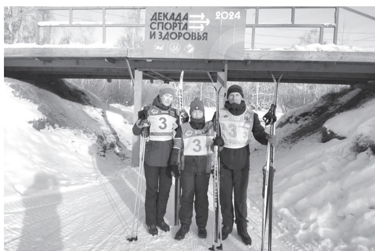
Семья Крайних на семейной лыжной эстафете