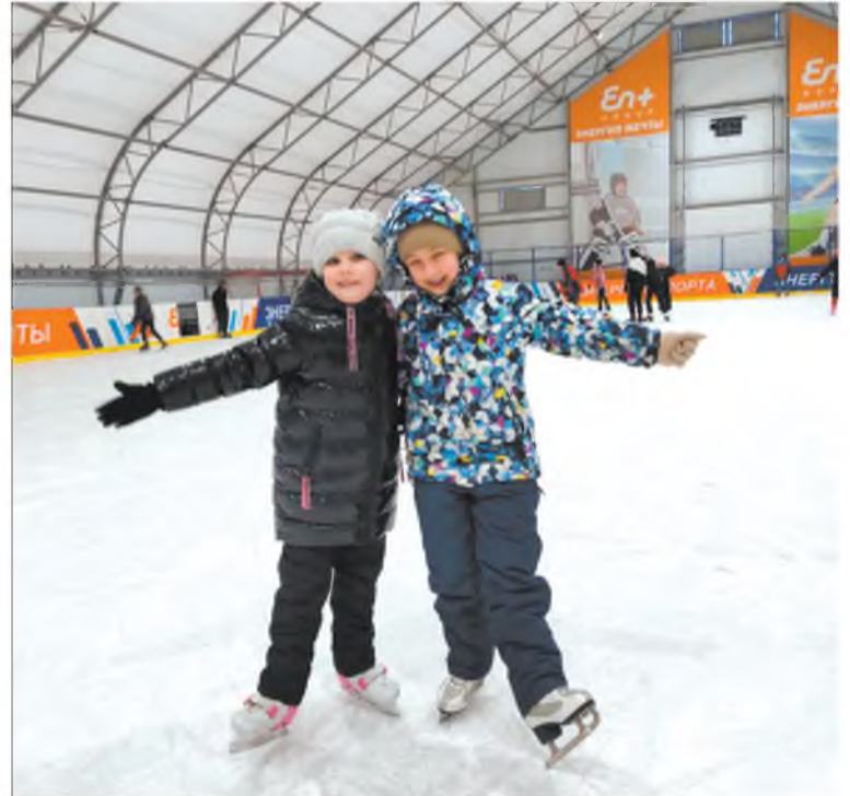
В зимний денёк – мы на каток