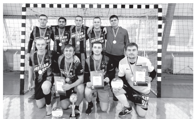
Команда победителей рождественского турнира по мини-футболу «Сибирский медведь Z»