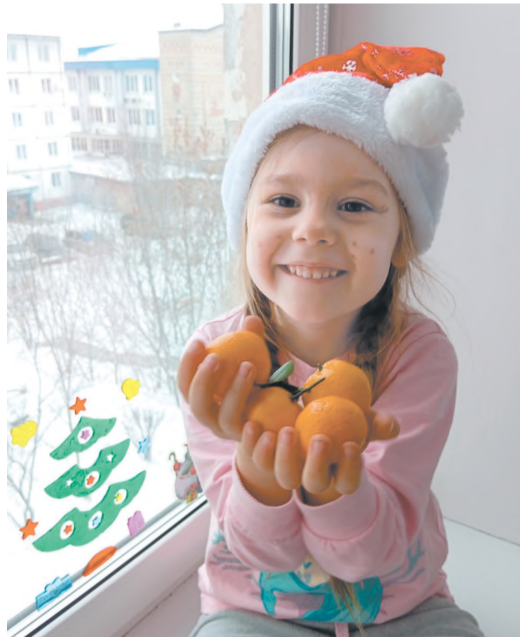
Счастлирое мандариновое время – каникулы!