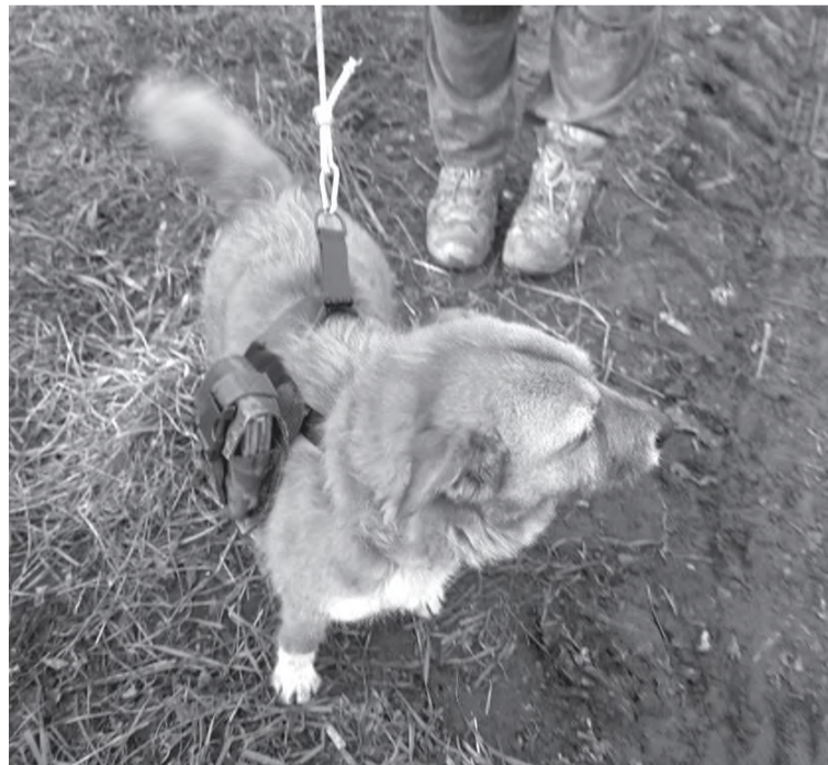
Собака с позывным «Рыжая»