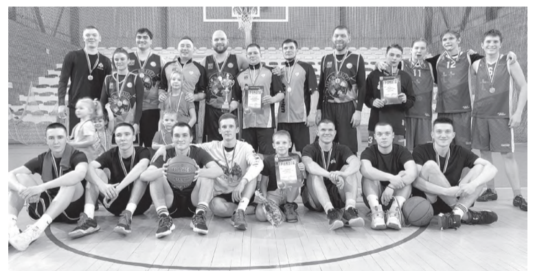
Новогодний турнир по баскетболу

Отдел по физической культуре и спорту города Черемхово