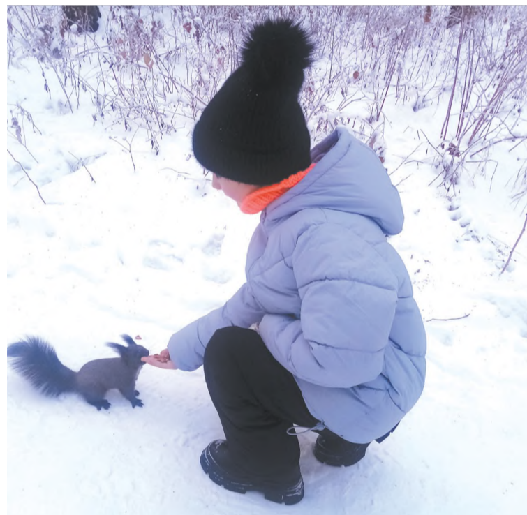
Прогулки по парку. Покормим белочек.