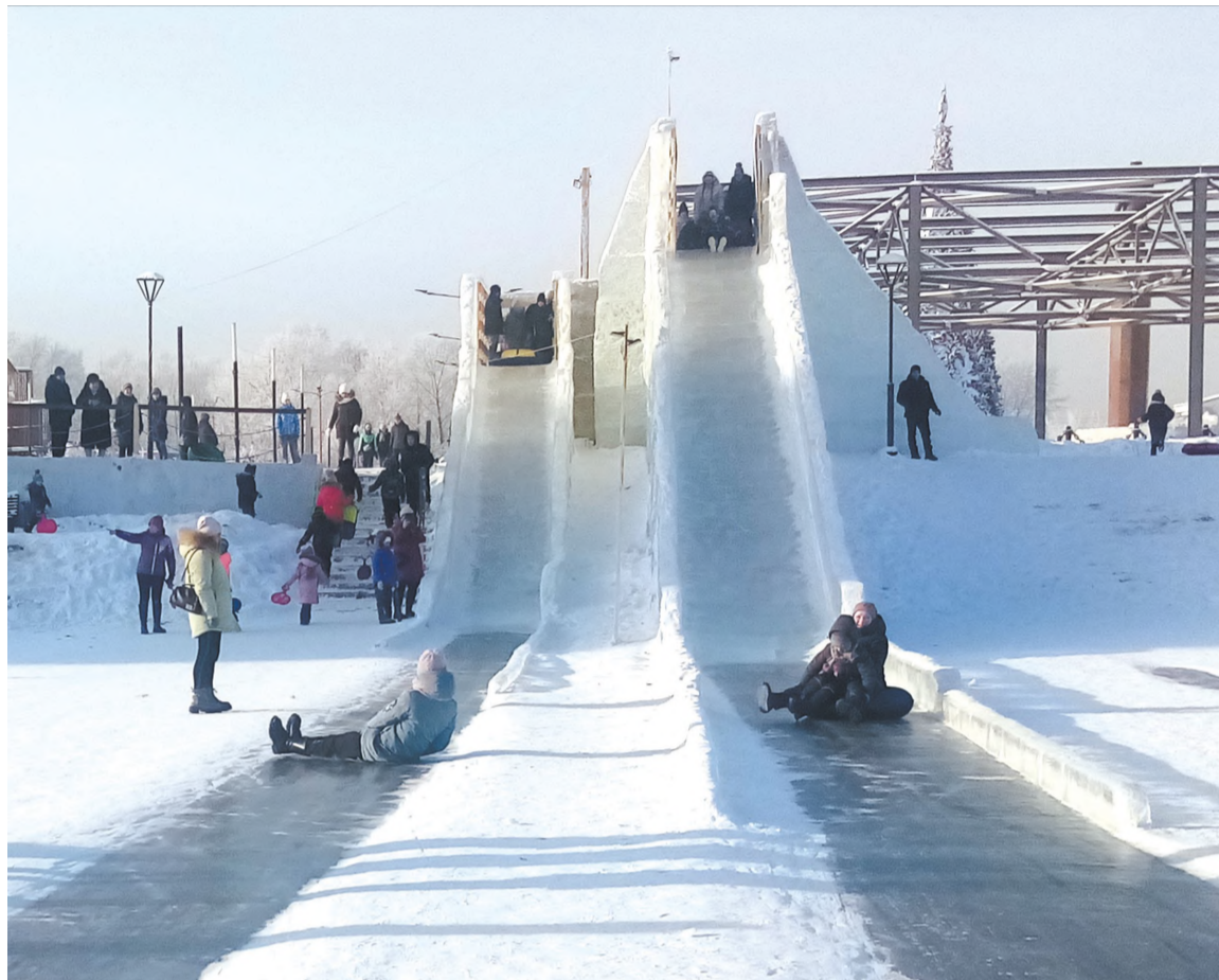
На городских горках (Александровская площадь)