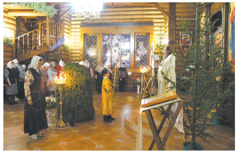
Фото из Свято-Сафрониевского храма г. Черемхово

Рождество Христово - один из двух важнейших христианских праздников, посвящённый рождению сына божьего Иисуса Христа.