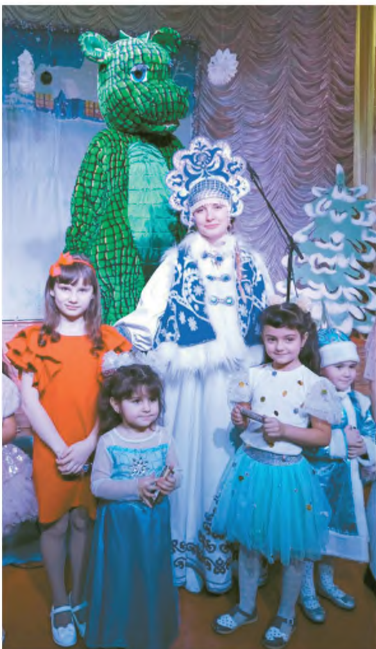
На празднике весело!