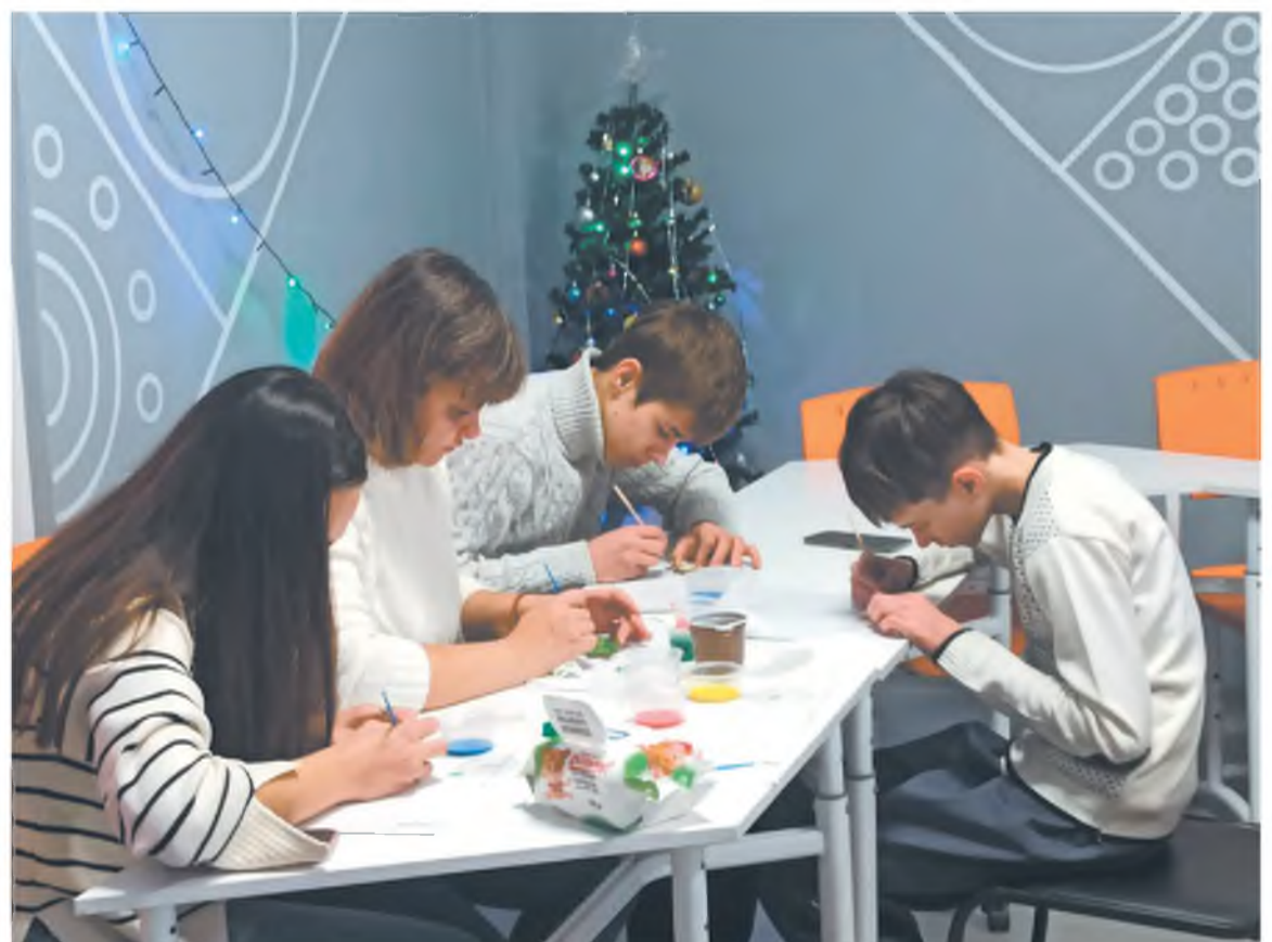
Мастер-класс в городском музее