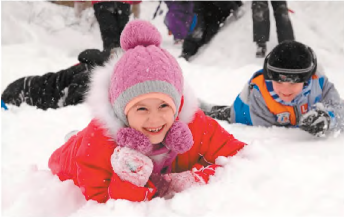
Эх, снег, снежок! Здорово!