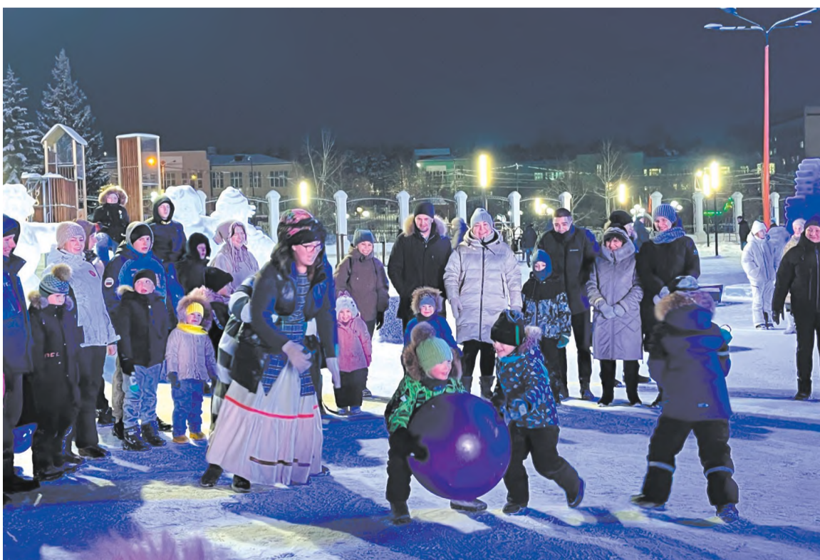
Весёлые развлечения от Дворца культуры «Горняк»