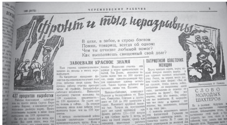
Статьи о жизни в тылу