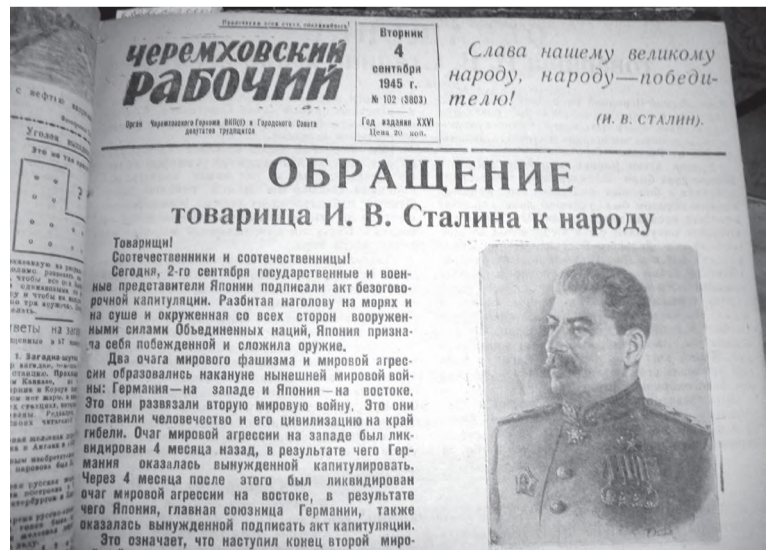
Газета 1945 года выпуска (сентябрь)