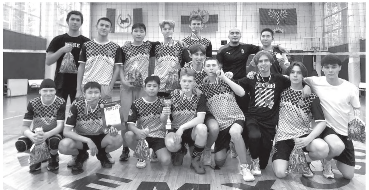
Команда юношей «Шахтер» - победители волейбольного турнира