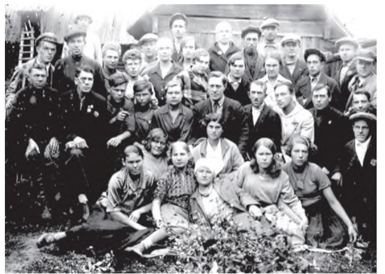
Работники газеты 30-х годов

Перебирая наш архив, мы отыскали интересные полосы «Черемховского рабочего» разных лет и даже нашли фотографию коллектива газеты, работавшего в ней в тридцатые годы. Уверена, будет интересно.