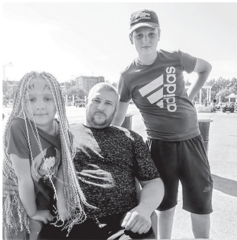
С любимыми детьми (сын и дочь)