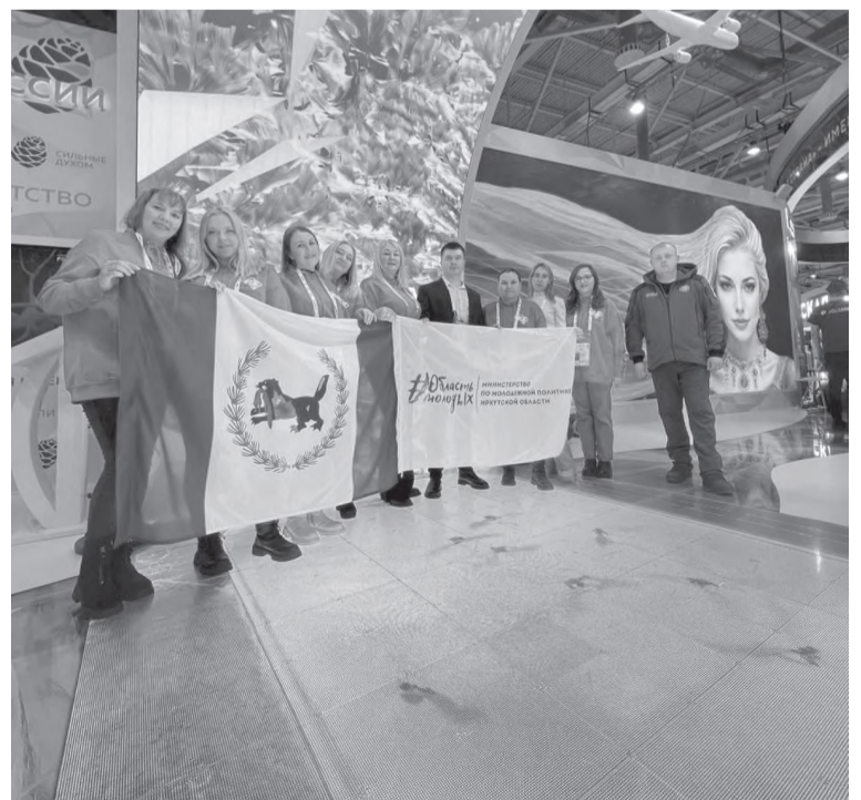
Делегация Иркутской области