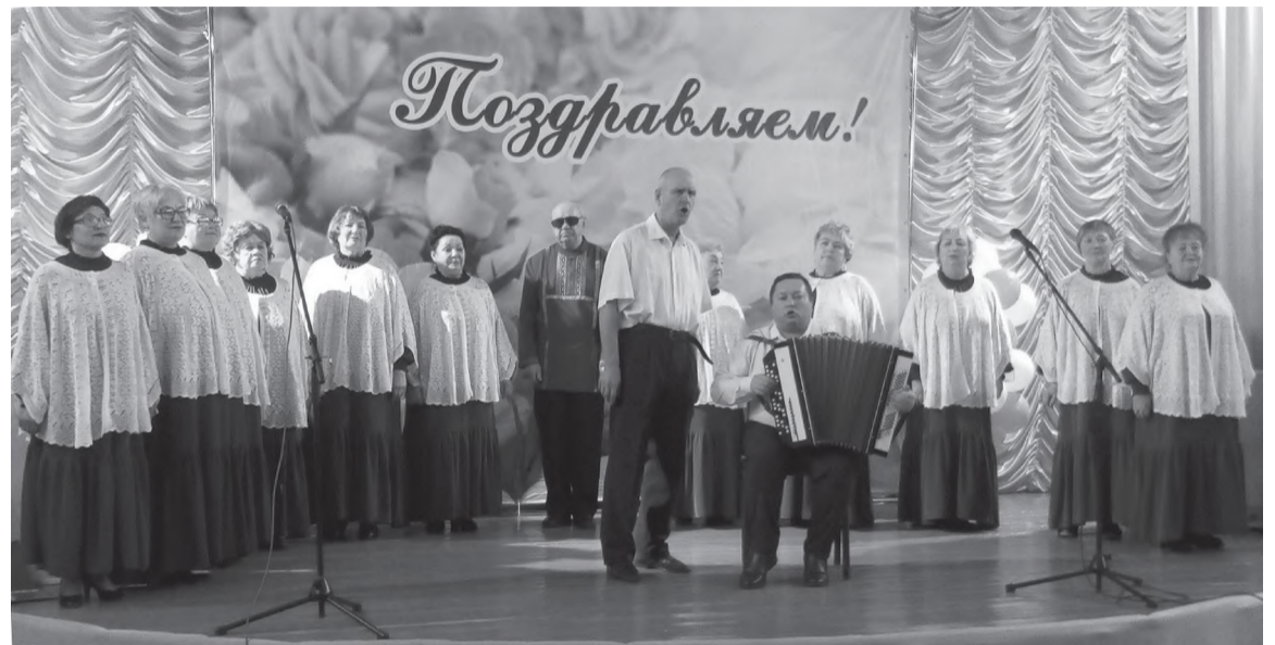
Выступает хор «Озарение»