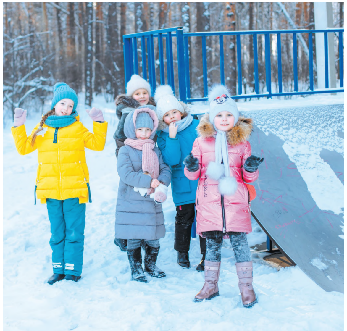
Детвора рада снегу. В городском парке