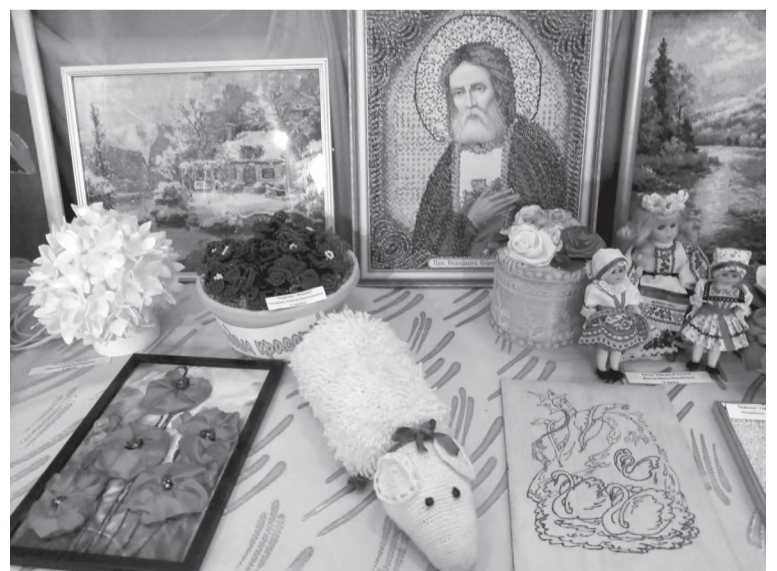
Работы незрячих умельцев