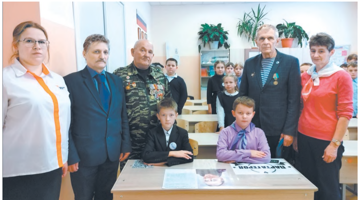
Педагоги, учащиеся и гости у парты Героя (школа № 8)

лось торжественное открытие парты Героя. Это важное событие для учащихся, педагогов и родителей, которое навсегда останется в их памяти.