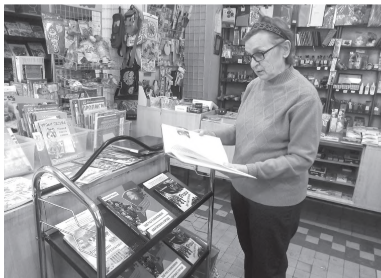
Книги очень заинтересовали...