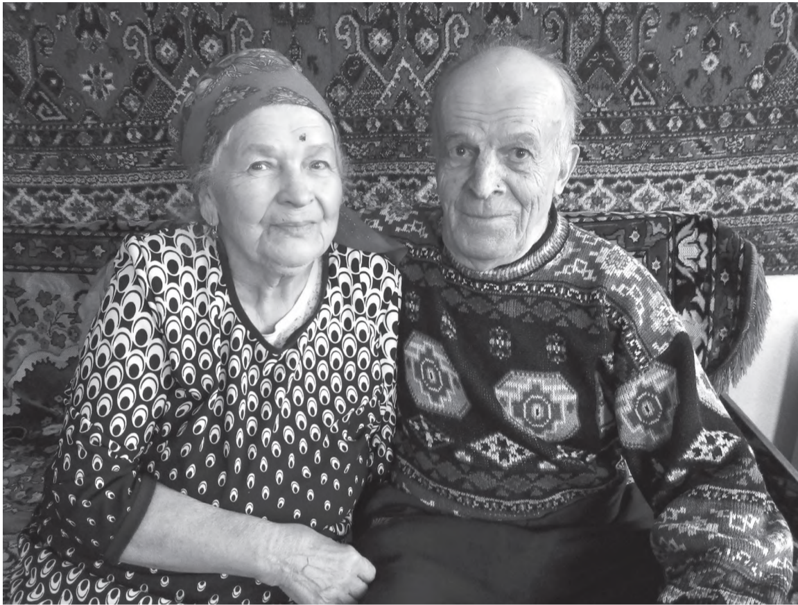
67 лет вместе!

67 лет вместе. Такой долгосрочный брачный союз именуется каменной свадьбой. Отношения у супругов, проживших столько лет вместе, становятся крепкими и нерушимыми, словно камень. Им не страшны ветры непонимания и дожди обид.