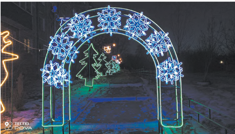
Оригинальное украшение вдоль дома по улице Некрасова, 1