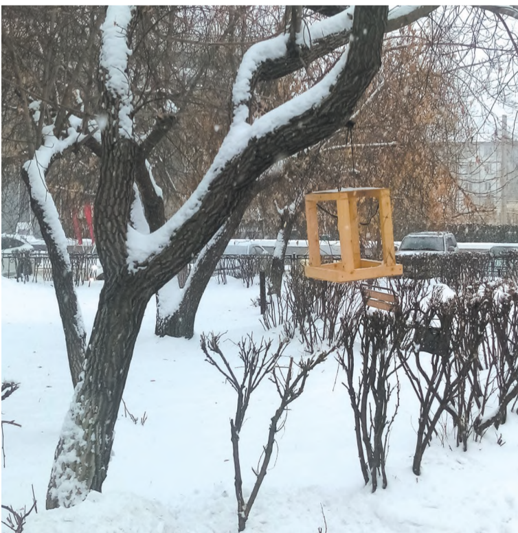
Готова кормушка для пернатых...