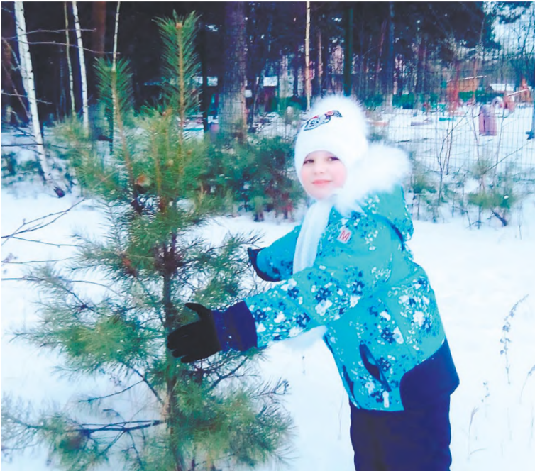
Маленькой ёлочке холодно зимой