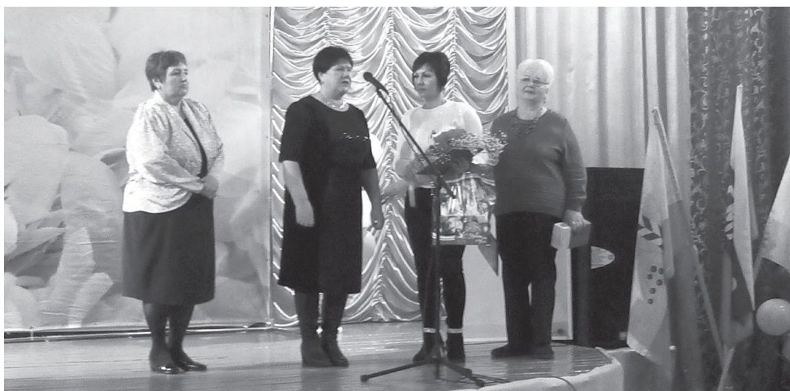
Моменты поздравлений в честь юбилея