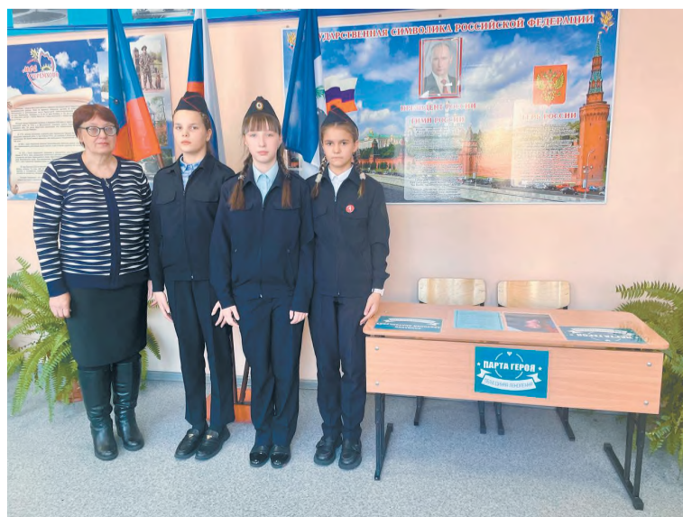
Мы гордимся своим героем (школа № 15)