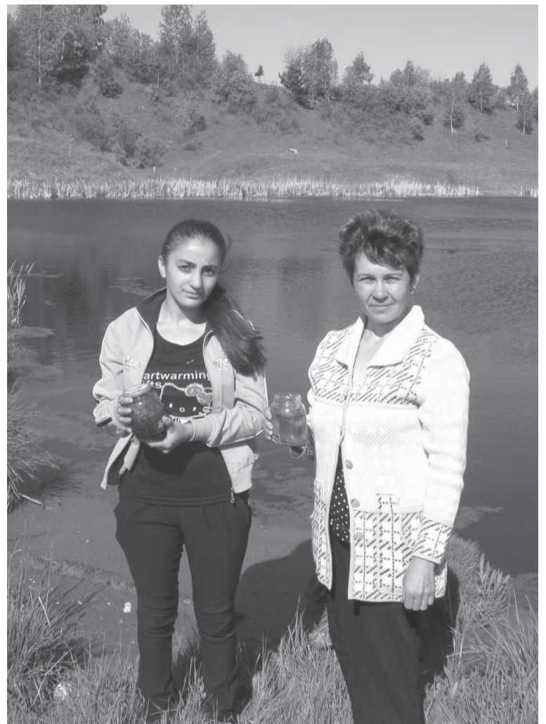
Забор воды - исследуем Черемшанку