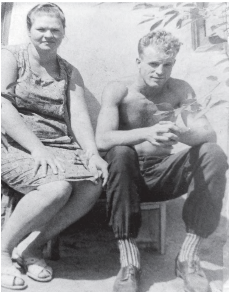
Как молоды мы были