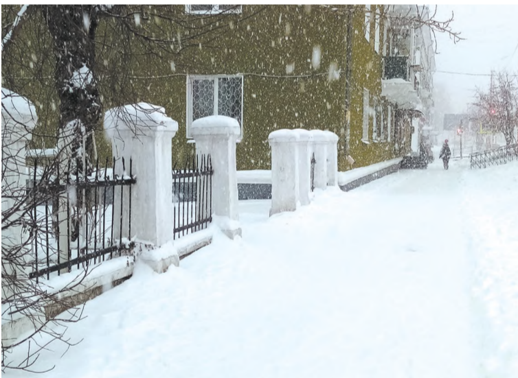
Улица Ленина в ненастный снежный день