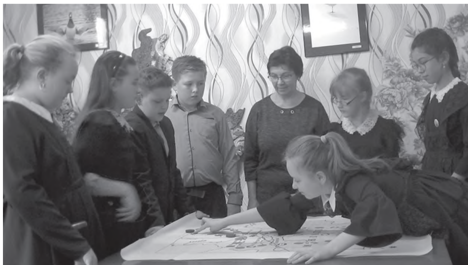
Апробация настольной игры