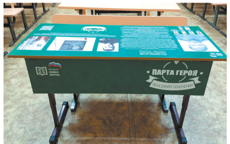
Парта Героя в школе № 16