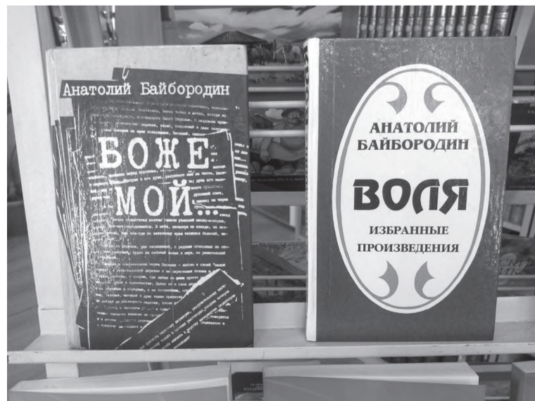
Эти книги есть в нашей библиотеке