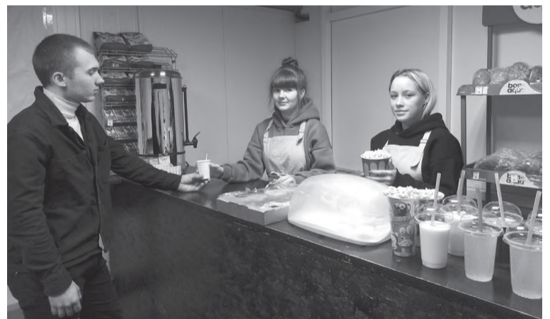
Для вас работает буфет!