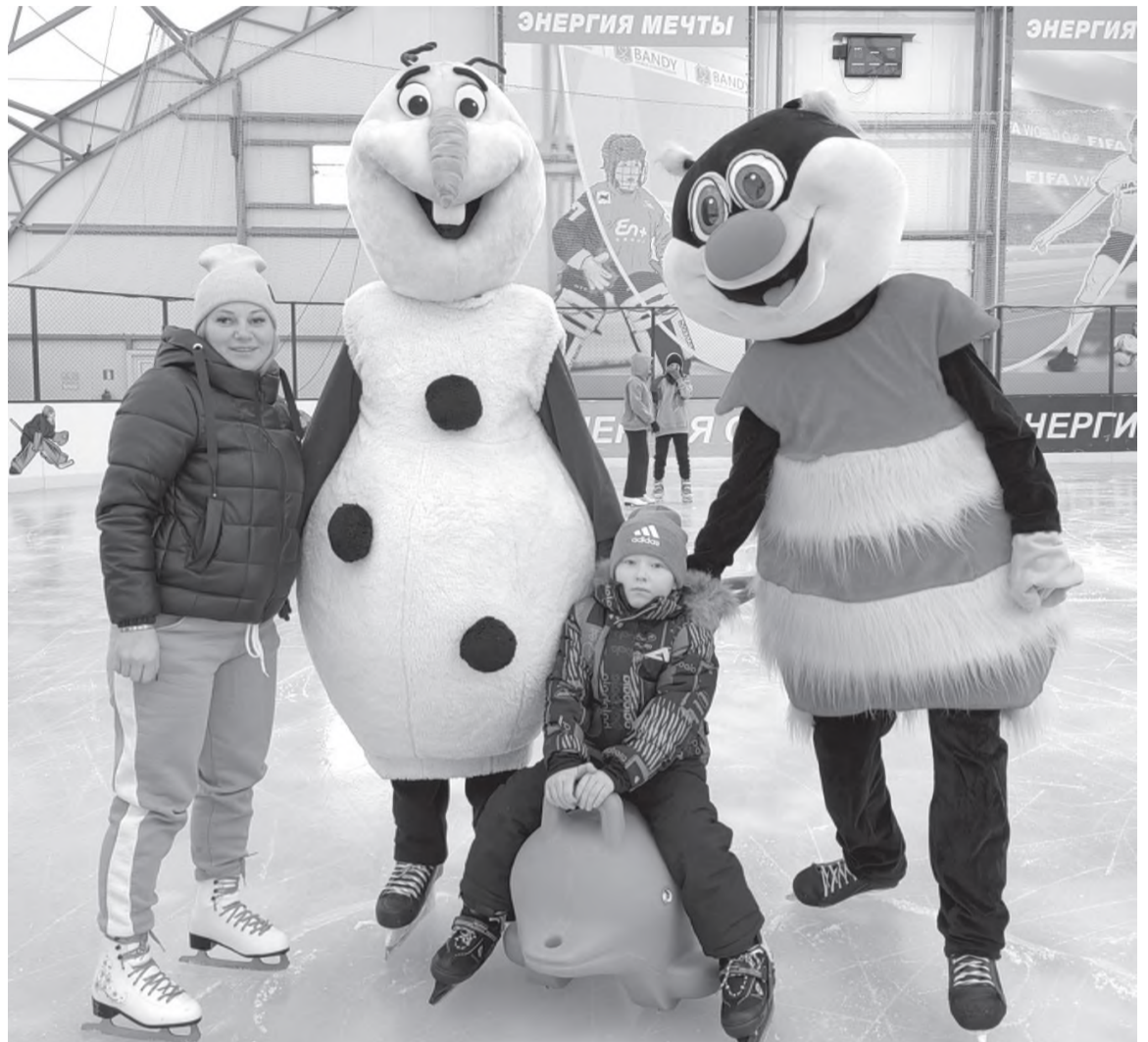
Сэлфи с ростовыми куклами