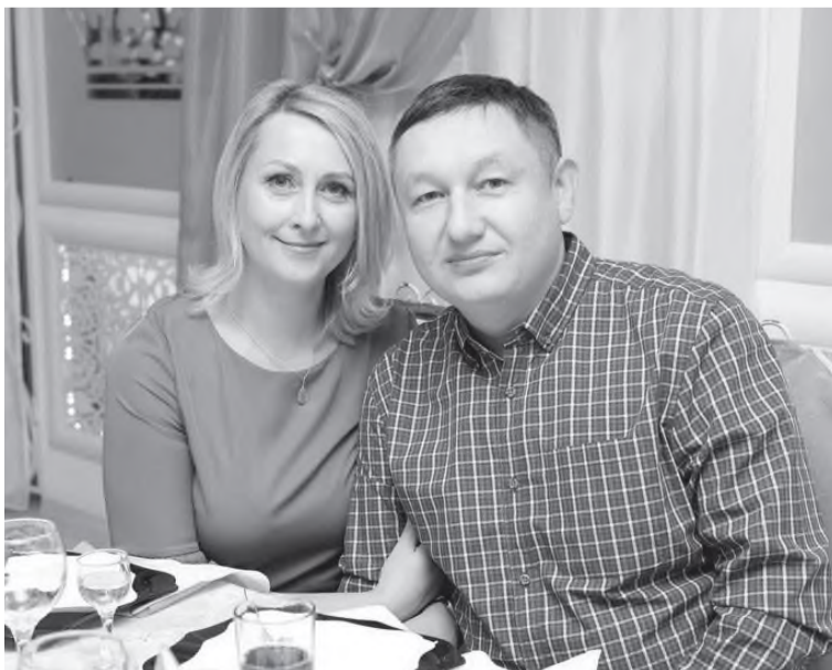
С любимым супругом