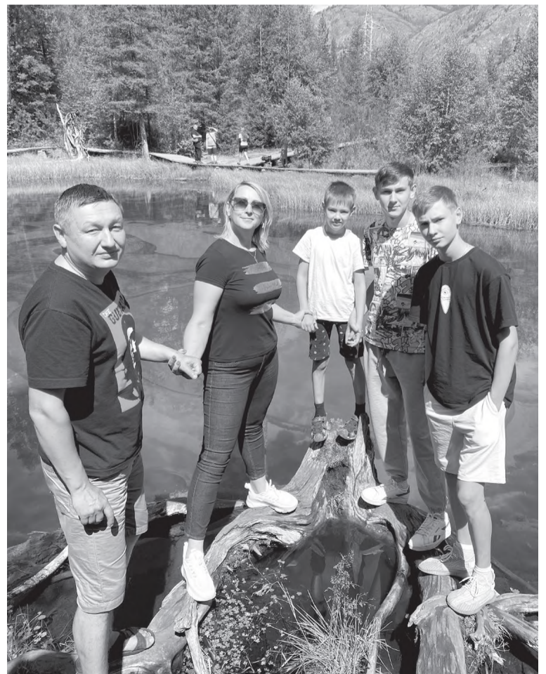
Всей семьёй на отдыхе