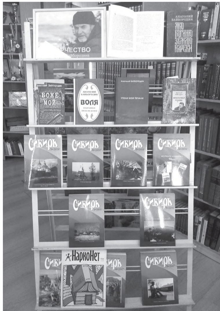
Выставка книг иркутского писателя