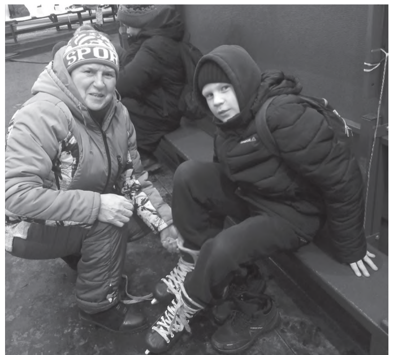
Сейчас коньки надену и покачусь...