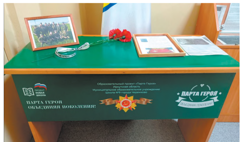
Героический уголок в школе № 9