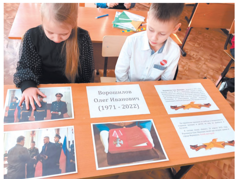
За партой героя ученики школы № 32