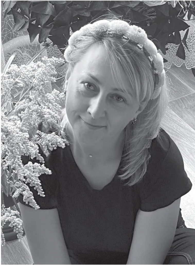
Счастливая и красивая

«Мама» - главное слово для каждого из нас, как и человек, который за ним стоит. От матери мы полностью зависим будучи детьми, и к ней за советами приходим, когда вырастаем, понимая, что мама во всём была права. Связь между матерью и ребёнком нерушима, как сила любви, которая их объединяет.