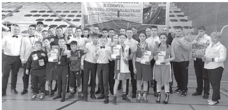
Черемховская школа бокса