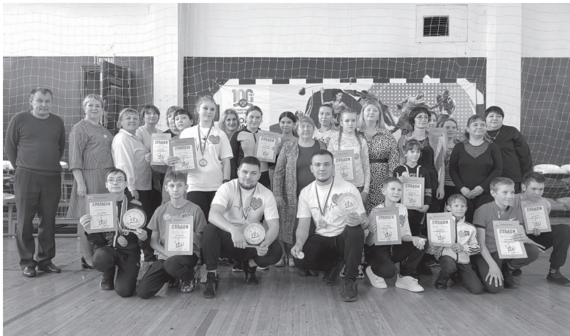
Участники спартакиады «Мы вместе!»

В Черемхово на стадионе «Шахтер» им. В.С. Белика 27 октября состоялась спартакиада «Мы вместе» среди семей, воспитывающих детей-инвалидов, организованная отделом по физической культуре и спорту администрации города Черемхово. В соревнованиях приняли участие 13 семей с детьми от 6 лет и опекаемые дети из Центра помощи детям г. Черемхово.