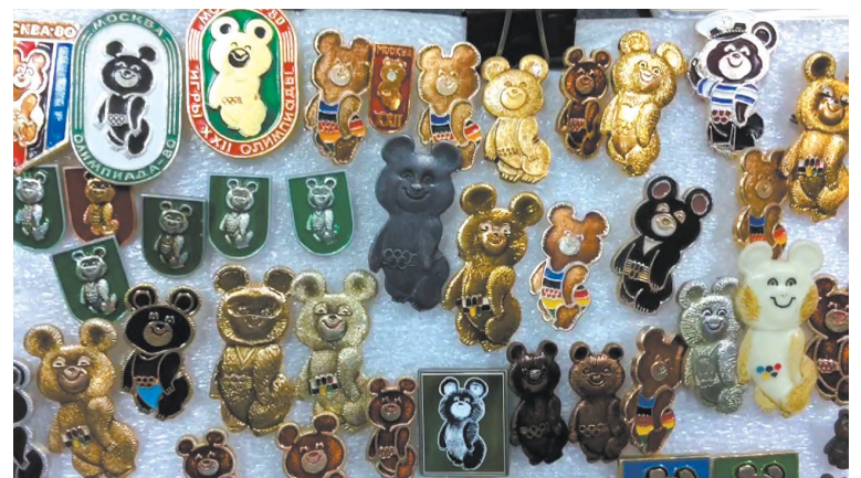
Значки коллекционировали многие...