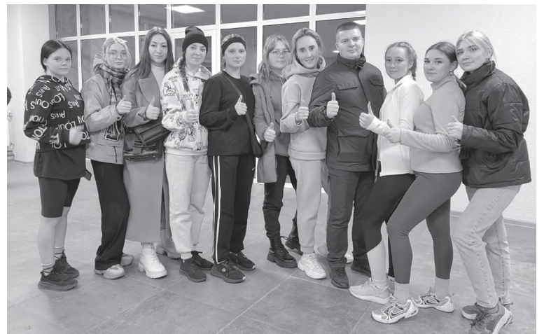
Волонтеры и участники забега из педагогического колледжа

В пятницу вечером под яркой лунной черемховцы закрыли беговой сезон часовым вечерним забегом «Быть первым!». Впервые на обновленном стадионе «Шахтер» им. В.С. Белика дан старт такому необычному легкоатлетическому забегу. Старт получился добрым, домашним, с подкормкой для спортсменов и с горячим чаем после финиша. Под вечерним светом софитов 17 участникам предстояло проверить свою выносливость!