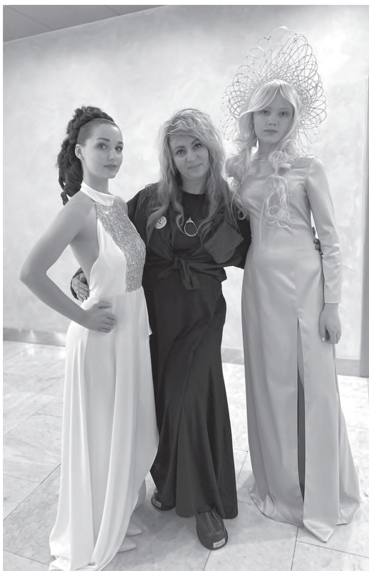
Мастер со своими моделями