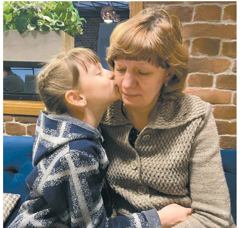
Мамочка, не огорчайся, я тебя так люблю!