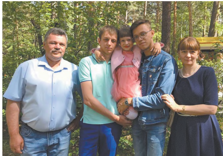
Моя семья — моё богатство!