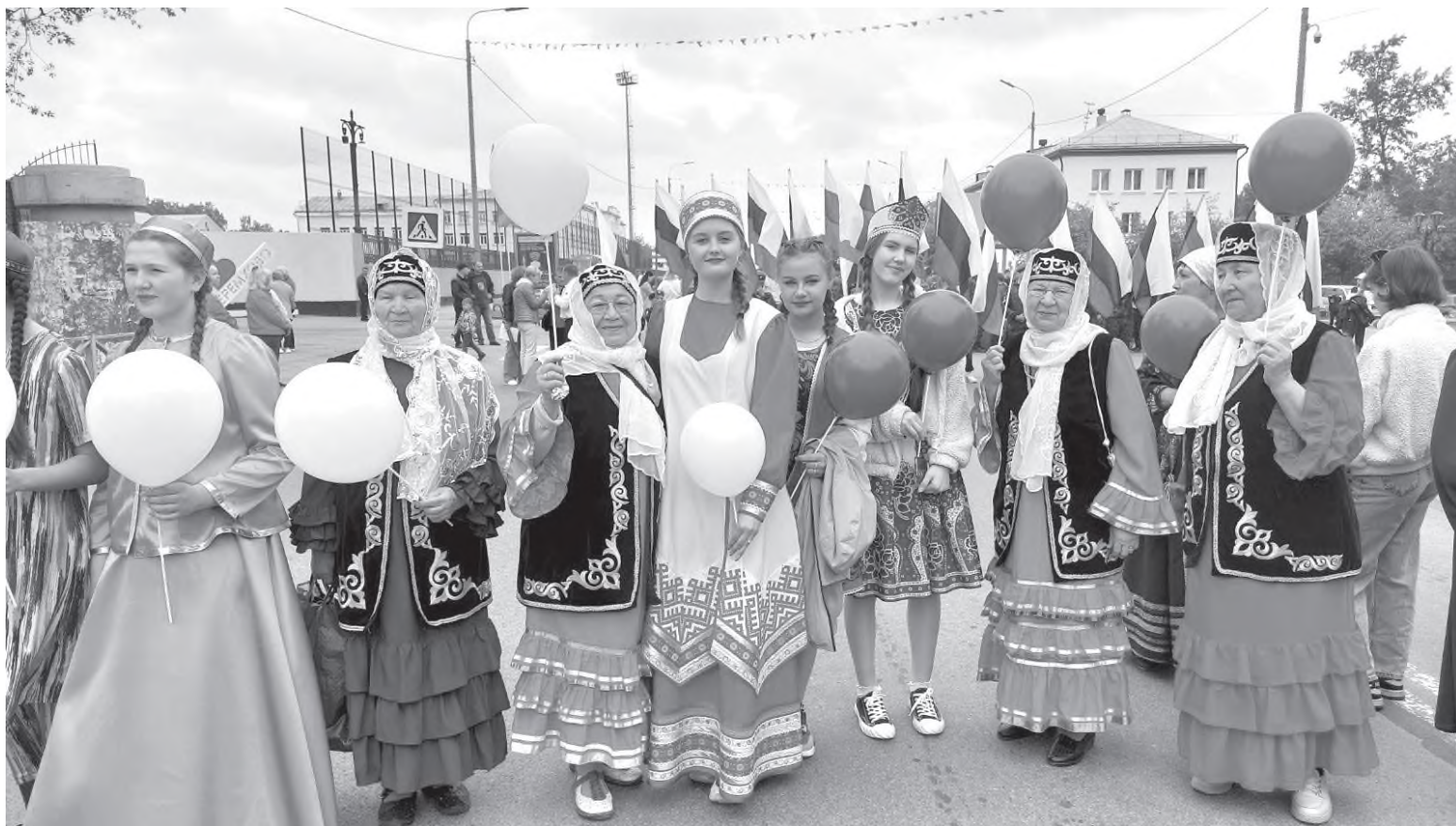
Наш город богат национальностями

Россия встречала XVII век в тяжелое для нее время. Война с Речью Посполитой шла неудачно, стихийные бедствия и неурожай влекли за собой голод и обнищание крестьян, кризис безвластия затронул все слои российского общества. Не зря этот период в нашей истории получил название «Смутное время». Воспользовавшись ситуацией, польские интервенты смогли нанести тяжелый удар нашей стране. Больше десяти лет не утихали войны и конфликты внутри страны при участии иностранных захватчиков и при постоянных татарских набегах на русские земли. Только собравшееся в Нижнем Новгороде знаменитое Второе народное ополчение Кузьмы Минина и князя Дмитрия Пожарского смогло положить конец польской интервенции. Это был действительно поворотный момент в отечественной истории. Ополчение носило всенародный характер, в его состав входили представители всех сословий, существовавших тогда в России. В честь победы и освобождения Москвы был заложен храм Казанской иконы Божией Матери.