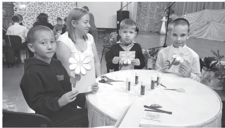
Вот такие ромашки у нас получились...