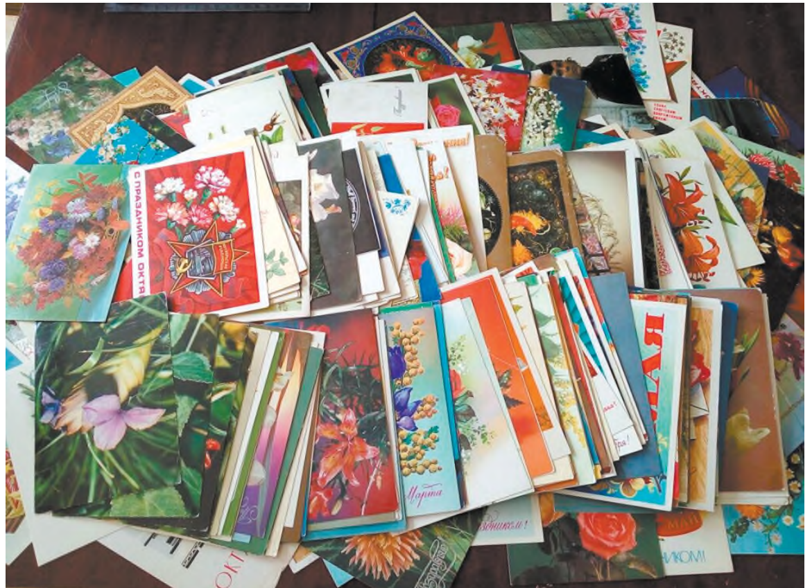
Коллекция открыток советского периода М.В. Суховеевой

Современным детям неинтересно коллекционировать, потому что всё будет сводиться к размерам родительского кошелька. Например, в торговых точках многие дети предлагают родителям положить в продуктовую корзину как можно больше товаров, чтобы набралась определённая сумма, позволяющая поучаствовать в той или иной акции, где дадут какую-то безделушку (игрушку, браслетик) Вот дети и хотят якобы накопить их побольше. Коллекционированием это, конечно же, не назовёшь. Современные дети живут в мире, в котором всё быстро меняется, и они не привыкли к долгосрочной перспективе. В коллекционировании такой подход не допустим. Тут и есть весь смысл в том, чтобы продлить удовольствие, всё глубже и глубже погружаясь в