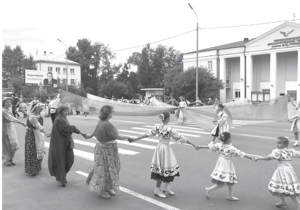
Праздник дружбы народов в Черемхово