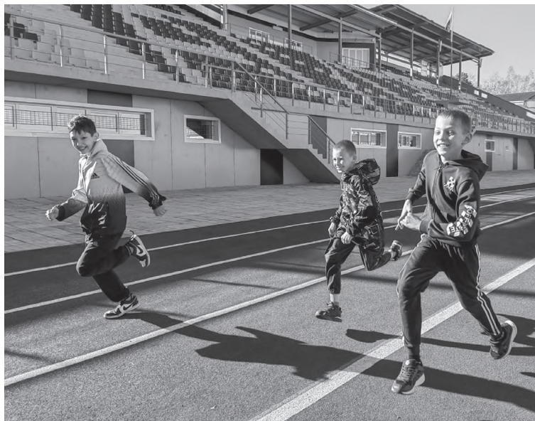
Участники сдают норматив «бег 60 метров»