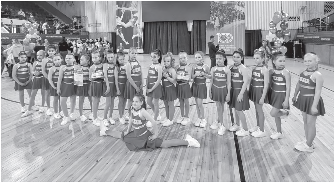
Наши на фестивале «Фитнес-стиль» в Иркутске

В последнюю субботу октября (нынче это 28 число) российские спортсмены отмечают День гимнастики, учрежденный в 1999 году.