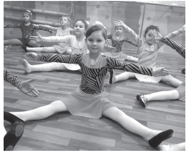
Совсем скоро сядем на шпагат

В спортивной школе «Старт» г. Черемхово направление фитнес-аэробика развито на достаточно высоком уровне. Фитнес-аэробика — вид спорта, зародившийся в фитнесе и впитавший в себя самые популярные