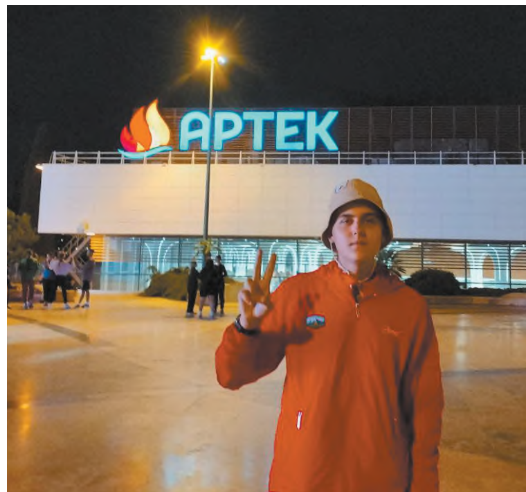
Я в «Артеке»