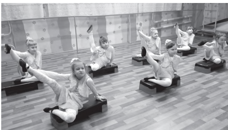
Аэробика на ступах