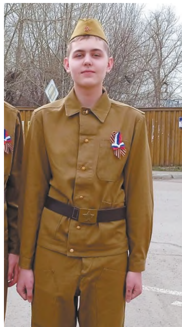
Участник волонтерского отряда «Исток»

На территории «Артека» - девять лагерей, я был в лагере «Лесной», который был открыт в 1963 году. Принимает 400 ребят в смену, расположен в самом центре «Артека». Рядом с этим лагерем находятся концертно-эстрадный комплекс «Артек-Арена», который каждую смену собирает весь «Артек». Я попал в седьмой отряд с туристическим профилем. Нас обучали спортивному туризму, теперь и я стал настоящим туристом, получив необходимые знания. Были и творческие конкурсы, напри-