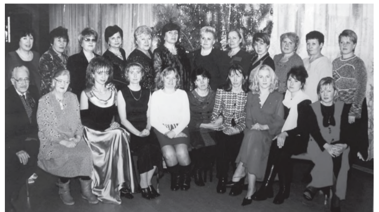
В День печати. 2003 год

Светлана НАСЫРОВА