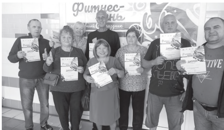
Участники Фитнес-дня из Всероссийского общества слепых

В Иркутской области проходил фитнес-день для людей с инвалидностью. И наш город не стал исключением. В плавательном бассейне «70 лет Великой Победы» прошла тренировка по акваэробике для людей с ограниченными возможностями здоровья, в которой принимали участие Всероссийское общество инвалидов, Всероссийское общество глухих и Всероссий-