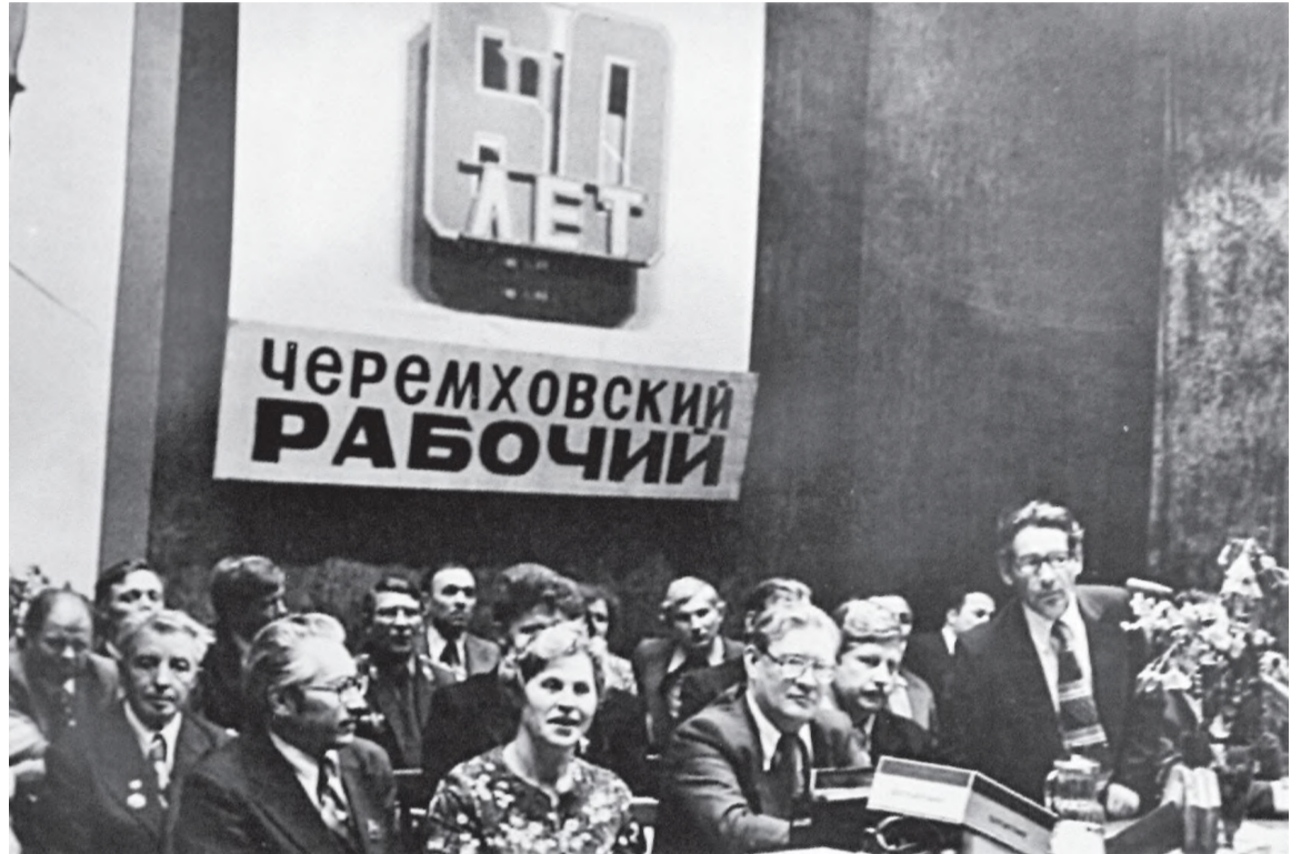
Торжественное собрание в честь 60-летия газеты

кто плодотворно и добросовестно многие годы трудился в редакции газеты «Черемховский рабочий», о тех, кто сегодня находится на заслуженном отдыхе и по-прежнему читает любимое издание.