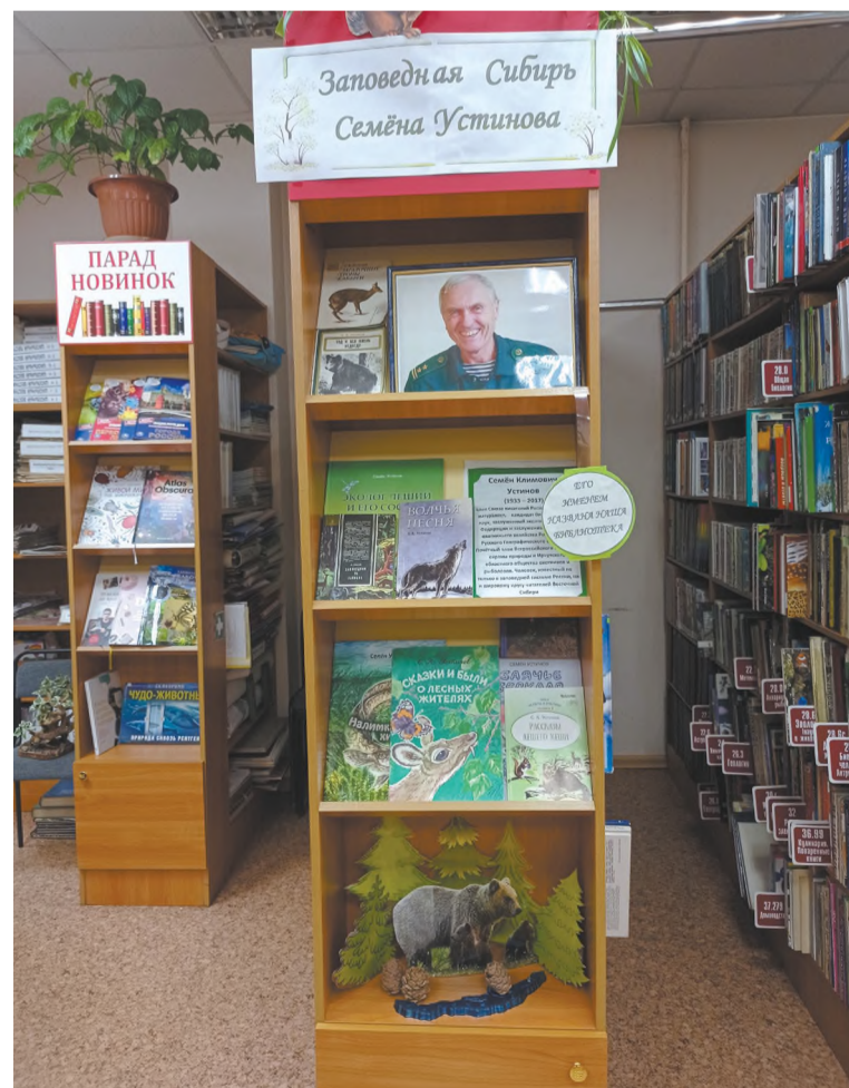
Постоянная экспозиция, посвященная С.К. Устинову