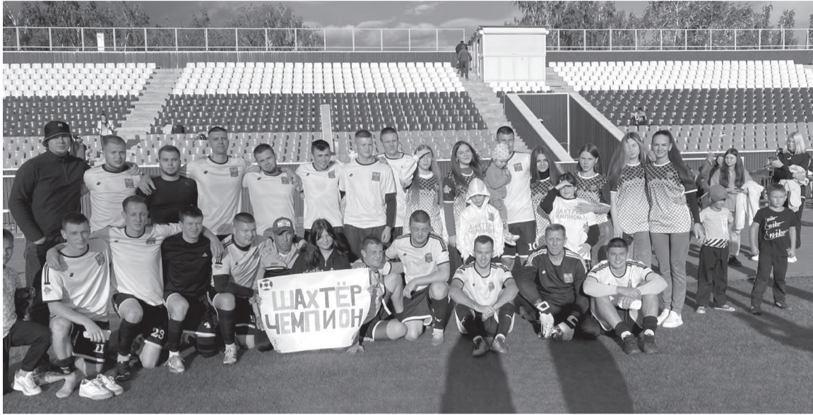
Команда «Шахтер» с болельщиками

Поздравляем мужскую команду «Шахтер» с бронзовыми медалями Первенства Иркутской области по футболу среди любительских команд сезон 2023.