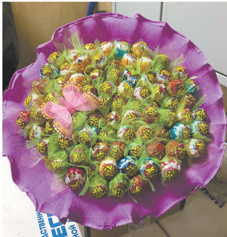
Красота, да и только! Чайный букет