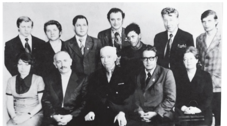
Старые добрые времена. Коллектив газеты