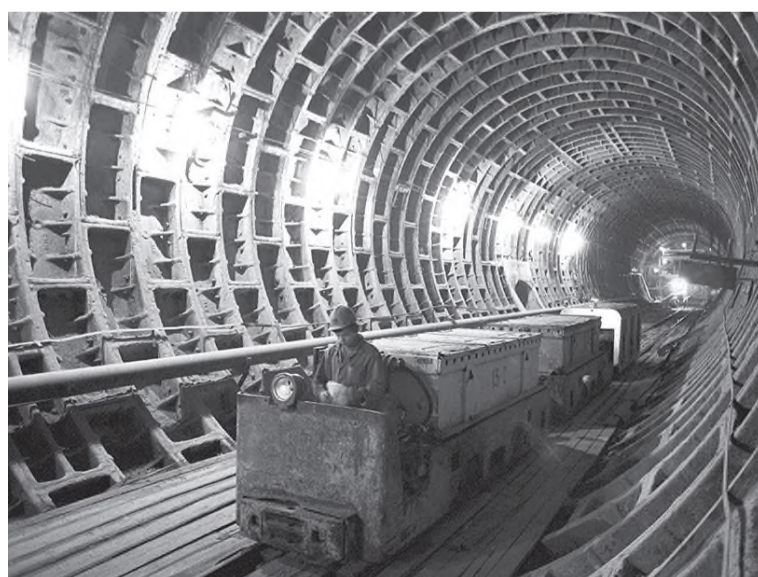
Тот самый Северо-Муйский тоннель