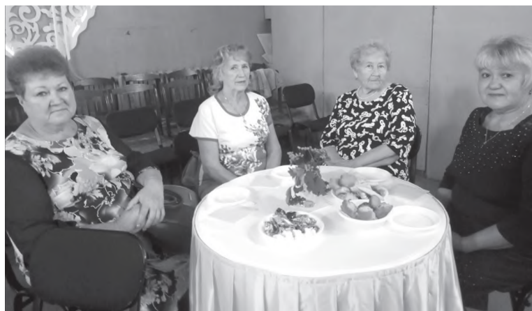
Встреча за чашечкой чая