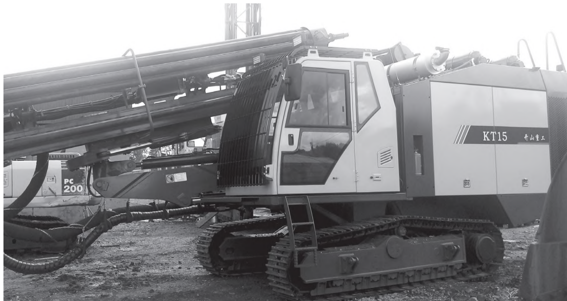
Новый буровой станок на участке №1