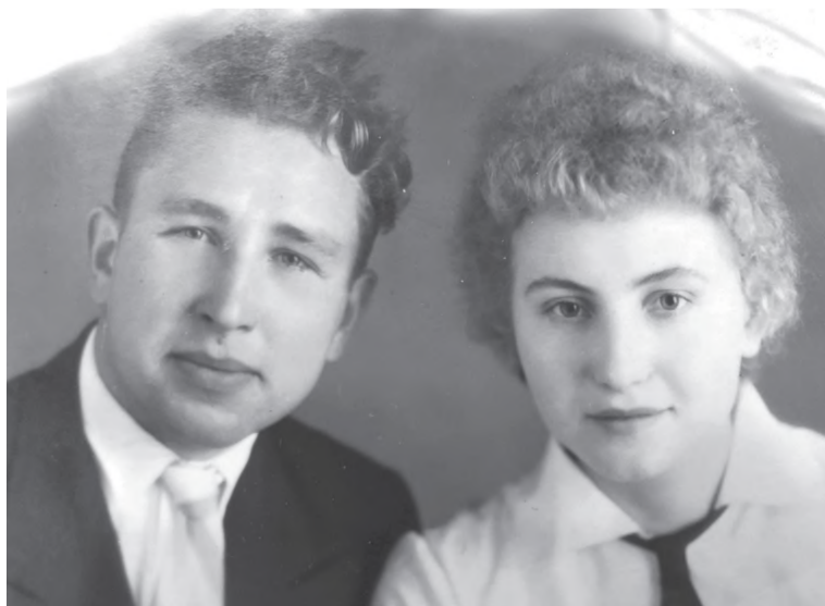
Как молоды мы были