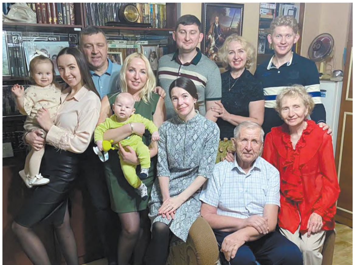
В окружении детей и внуков