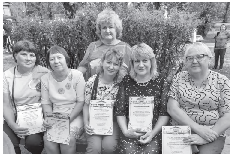
Педагоги, жители посёлка Гришево