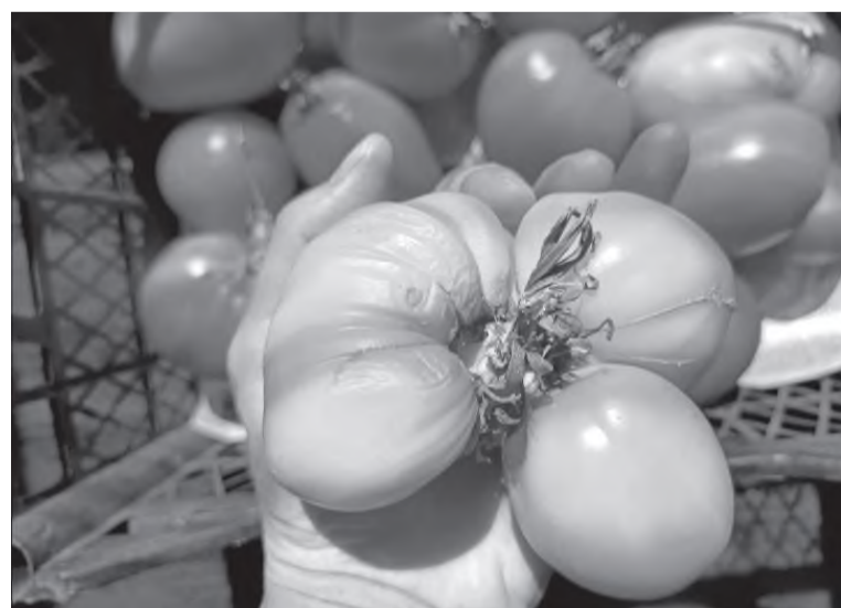
Ничего, что корявенький, зато очень вкусный!