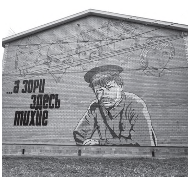
Узнаёте? Кадр из фильма «А зори здесь тихие»