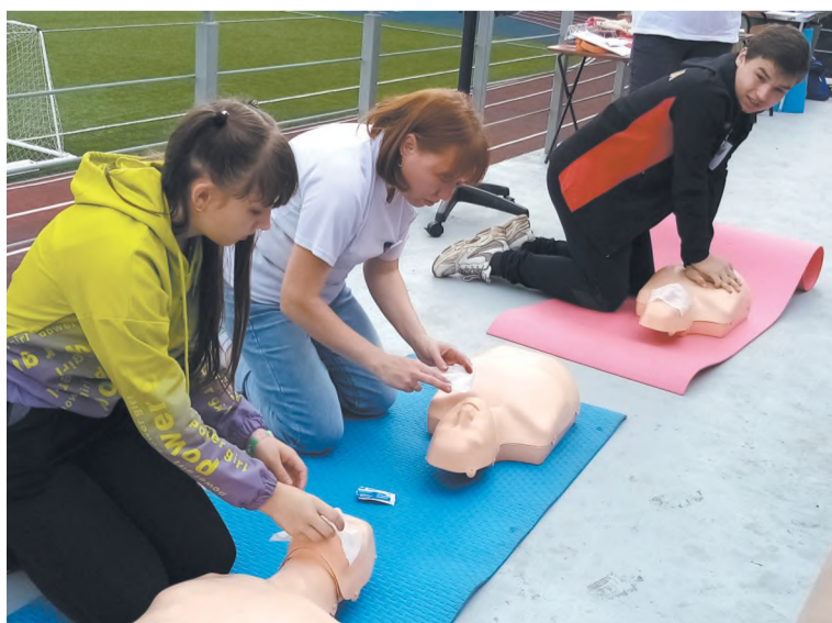
Манекены в помощь