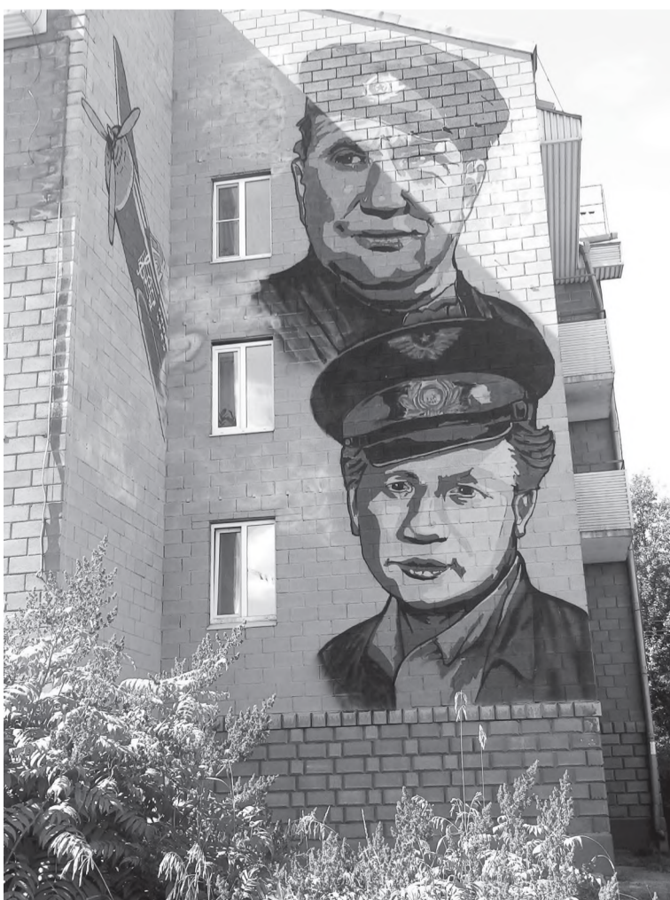
Дом по ул. Некрасова украшает мурал «В бой идут одни старики»