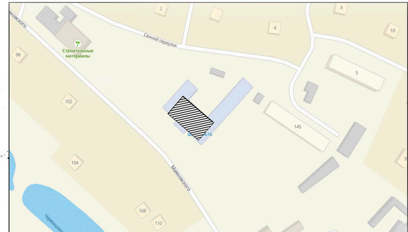
Схема границ территории муниципального образования «город Черемхово», на которой планируется реализовать инициативный проект «Коворкинг-центр (мобильный актовый зал)»

Приложение к постановлению администрации города Черемхово от 2 августа 2023 года № 344