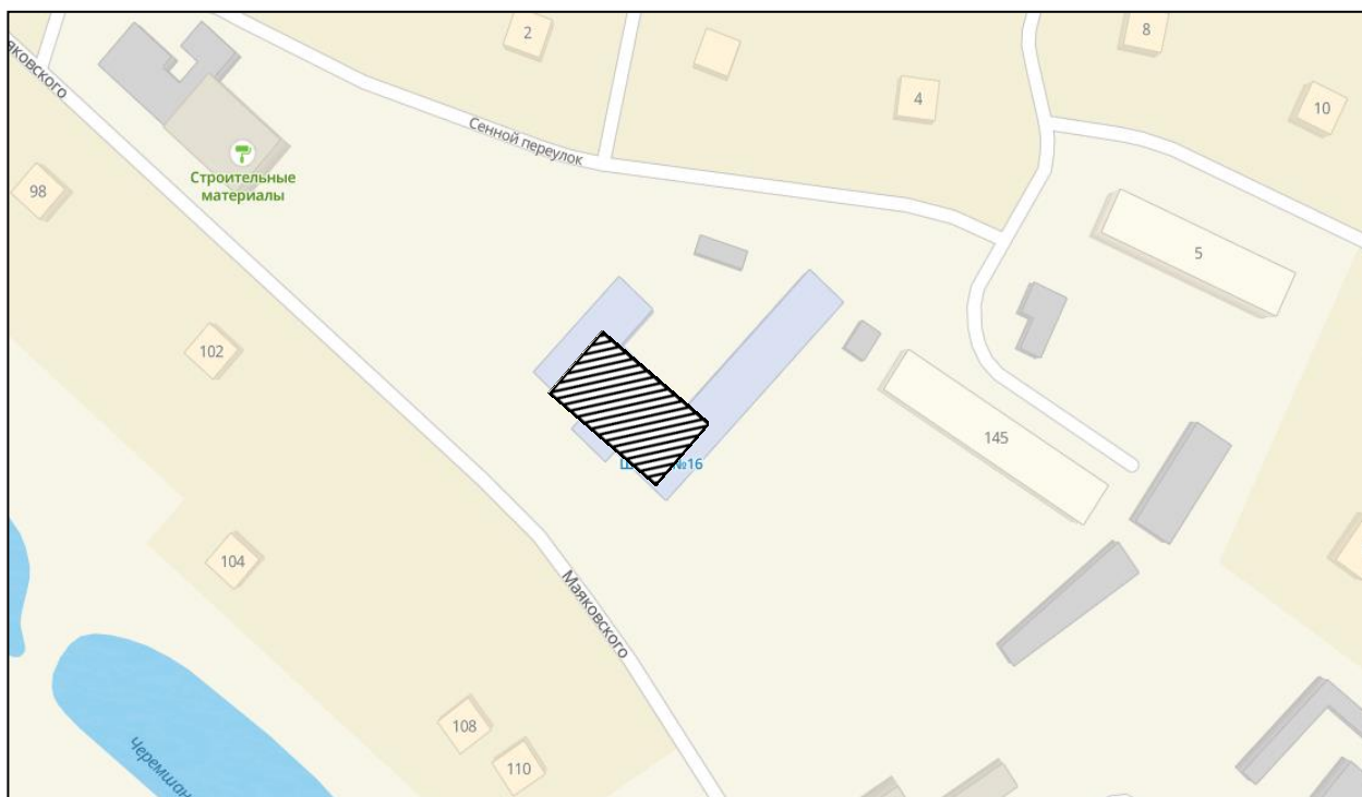
Схема границ территории муниципального образования «город Черемхово», на которой планируется реализовать инициативный проект «Коворкинг-центр (мобильный актовый зал)»