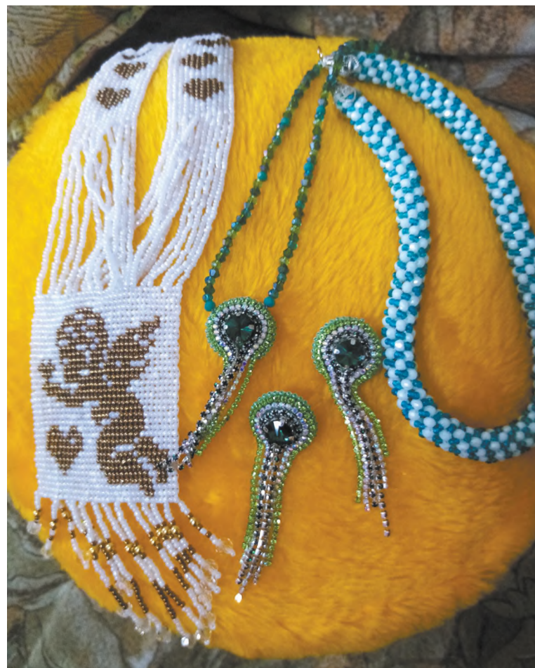
Украшения в ассортименте...

хранятся у меня дома, некоторые дарю своим родственникам, друзьям.