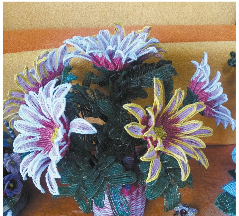
Красота да и только!