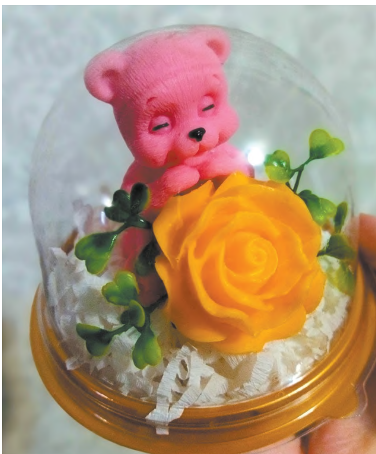
Забавные мыльные фигурки очень нравятся детям

Сейчас очень многие отдают предпочтение необычным подаркам и букетам. Например, очень приятно получить упакованный сюрприз, в котором необычная фигурка из мыла или букетик из этого же материала - яркий, красивый, с нежным ароматом. Смотрится очень оригинально.