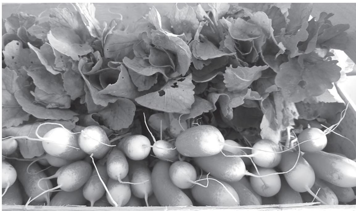
Первый урожай редиса

На грядках нельзя лушить семечки, и колоть орехи – от вредителей будет не избавиться.