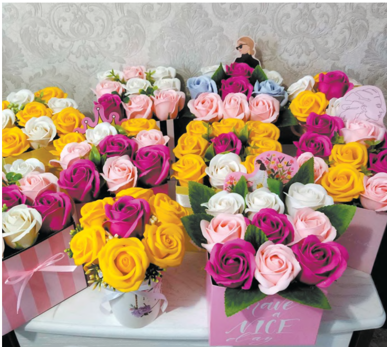
Какая красота! И это всё из мыла...