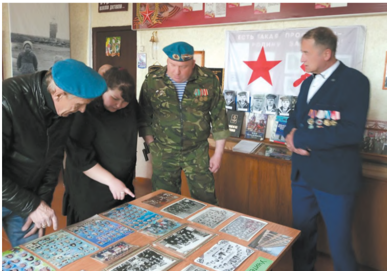
В школьном музее