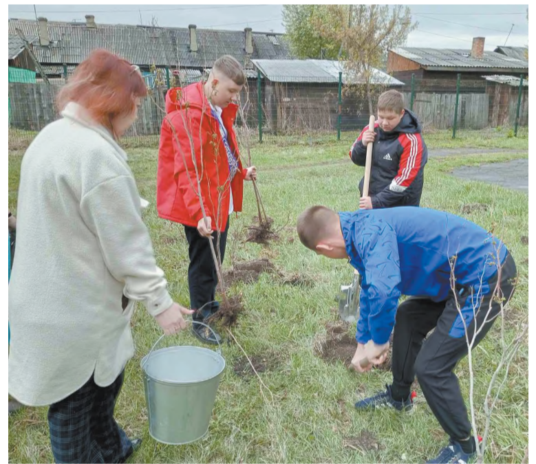
За работой ученики