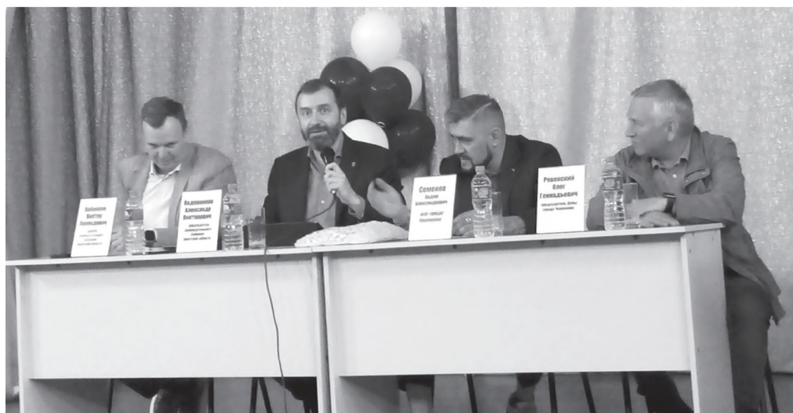
Рабочая встреча в школе № 1

После школы № 1 делегация направилась на стройплощадку. По объекту капитального строительства «Группа многоквартирных, многоэтажных жилых домов по адресу ул. Орджоникидзе, 7/А», в рамках реализации регионального проекта «Обеспечение устойчивого сокращения непригодного для проживания жилищного фонда» предусмотрено строительство пяти 9-этажных блок-секций на 225 квартир, общей