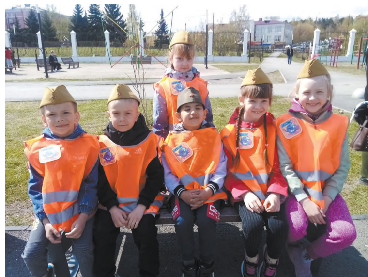
Дошколята команды «Динамит»