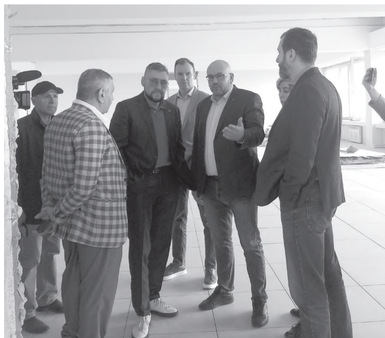
На объекте – Дворец культуры «Горняк»