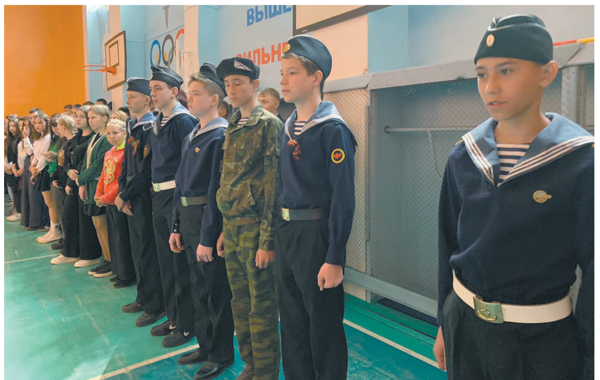
Юнги школы № 30