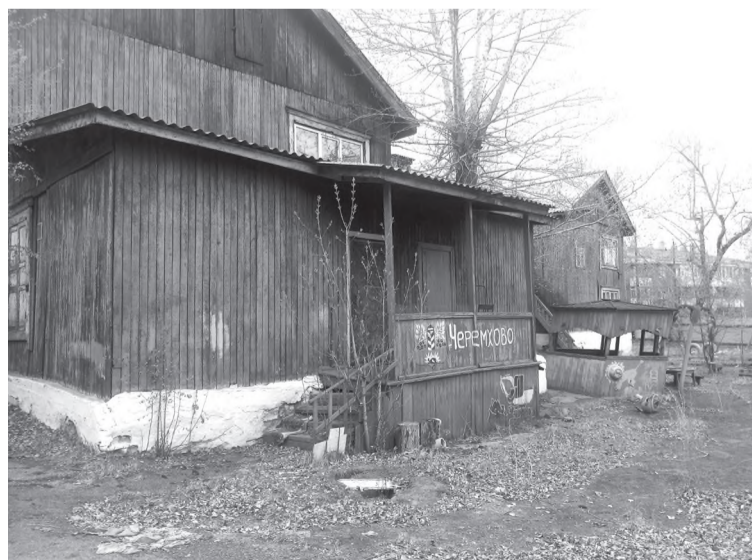
На месте старого детского сада № 10 – планируется новый!