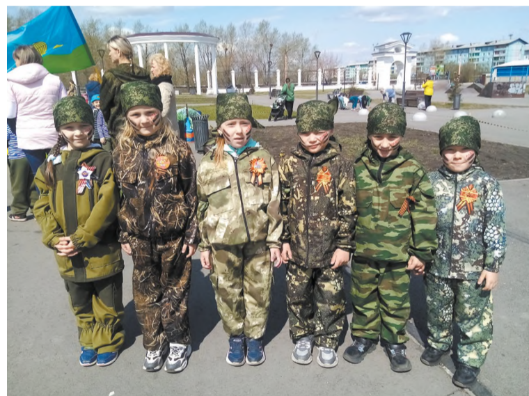
Команда «Пламя» (детский сад № 12)