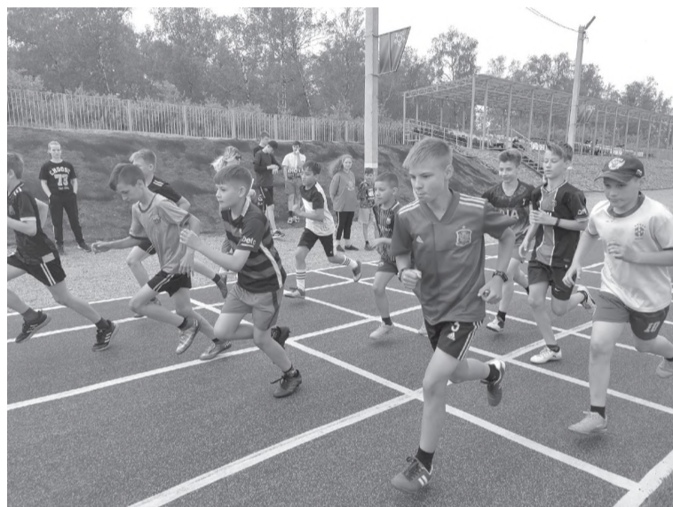
Участники ГТО сдают бег

Бег, по мнению ученых, является тем эликсиром, который дарует человеку продолжитель-