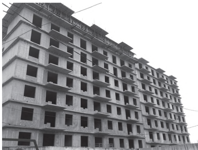
Возводится новая девятиэтажка