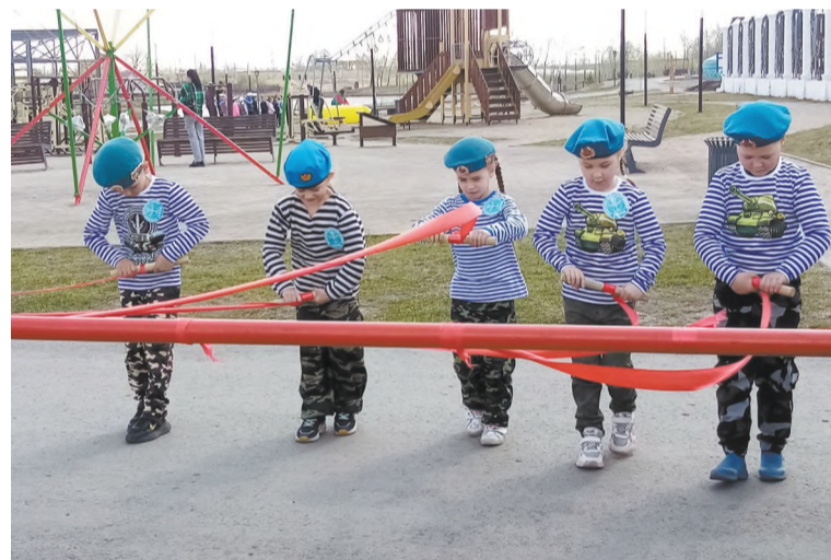
Команда ВДВ на очередном этапе