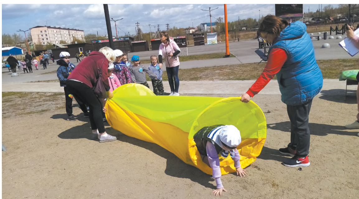
На этапе «Тоннель»