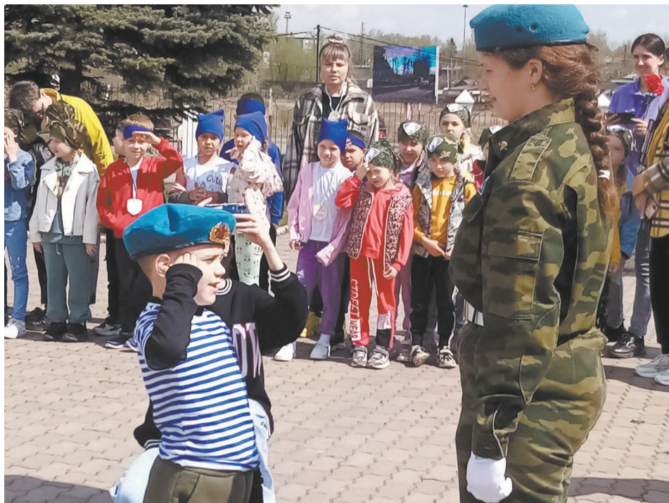
Командир сдаёт рапорт