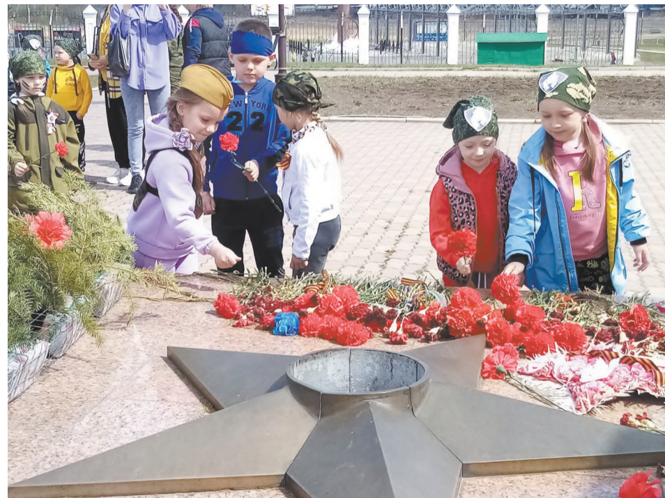
Возложение цветов к Вечному огню