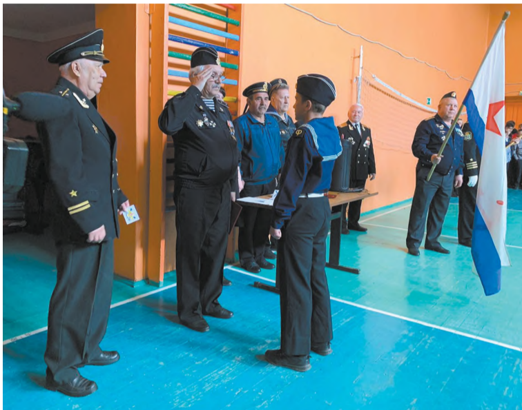
Момент принятия присяги