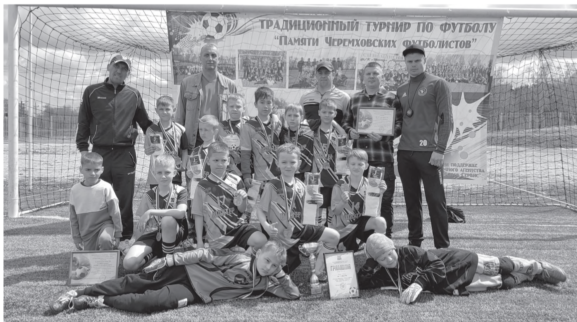
Призеры турнира черемховская команда «Сибскана»

Соревнование организовано отделом по физической культуре и спорту администрации города Черемхово, команды награжде-