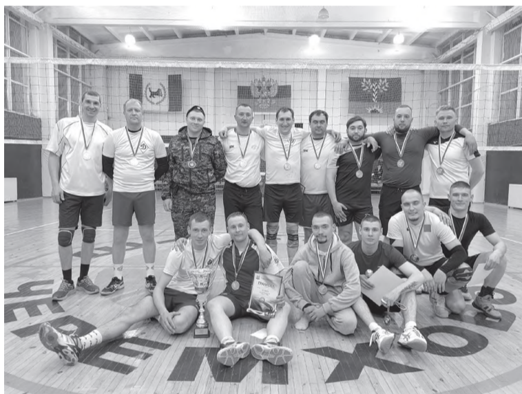
«Динамо» и «Черембасс»

Команда «Динамо» вновь стала чемпионом первенства города Черемхово по волейболу среди любительских команд. Турнир проходил три месяца, в котором играли команды «Динамо», «Черембасс», «ЧГБ № 1», «Олимп» (г. Свирск), «Черемховский район», ЧГТК, в том числе дебютанты «Лицей» и «Шахтёр 2008».