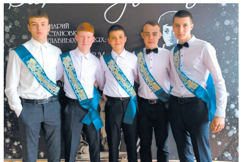
Позади девятый класс (школа № 5)