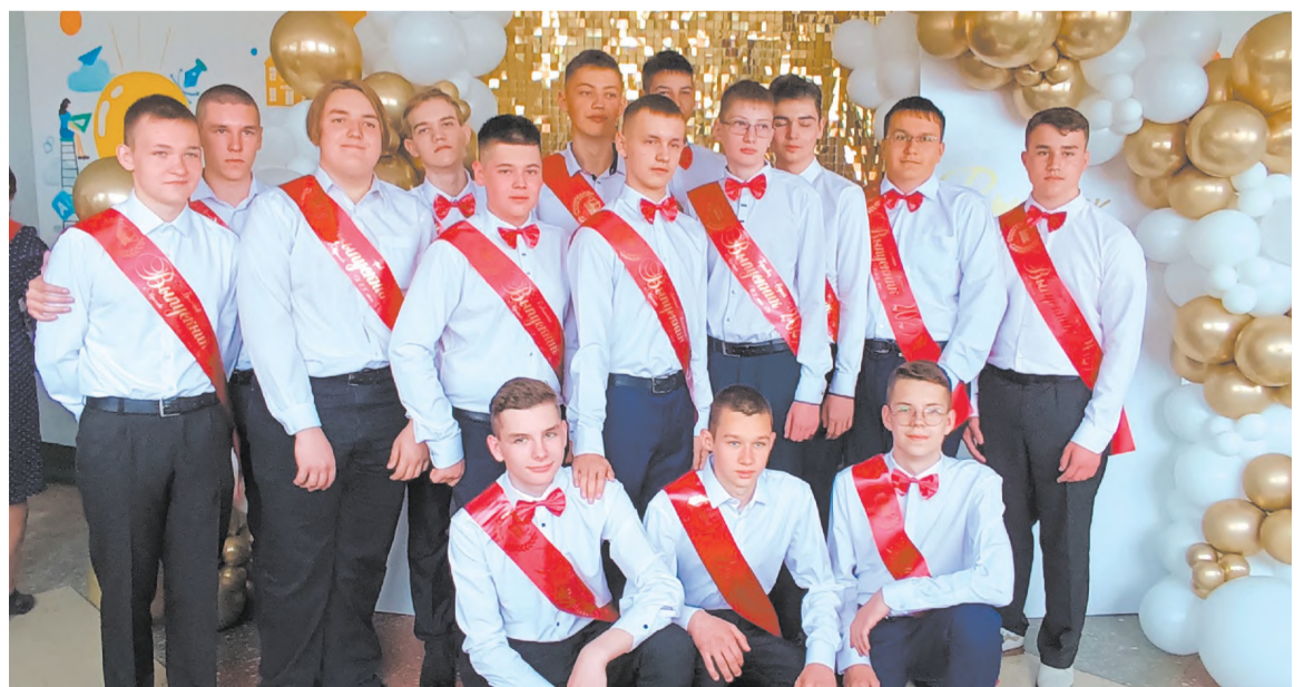
Выпускники 9 «В» класса школы № 1