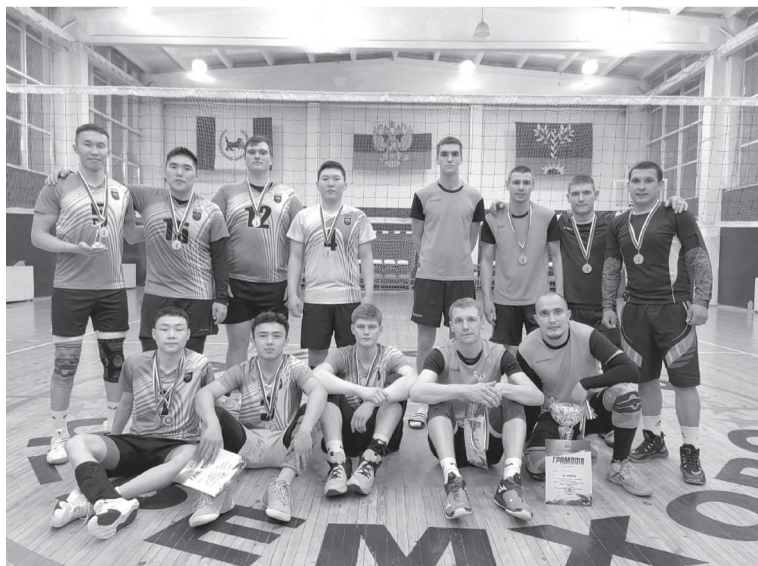
«БГУ» и «Шахтер»

Отдел по физической культуре и спорту города Черемхово