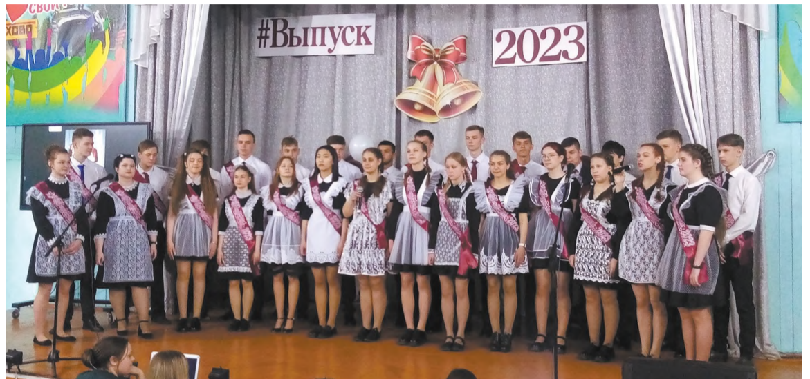
Последний звонок в школе № 1

Праздник последнего звонка - самый трогательный и один из любимых праздников выпускников, их родителей и учителей, ведь в этот день прощаются с прекрасной школьной порой. Белые банты, грусть, слёзы, расставание, добрые напутствия и трогательные поздравления, слова благодарности учителям и родителям.