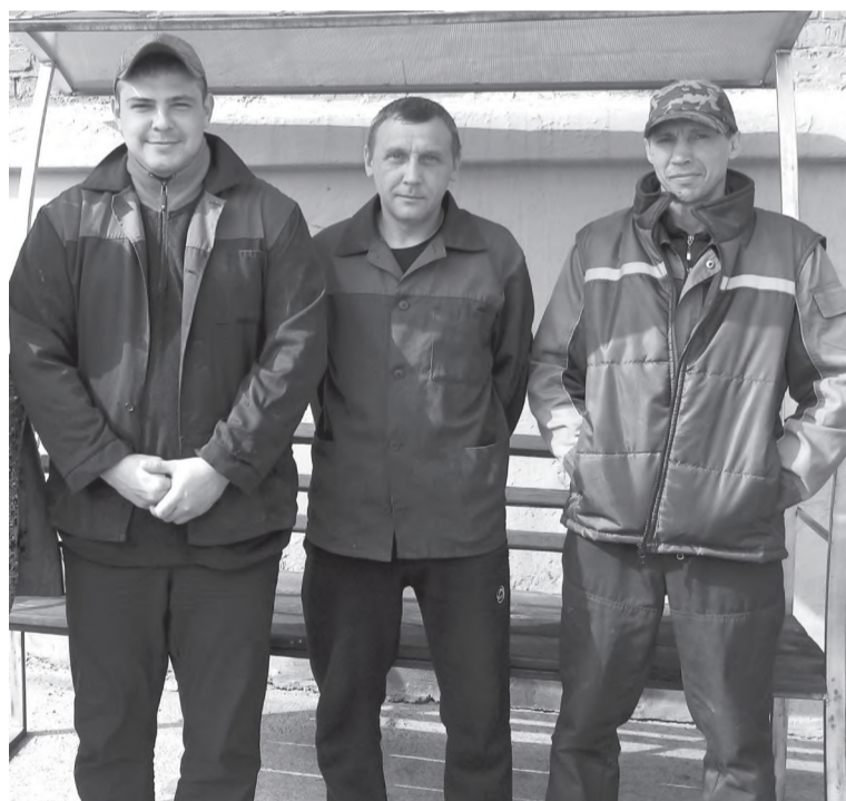
Команда профессионалов всегда рядом...

- С работой свободного времени выпадает не так уж много, но я стараюсь всегда проводить его с пользой. Люблю заниматься огородными делами. Очень люблю летнюю пору и пору, когда расцветают прекрасные пионы - мои любимые цветы. Ко всему прочему, люблю читать, но жаль, времени на это не всегда хватает. Ещё одно из моих увлечений - езда на автомобиле.