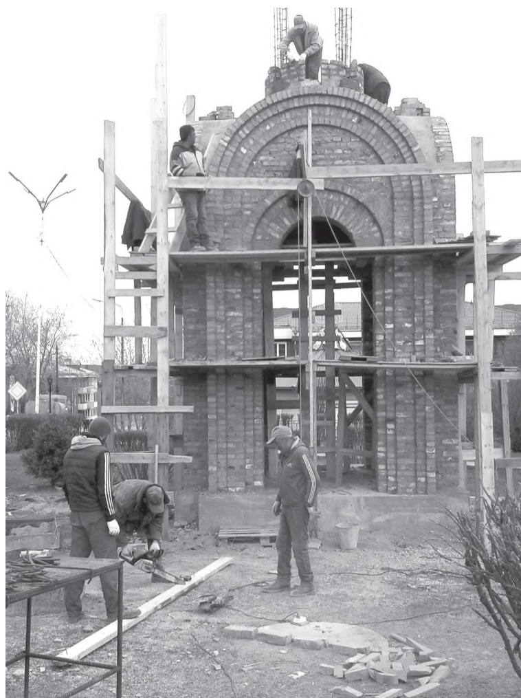
Строительство в самом разгаре