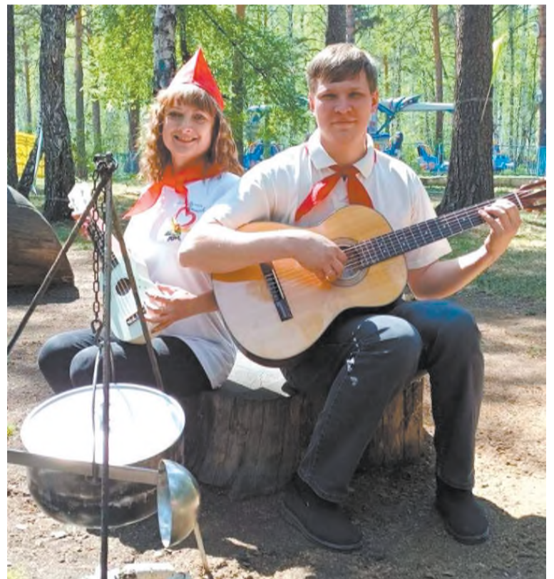
Песни напеваем - никогда не унываем