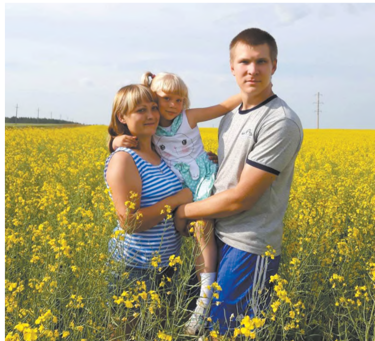
Мы любим бывать на природе