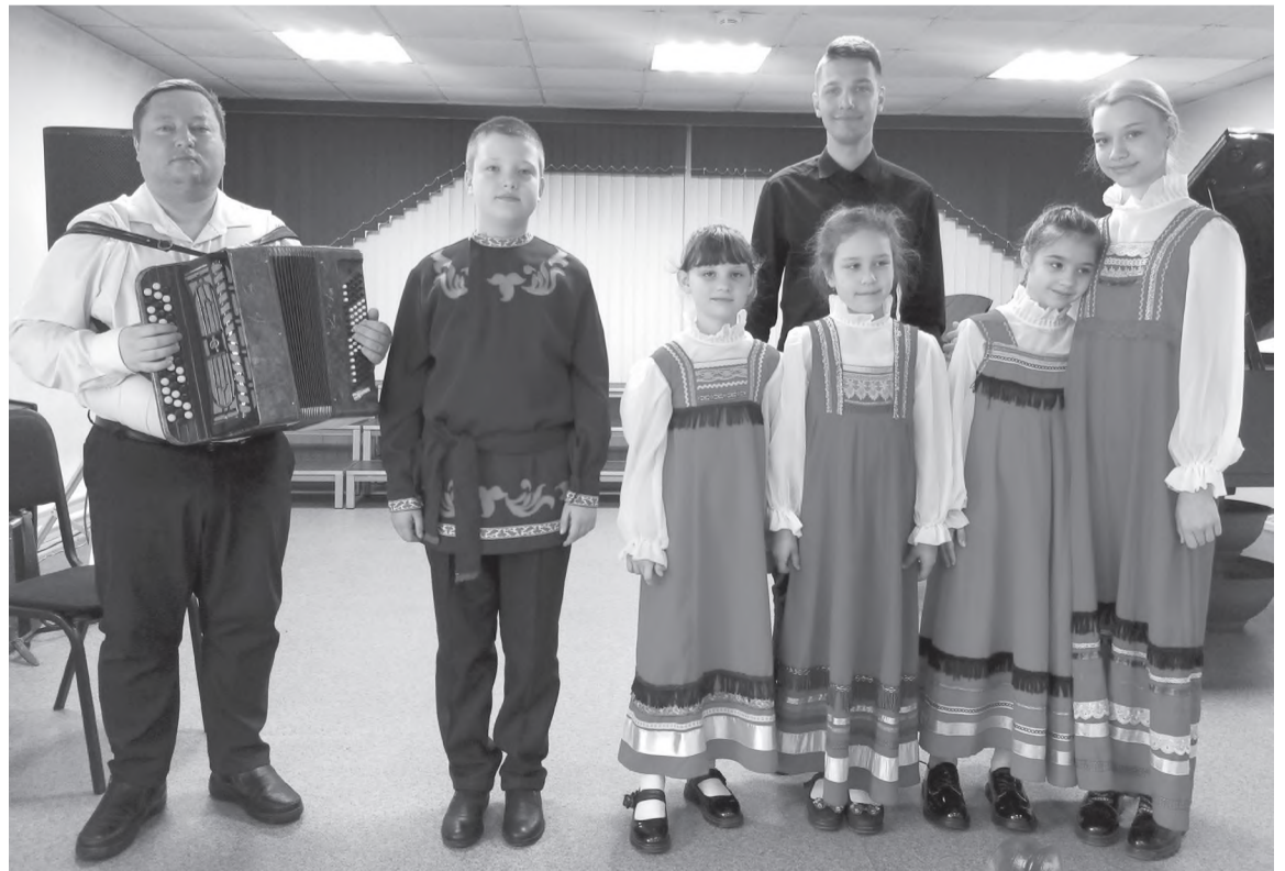
На сцене - фольклорный ансамбль «Цветень»