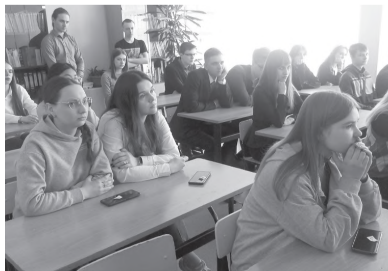
Абитуриенты все во внимание