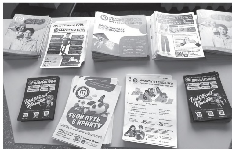
Всё для вас – листовки, буклеты об ИРНИТУ