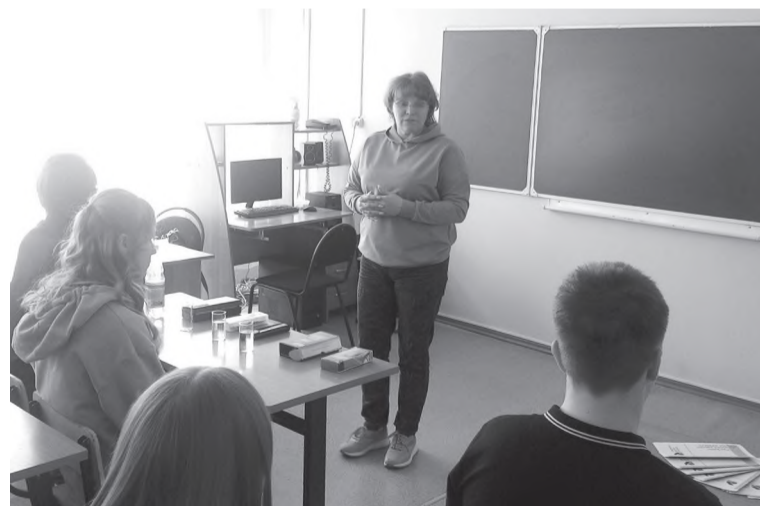
Во время мастер-класса