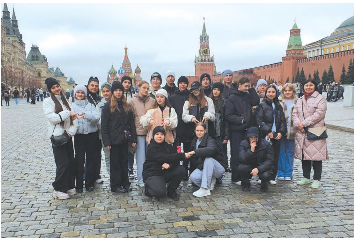
Экскурсия на Красную площадь