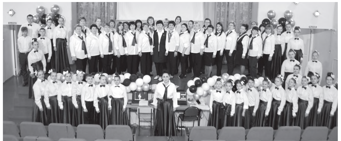
Педагоги и ученики пятой школы