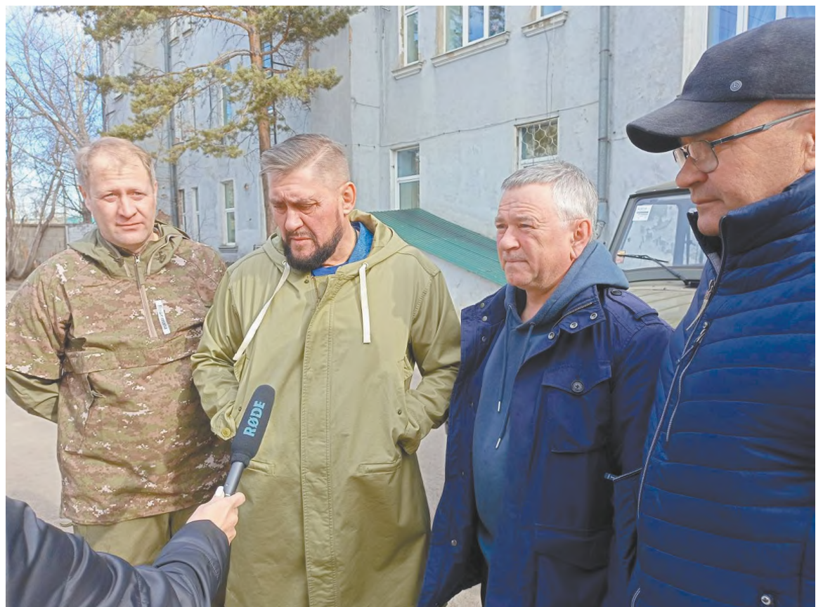
Мэр Вадим Семенов перед отправкой автомобиля УАЗ в Ростов-на-Дону