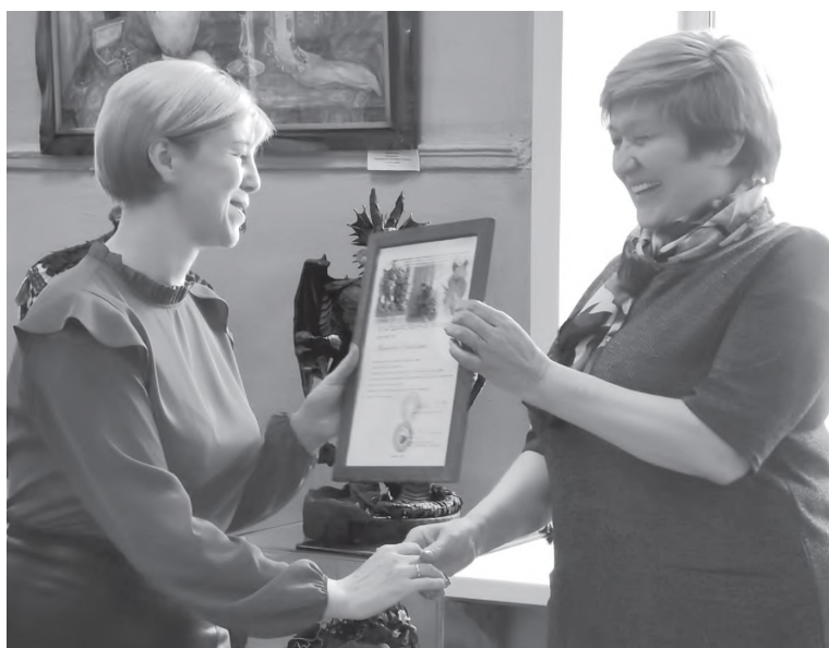
Вручение автору благодарственного письма