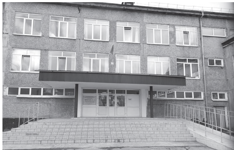
Школа № 5

Школа № 5 недавно отпраздновала свой юбилей. Ей исполнилось сорок лет. По возрасту школа относительно молодая, но уже выпустила из своих стен сотни выпускников.