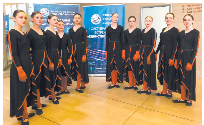
Старшая группа ансамбля (танец «Грань»)