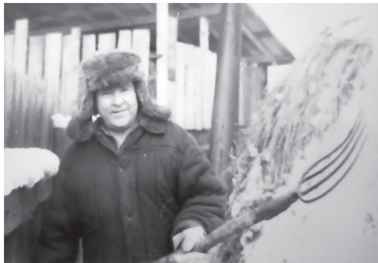
В совхозе. Любая работа по плечу