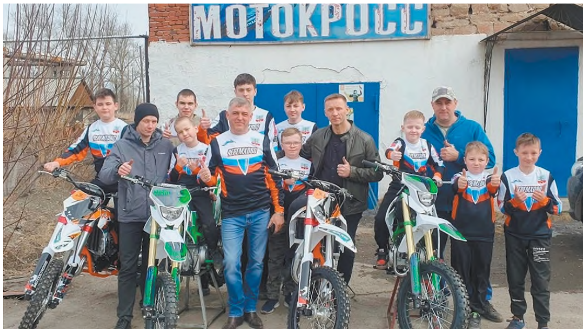
Спортсмены мотоклуба «Каскад»