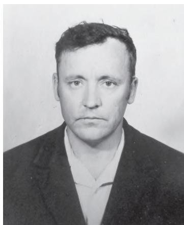
В молодые годы