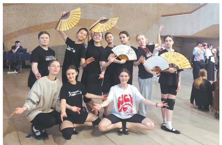
На мастер-классе по танцу с веерами