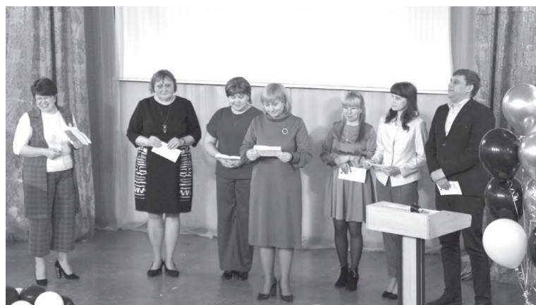
Поздравление от директоров городских школ

Свои двери для учеников школа № 5 распахнула в 1983 году. Тогда сюда пришли ученики бывших школ № 7 и 29. Простор-