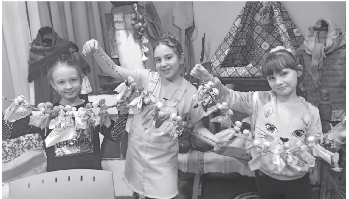
Вот такие куколочки у нас получились!

Готовый кукольный оберег (из 13 лихорадок) можно цеплять на отведенное ему место.