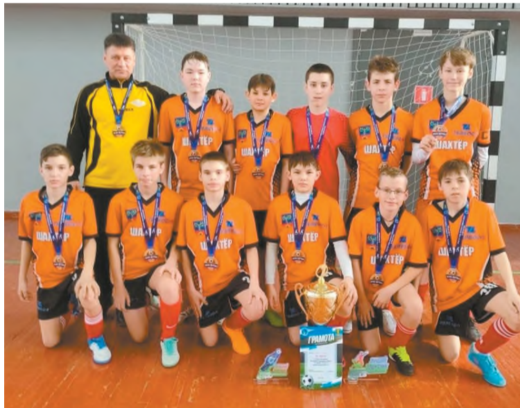
Победители турнира с тренером

Черемховские спортсмены стали победителями открытого турнира Ангарского городского округа по мини-футболу среди юношей 2010 г.р., который проходил в минувшие выходные в Ангарске.