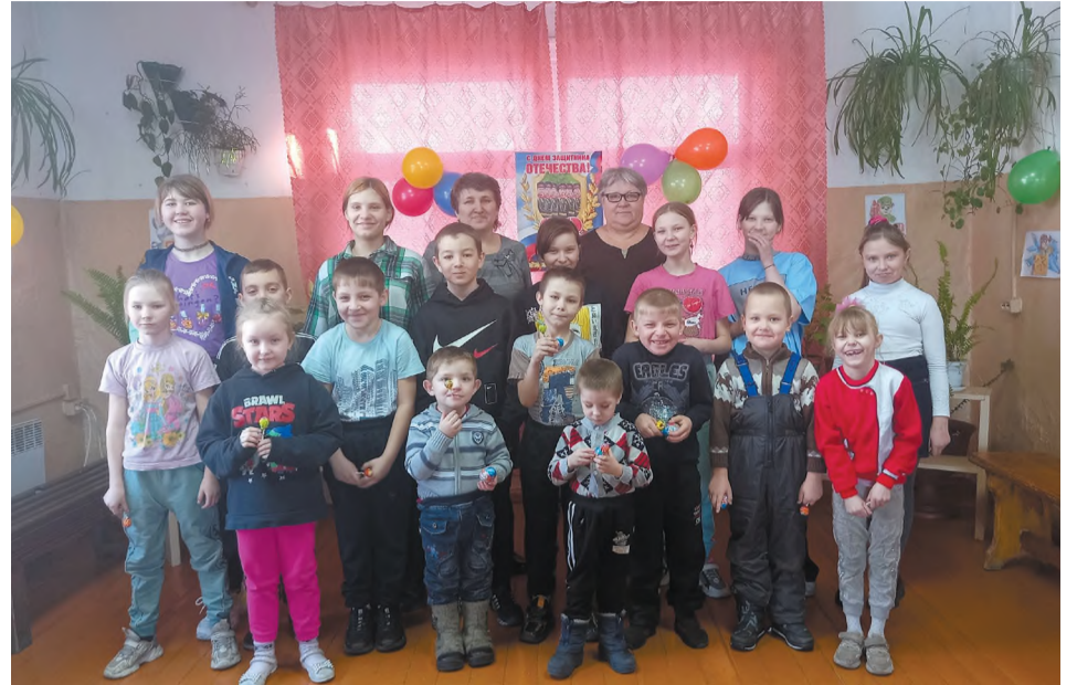
Праздник для детворы в местном клубе