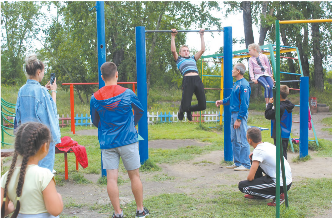
Поселковые ребята с удовольствием тренируются