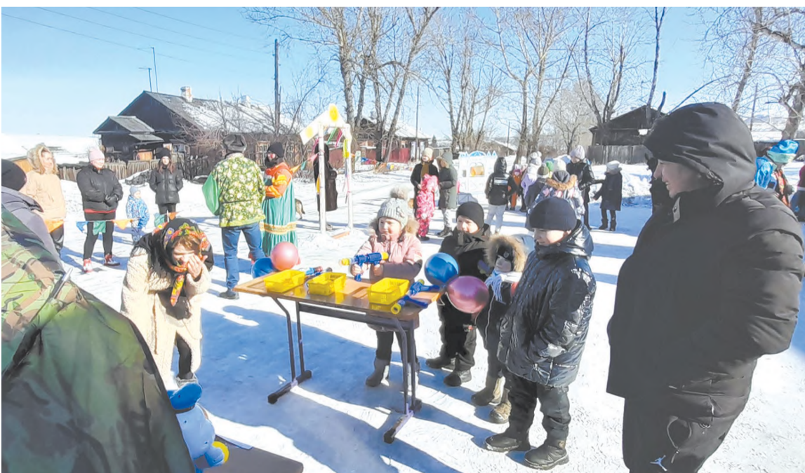
Жители посёлка празднуют Масленицу