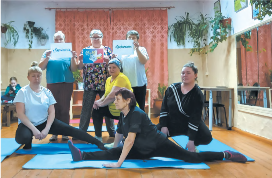
Участницы группы «Гармония здоровья»