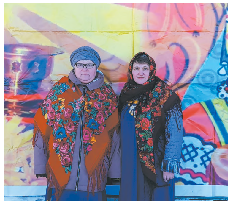
У нас всегда весело!