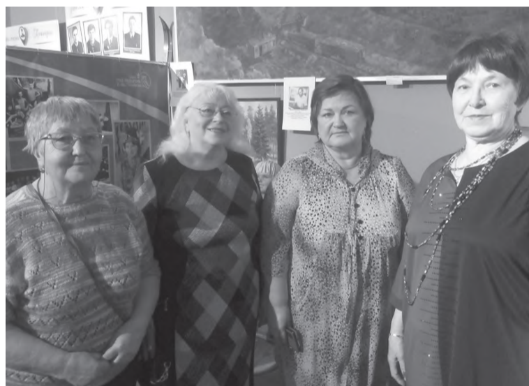
А вот и наставники (совет ветеранов педагогов)