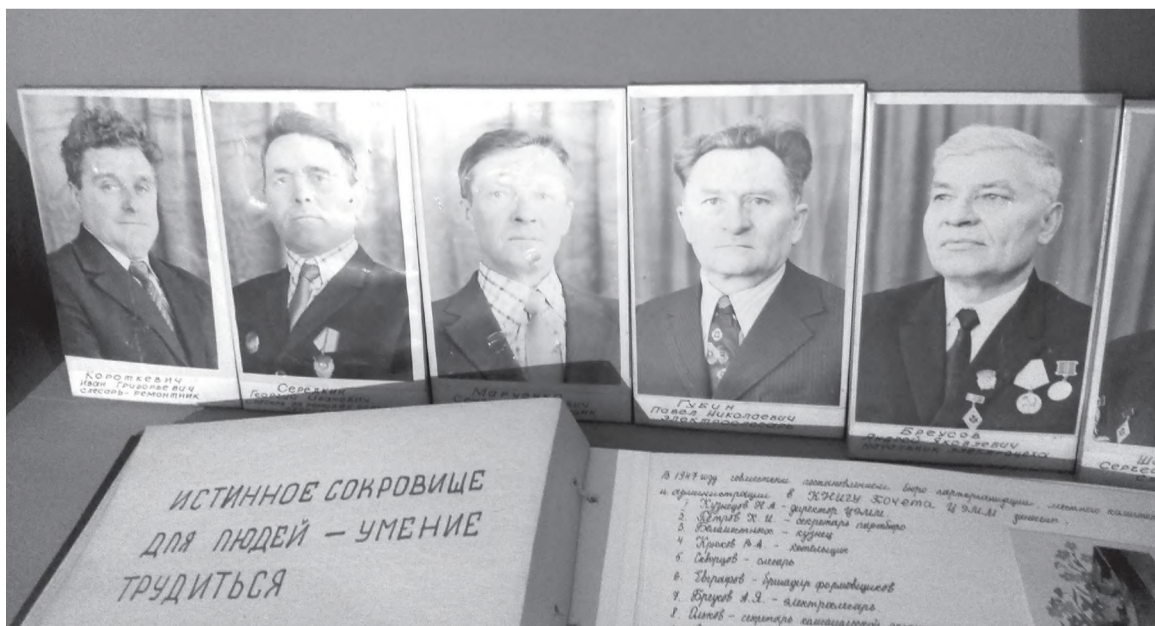
Портреты ветеранов из книги почёта ЦЭММ