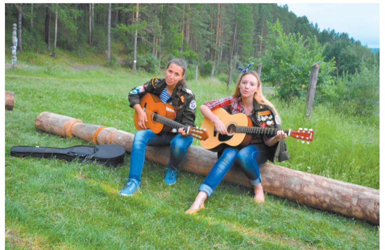
Любимое занятие - игра на гитаре!