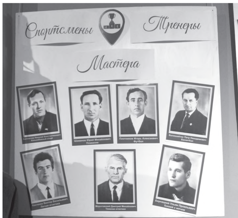
Стенд с тренерами-наставниками