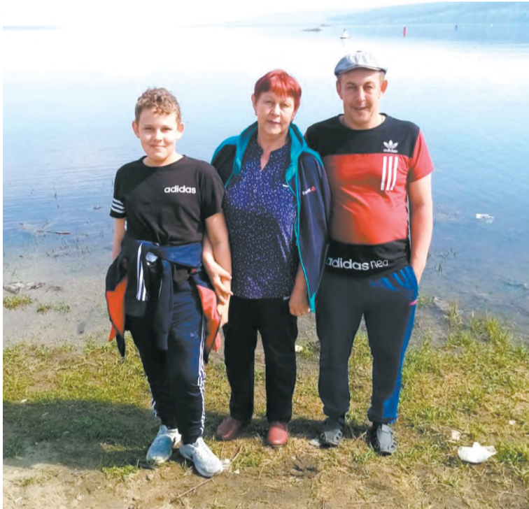
На отдыхе с сыном и внуком