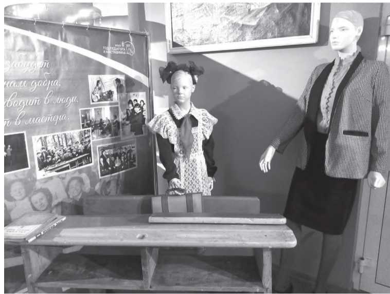
Манекены: учитель и ученица