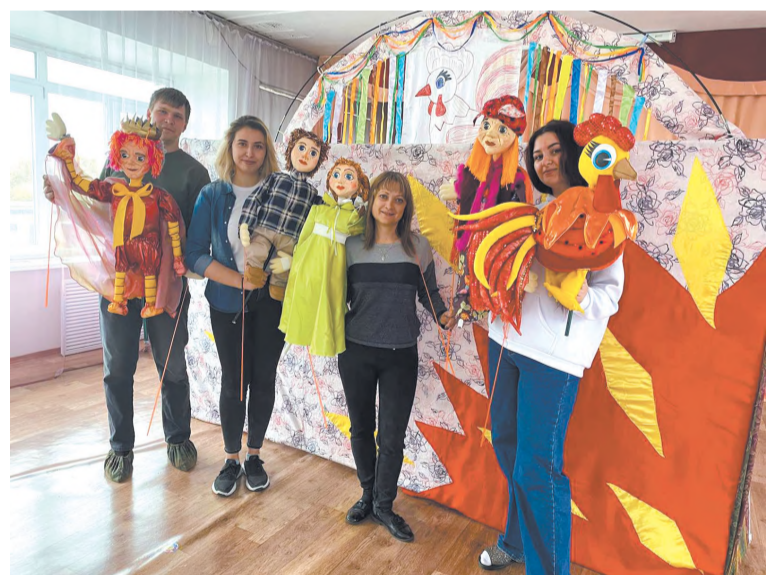
Театр всегда со мной

подарки своими руками, мы с семьёй любим играть в настольные игры и петь песни под гитару.