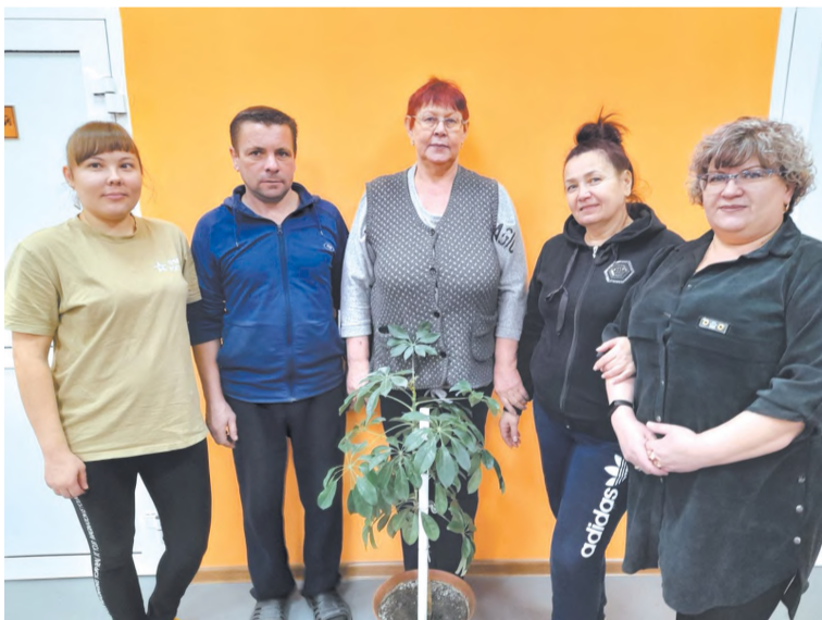
Администратор со своей командой техперсонала «Мартенсита»