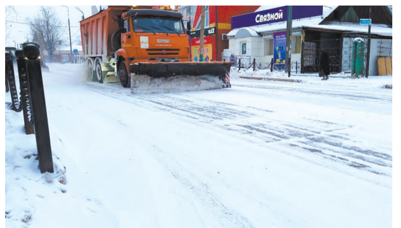
Уборка городских дорог