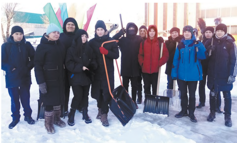
Дружная команда лиценстов к уборке снега готова

Зима в разгаре. Как и положено, землю укрыл белый пушистый снег, стоят морозы, на деревьях иней. Красота! Безусловно, снег это хорошо, но только не для работников коммунальных служб, которым работать приходится с удвоенной силой, чтобы расчистить городские дороги и общественные места от снега.