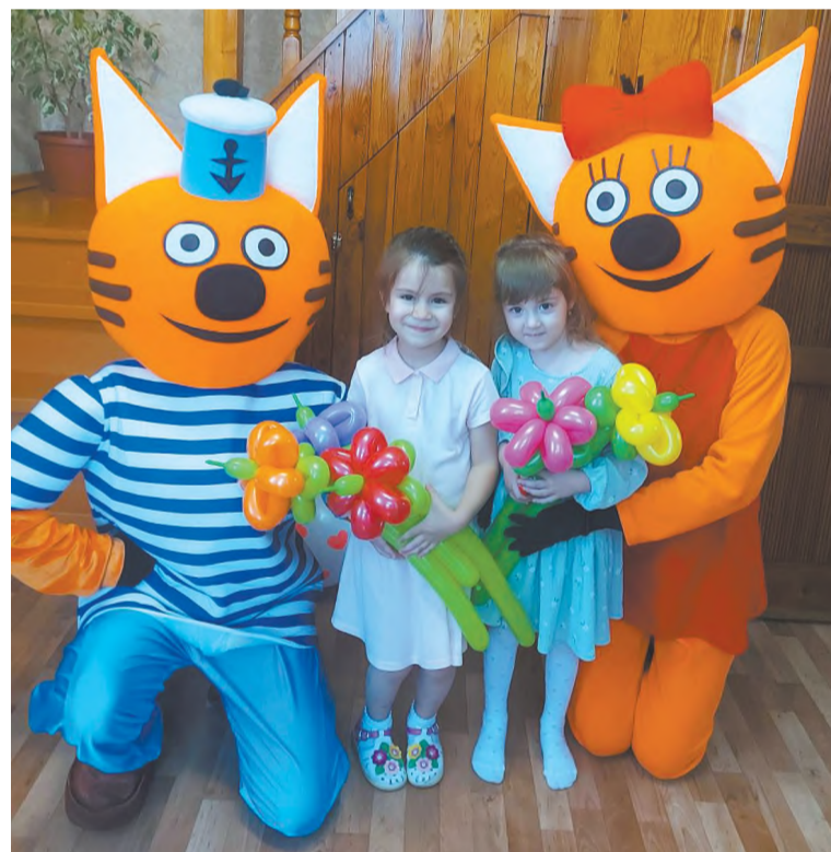
Любимцы детей – Коржик и Карамелька

могут устроить бумажную дискотеку, а некоторые предпочитают, чтобы их осыпали купюрами из бабломёта, который по желанию клиента приносят с собой герои. Ко всему прочему, детворе очень часто заказывают генератор мыльных пузырей. Здорово и весело! Герои могут прийти, как домой, так и поздравить прямо на улице. В любом случае, приход Карамельки, Коржика, а также Мишки и Зайки всегда вызывает восторг у публики.