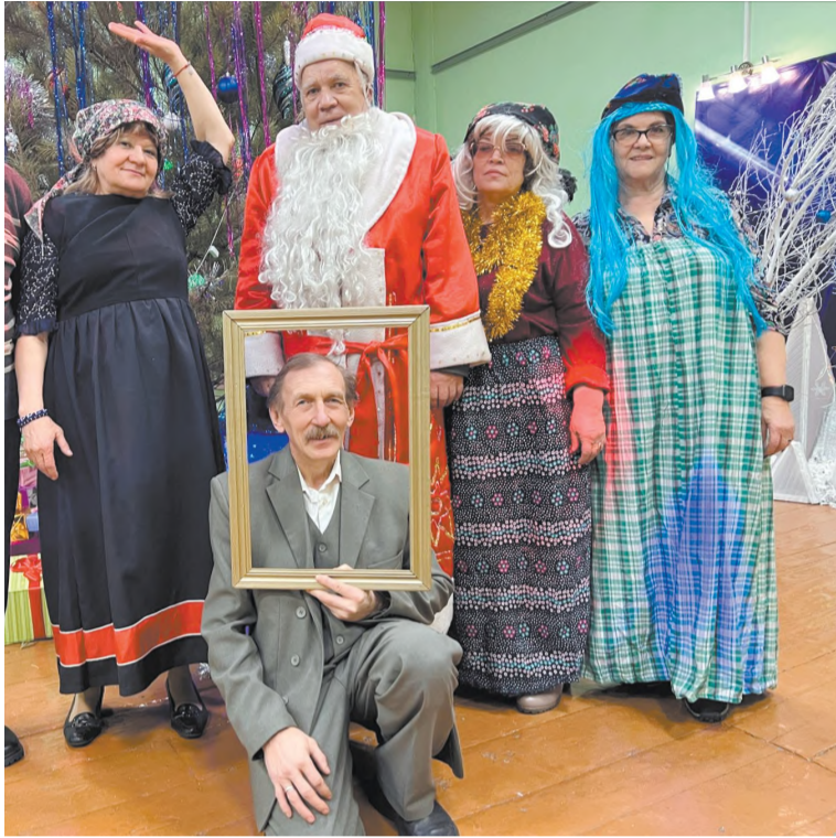
Мы в образе

В клубе посёлка Гришево состоялась встреча клуба по интересам «Активный возраст» под тематикой празднования Старого Нового года.