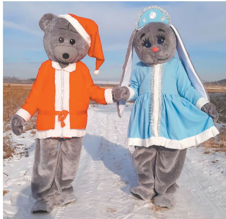
Мишка-Дед Мороз и Зайка-Снегурочка

Когда в гости к заказчику приходят ростовые куклы, они приносят с собой букет из шаров,