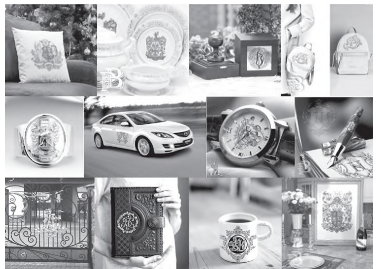
Фамильные изделия, выполненные в геральдической мастерской «Традиции времён»