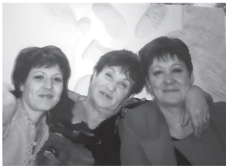
С любимыми дочерьми

магазин за продуктами. Пожилая женщина говорит, что сразу же нашла с ней общий язык. Соработник душевная, трудолюбивая, ответственная. Не только добросовестно исполняет свои обязанности, но и во всём поддерживает свою подопечную.