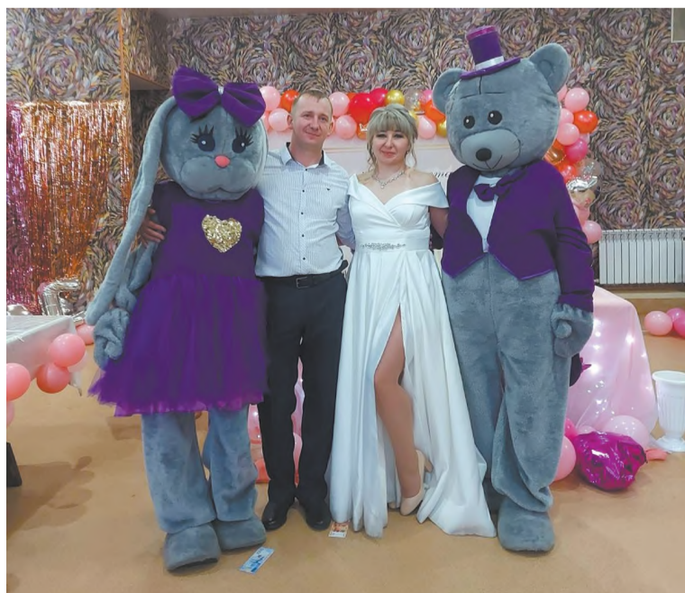
Ростовые куклы - гости свадьбы