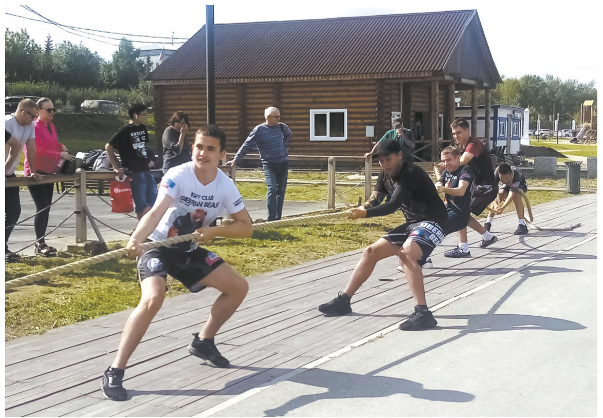
Момент перетягивания каната