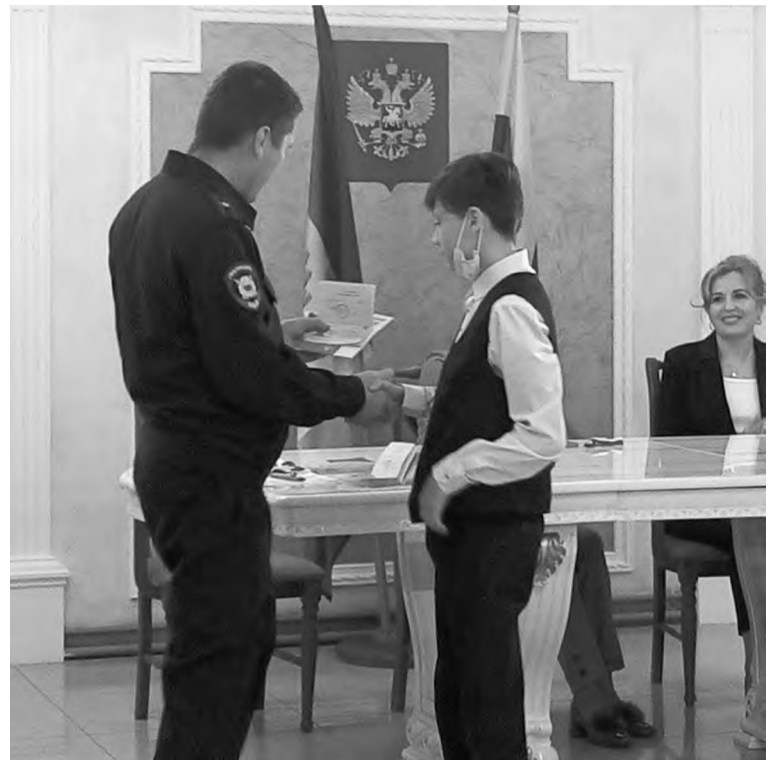
Момент вручения документа

- Для меня это был самый обычный день, без всяких торжеств, - поделился с нами один из присутствующих пап. - Паспорт тогда получали в шестнадцать лет. Помню, пришёл я в городской паспортный стол, где в кабинете мне и вручили документ. А сегодня моя дочь получает паспорт в