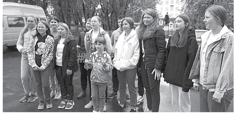
Участники эко-марафона (школа № 8)

Более двадцати организаций и образовательных учреждений города приняли активное участие в экологическом марафоне #МолодоЗелено, организаторами которого стал отдел по молодёжной политике г. Черемхово.