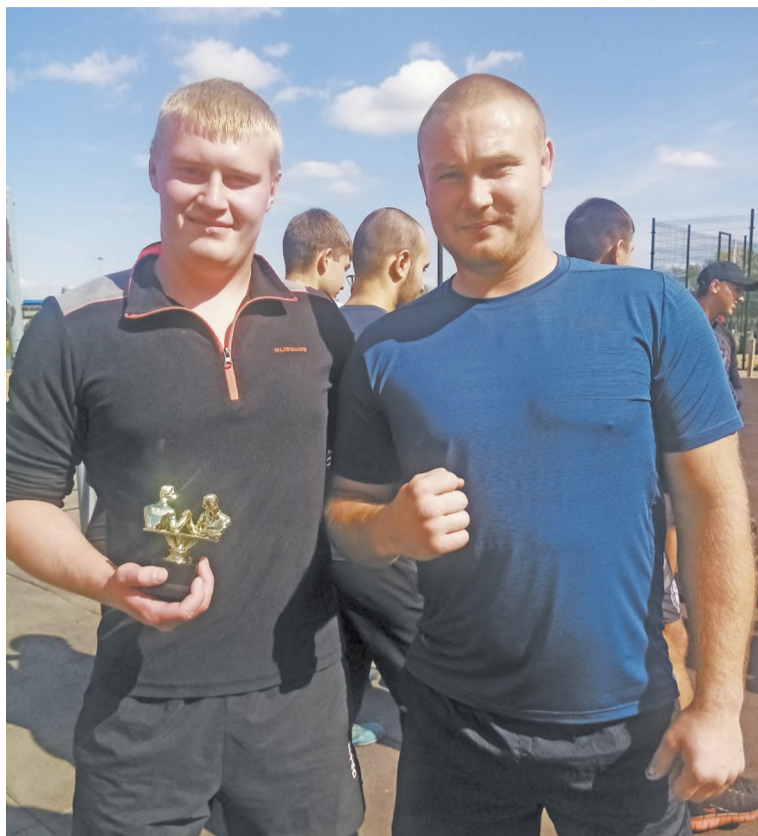
Победители амрслинга (боксеры ДЮСШ)