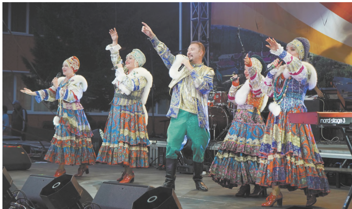
На сцене ансамбль «Красная горка»