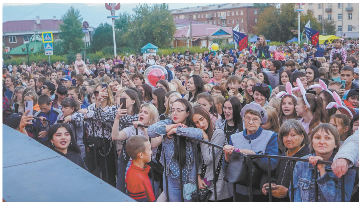
В День города. Публика в восторге