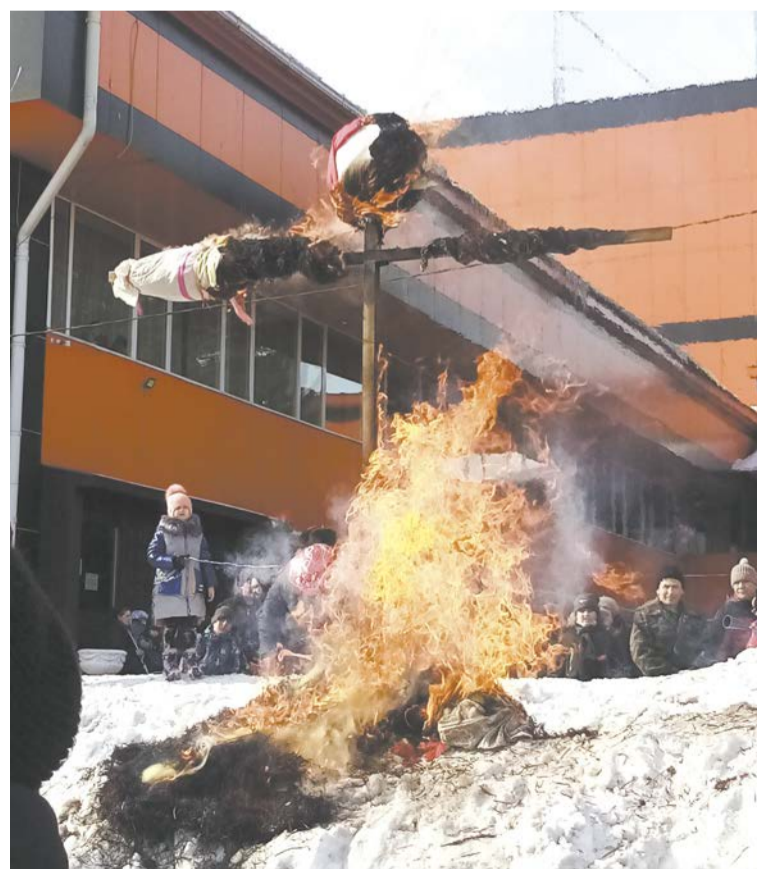
Гори, гори ясно...