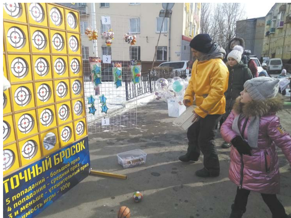
Игровые эстафеты для детей