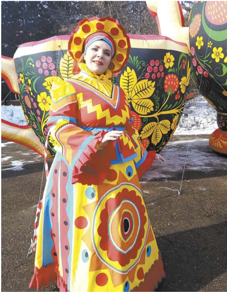
А вот и сама Масленица во всей красе!