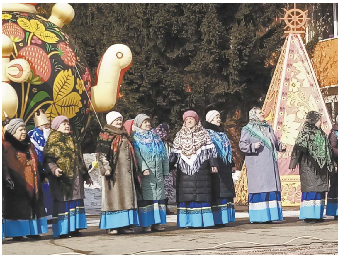
Выступает вокальная группа «Отрада»