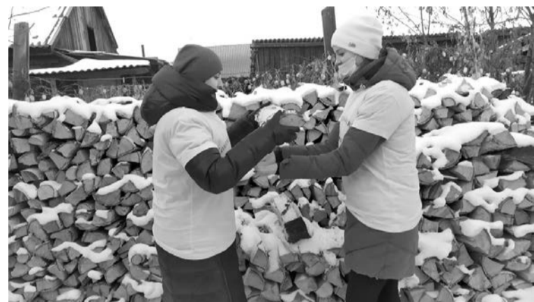
Справимся с любой работой

Ещё одна акция «Пожилый гражданин живёт рядом» является привлечением внимания к проблемам людей преклонного возраста, оказание безвозмездной бытовой помощи одиноким престарелым людям и инвалидам в ходе реализации проекта волонтерского движения «Доброе сердце». Принести дров,