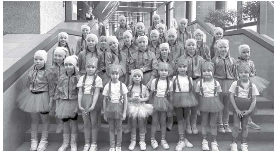
Студия эстрадного танца «Джем» - лауреаты первой степени!