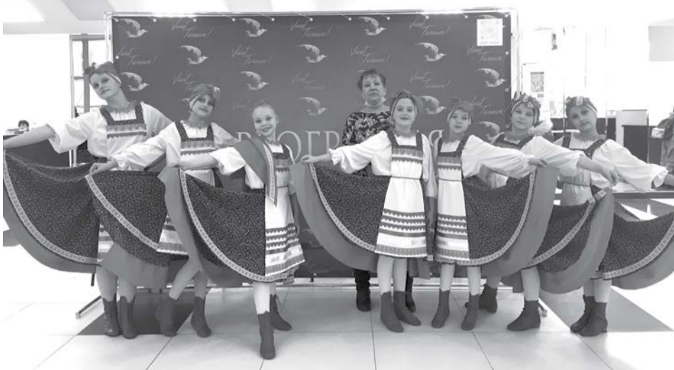
Ансамбль народного танца «Звонкий каблучок» - призёры фестиваля