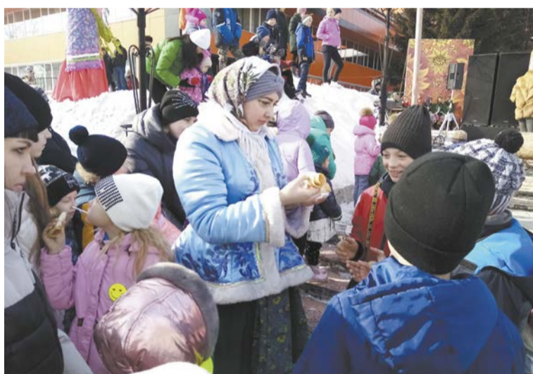
Угощайтесь детки блинками

Не обошлось и без традиционного масленичного столба, на котором висели разные подарки. Самые смелые и уверенные в себе мужчины то и дело вскарабкивались на столб. Надо отметить, что не всем удавалось