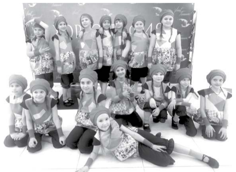
Младшая группа «Танцевального лимузина» - лауреаты первой степени!