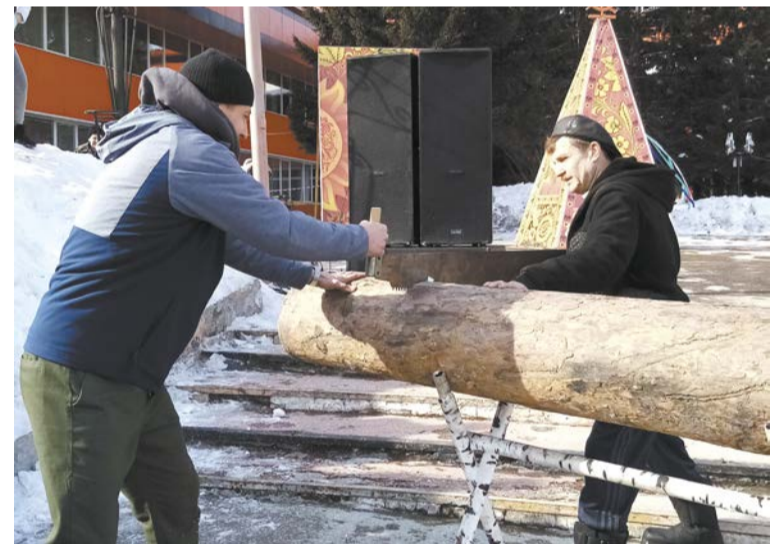
Эх, раз, ещё раз пилим брёвна мы сейчас!