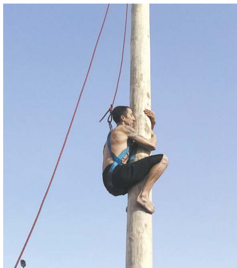
Смельчаки на столбе