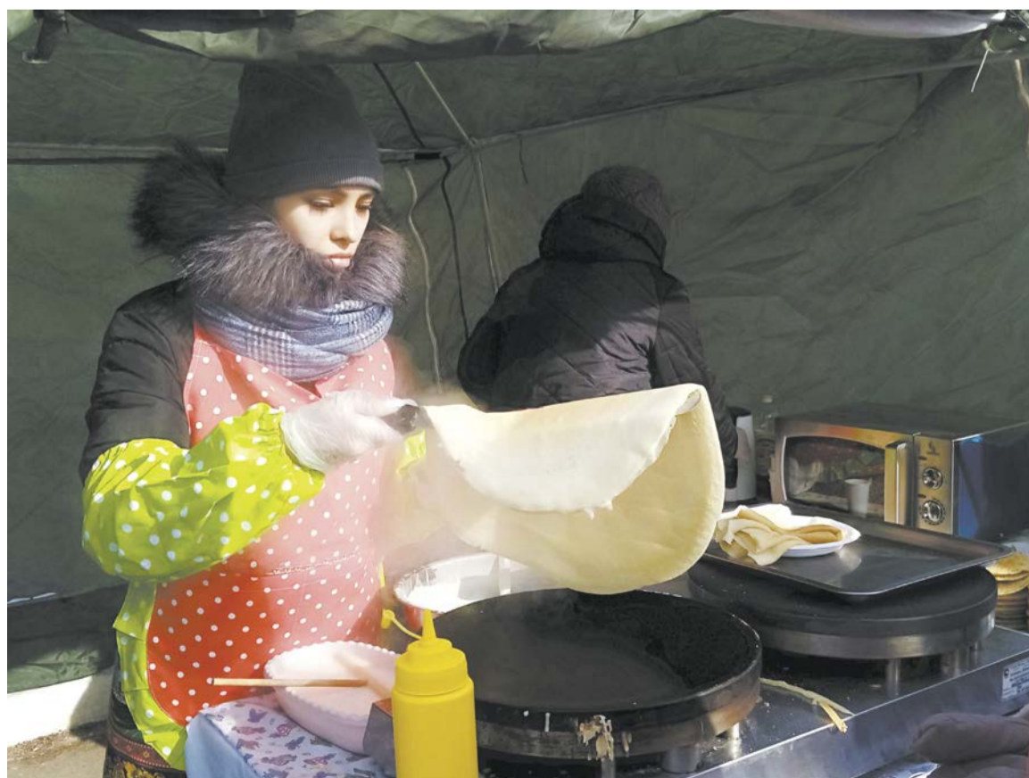
Вот это блин!

В минувшие выходные отпраздновали широкую Масленицу! Это день, когда во всех семьях пекут блины. Но не все знают, откуда взялся этот праздник, как его отмечали в стародавние времена и каковы его обычаи.