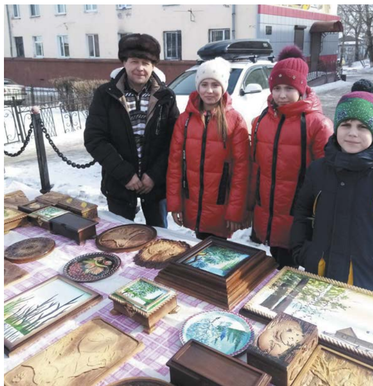
Не проходите мимо...