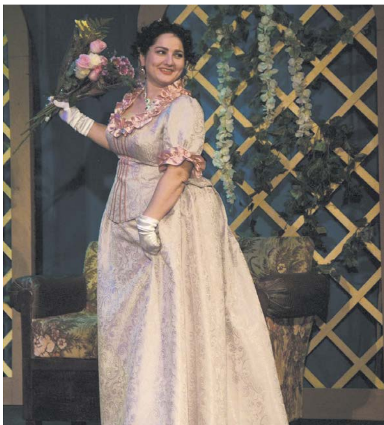
На сцене во время спектакля