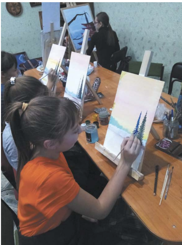
Юные художники за работой

- Я пока не буду раскрывать все карты, единственное скажу, что хочу реализовать свой новый проект, который поможет объединить ещё больше людей, увлечённых живописью и резьбой по дереву. Все вместе мы сможем многое!