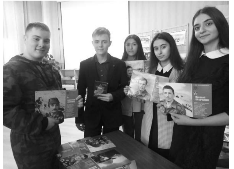
Десятиклассники рассматривают фотоматериалы про Афган