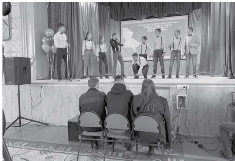
Гостей торжественного открытия чемпионата в ЧГТК развлекала команда КВН «Экстрим»

В течение трёх дней участники соревновались в мастерстве создания компьютерных игр,