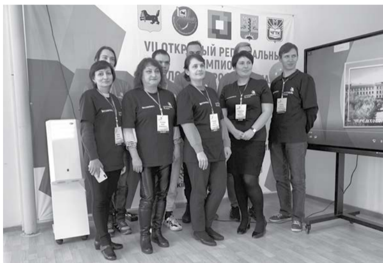
Конкурсантов поддерживали и оценивали эксперты

Стоит отметить, что помимо горнотехнического колледжа чемпионат «Молодые профессионалы» в Черемхово также принимали у себя педагогический колледж и модельная библиотека «Интеллект-Центр». Конечная ступень чемпионатного движения – международный чемпионат WorldSkills International.