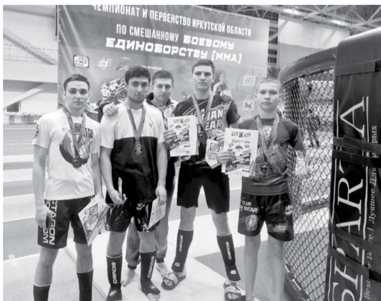
Четыре бойца «Сибирского медведя» заняли призовые места в областном чемпионате по ММА

Ровно год назад – в выпуске, приуроченном к 23 февраля – на страницах «Черемховского рабочего» впервые появился клуб смешанных единоборств «Сибирский медведь». Первый и пока единственный подобного рода бойцовский клуб в городе. С тех пор «медведи» стали зваными гостями на страницах издания. Не забыли мы про наших друзей и в этом праздничном выпуске.