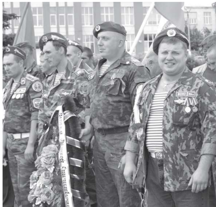
С друзьями-десантниками на Дне ВДВ