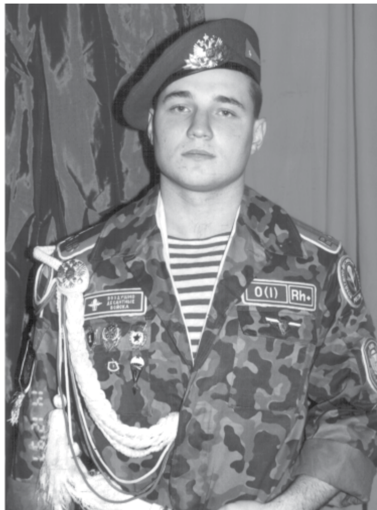
Годы службы в армии

- Я работаю в педагогическом колледже и вижу большую ошибку чрезмерного «залипания» молодых людей в социальных сетях. Понимаю, что все