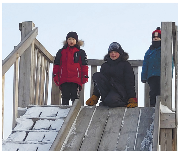
Ребятня на горке