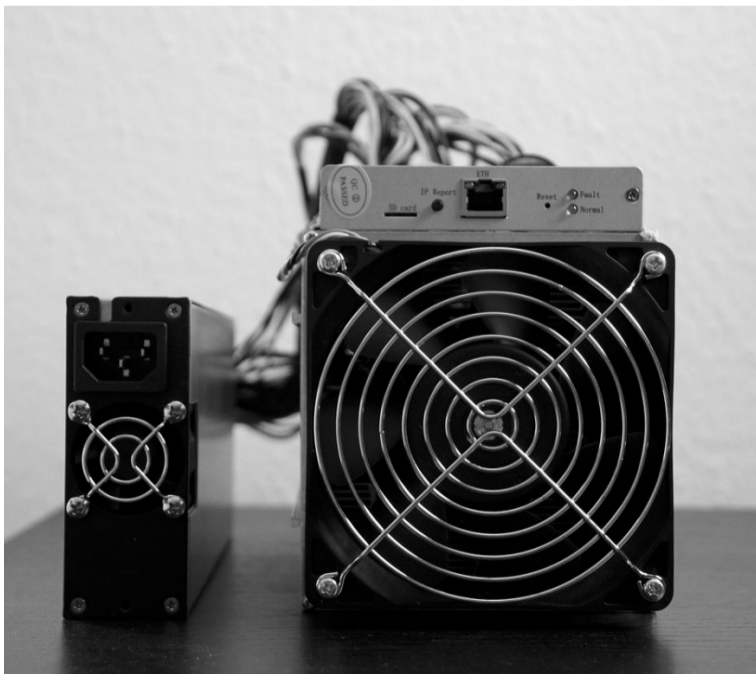
Справа – «асик», слева – видеокарта. С их помощью добывают криптовалюту