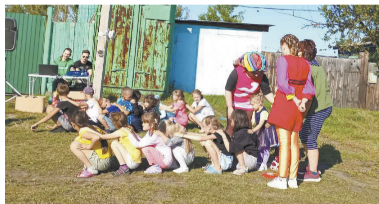
Праздник для поселковой детворы