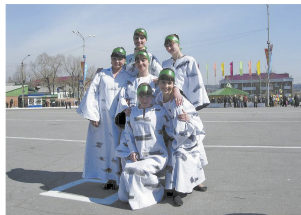
Девушки горнотехнического колледжа