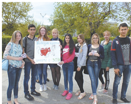
Студенты медколледжа – против табака!

Горнотехнический колледж, педагогический колледж, медицинский колледж, техникум промышленной индустрии и сервиса – студенческий актив города от сердца поздравляет с Днём студента. Черемхово гордится тем качественным уровнем среднего специального образования, который ежегодно показывают городские ссузы. Вдохновения вам и новых горизонтов для развития!