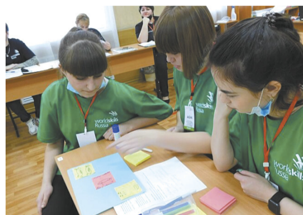
Будущие педагоги принимают участие в чемпионатах по профмастерству