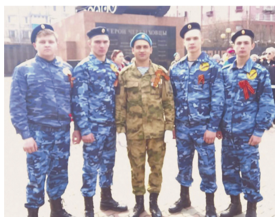
Славные парни «девятки»