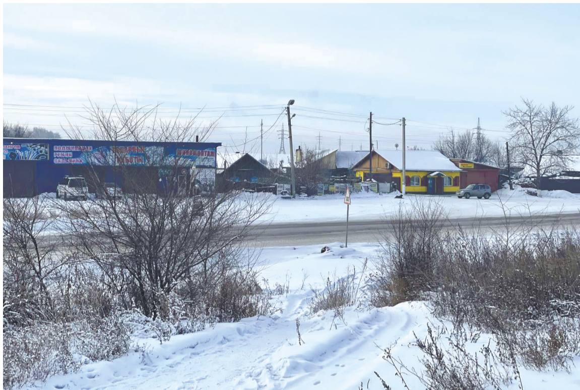
Вид на центральную улицу посёлка