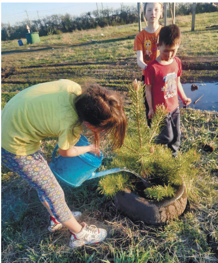
Все вместе озеленяем посёлок

– Расскажите, как у вас проходят поселковые праздники?