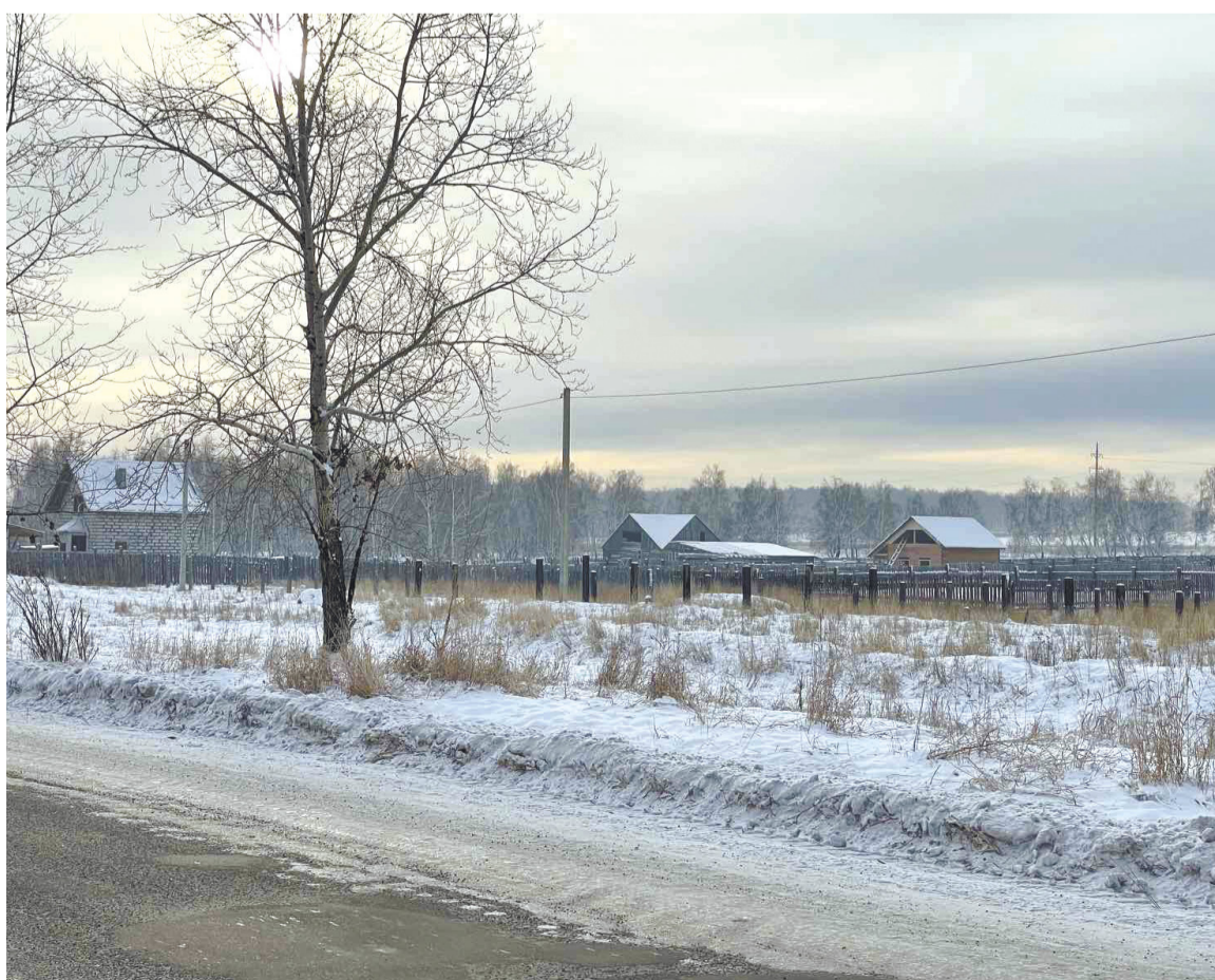
Жизнь продолжается, в посёлке строятся новые дома