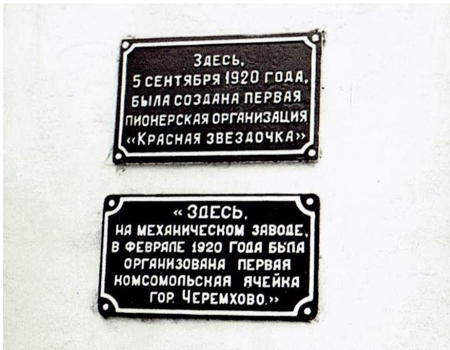
Мемориальные доски на здании клуба имени Ленина. Нижняя доска открыта 23 февраля 1960 года. Верхняя мемориальная доска открыта 19 мая 1968 года

Нельзя не сказать и о создании 5 сентября детской организации «Красная звездочка» - предшественницы пионерии - одной из первых в Сибири. В декабре 1920 года ее ребята тоже написали яркое, эмоциональное письмо В. Ленину (24, 100 – 101).