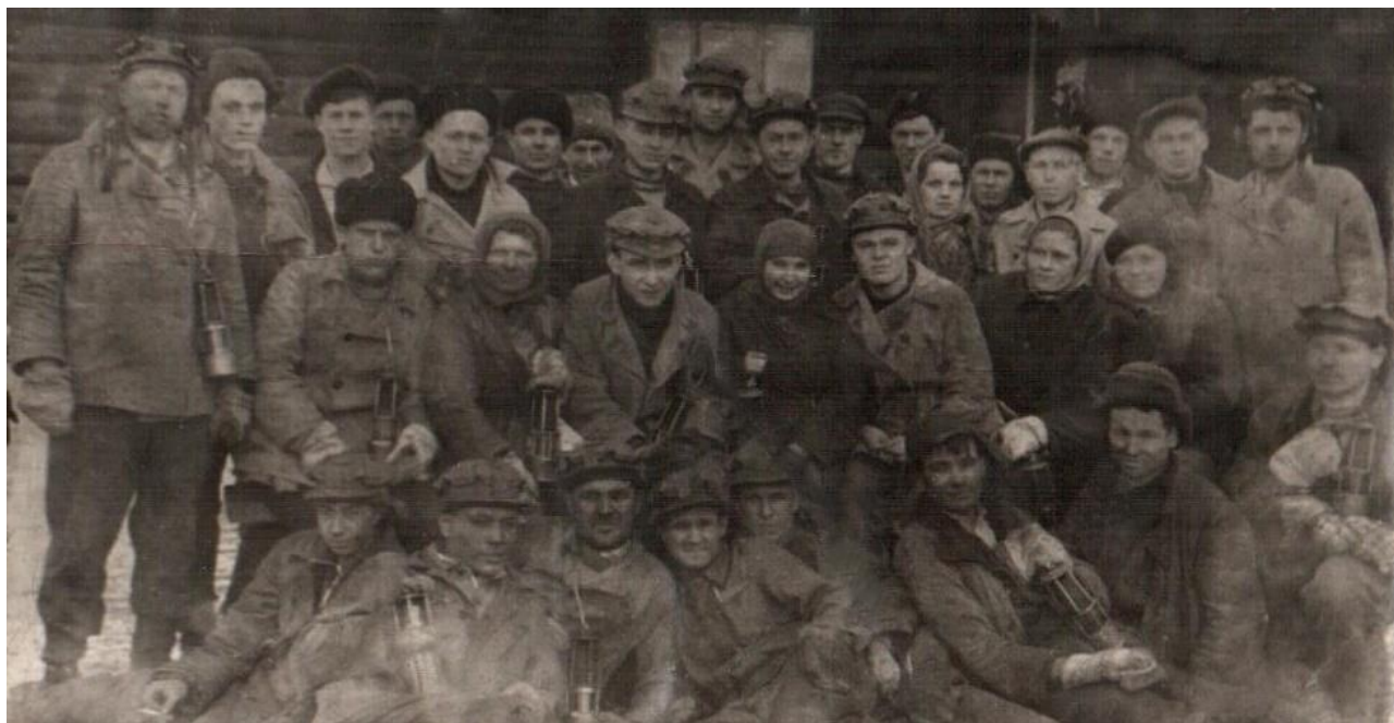
Группа рабочих и технического персонала, 1940 год

Развитие Черемховского угольного бассейна вызвало быстрый рост населения. Если в 1926 году в городе жило 14485 человек, то в 1932-м - уже 23240, а в 1939-м году численность населения Черемхово достигла 55700 человек, а всего района - 65907 (90).