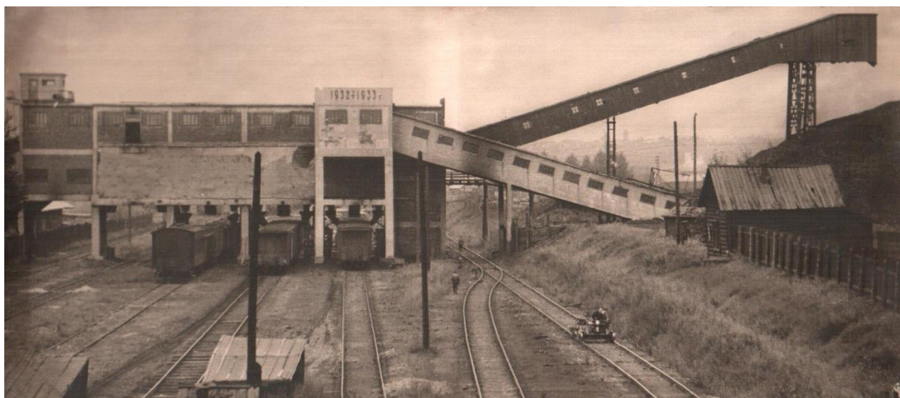
Шахта имени С.М. Кирова (1933 – 1978гг.) - самое механизированное угледобывающее предприятие Черембасса

Это было время внедрения большевистских темпов в угольной промышленности, развития социалистического соревнования, ударничества, развертывания борьбы за повышение производительности труда, за укрепление социалистической дисциплины.