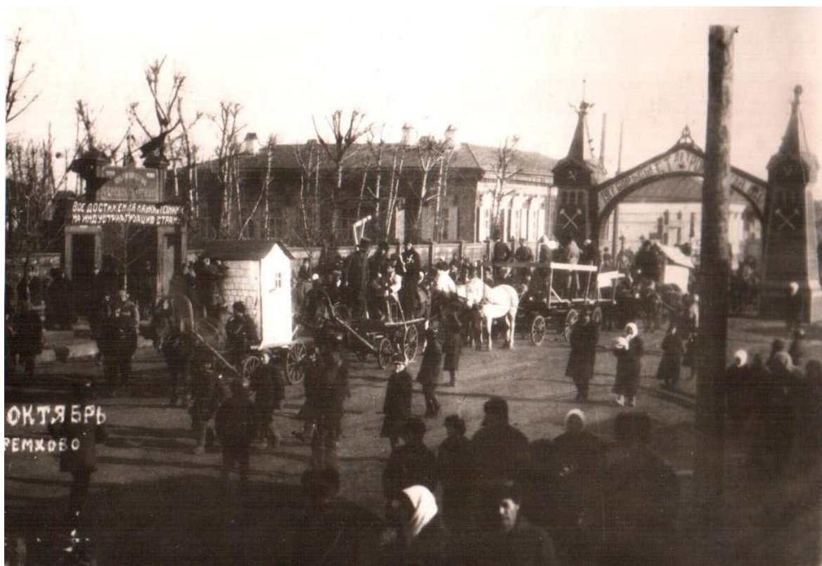
Празднование десятилетия Октября. Колонна на ул. Декабрьских событий, 1927год.

В целом 20-е годы в Черемхово – это очень трудное, но идейно наполненное время. В апреле 1929 года в Черембассе началось соцсоревнование, а в декабре наши шахтеры участвовали в первом Всесоюзном съезде ударных бригад (36).