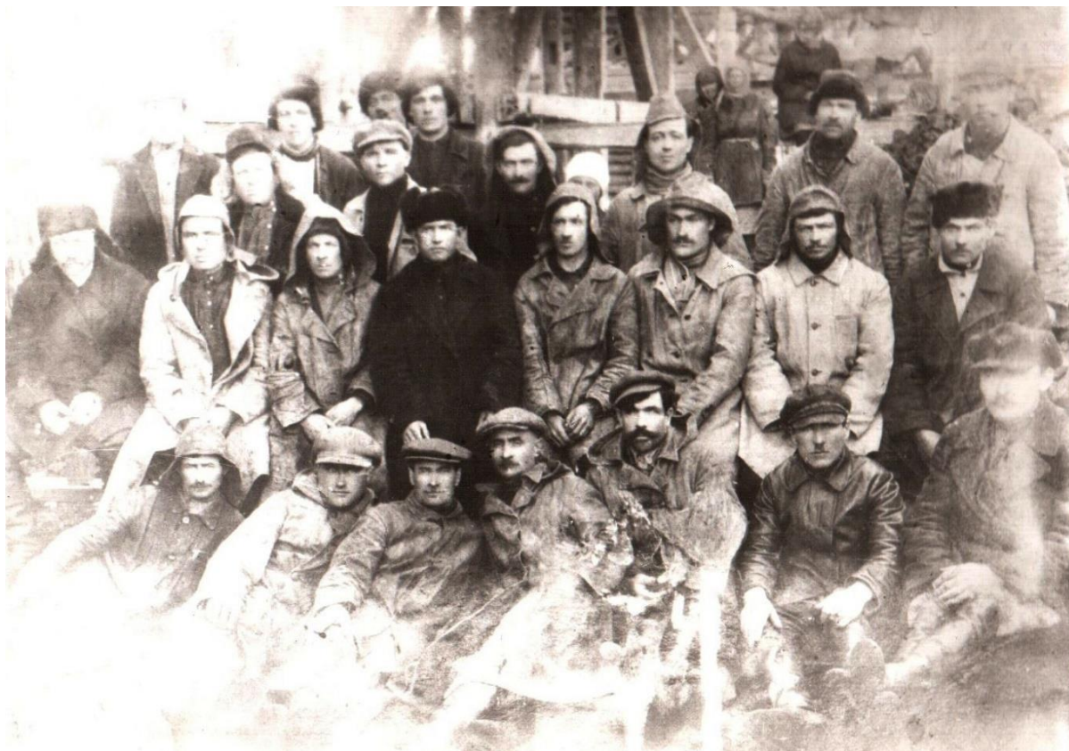
Группа рабочих и технического персонала, 1921 год.

И все же, несмотря на трудности того времени – острую нехватку квалифицированных кадров, инструментов и оборудования, большое количество несчастных случаев, - шахтеры работали с полной отдачей сил.