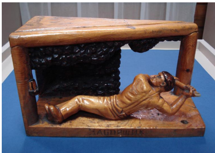
Скульптурные композиции выполнены старейшим почетным шахтером г. Черемхово Г.И. Кошелевым

В таких шахтах с 6 часов утра до 6 – 7 часов вечера шахтеру приходилось отбивать уголь, стоя на корточках, а когда пласт был тонок, то лежа на боку.