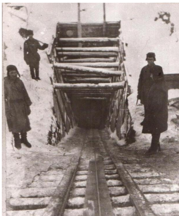
Вход в шахту

(66). Село росло, развивалось. При коях строились больницы и школы, пекарни и магазины, жилые бараки и дома, училища и мастерские, и даже клубы и театры.