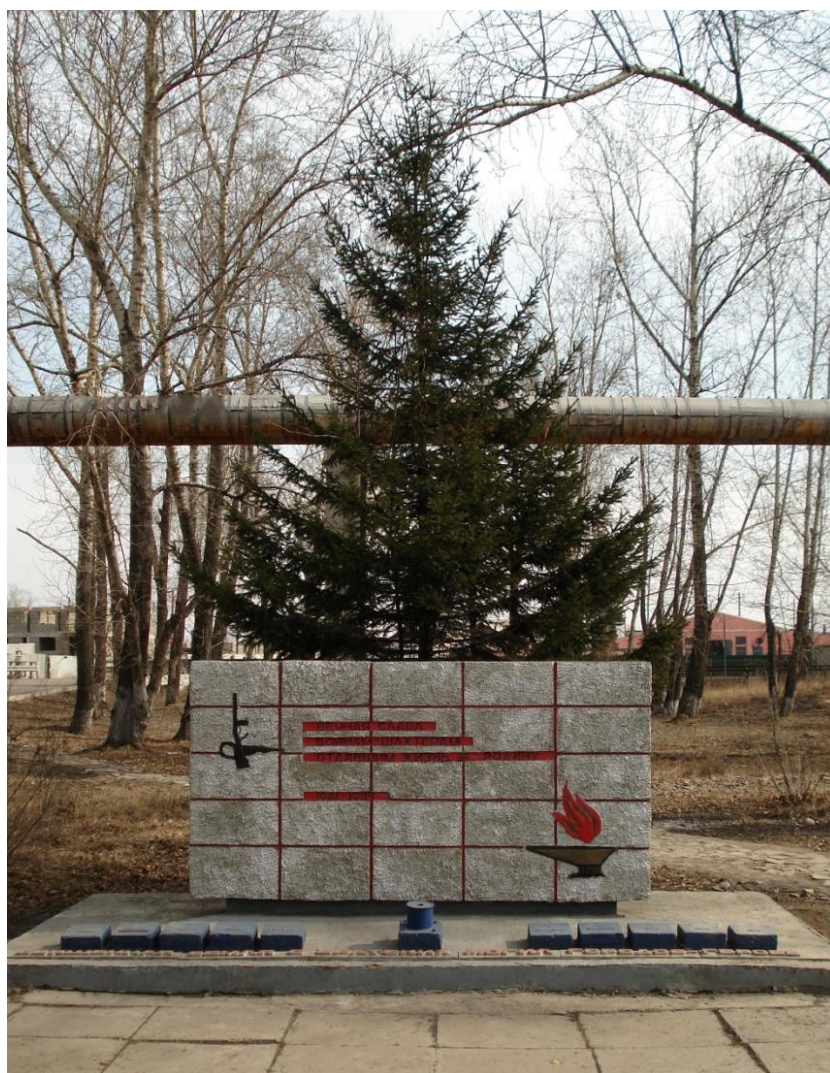
Памятник черемховским шахтёрам, погибшим в Великой Отечественной войне

Спустя 30 лет после победы, 8 мая 1975 года на территории шахты имени С.М. Кирова (по ул. Маяковского, 124) состоялось торжественное открытие памятника черемховским угольщикам, погибшим в годы Великой Отечественной войны. На нем написано: «Вечная слава воинам-шахтерам, отдавшим жизнь за Родину. 1941 – 1945», а в основание заложены капсулы со священной землей городов-героев, в которых мужественно сражались и погибли наши горняки. Земля привезена с братских могил Москвы, Ленинграда, Киева, Одессы, Волгограда, Новороссийска, Севастополя, Тулы, Бреста и Керчи. Этот мемориал – значимый исторический объект города, символизирующий подвиг шахтеров, без раздумий вставших в ряды солдат и павших смертью храбрых на полях сражений.