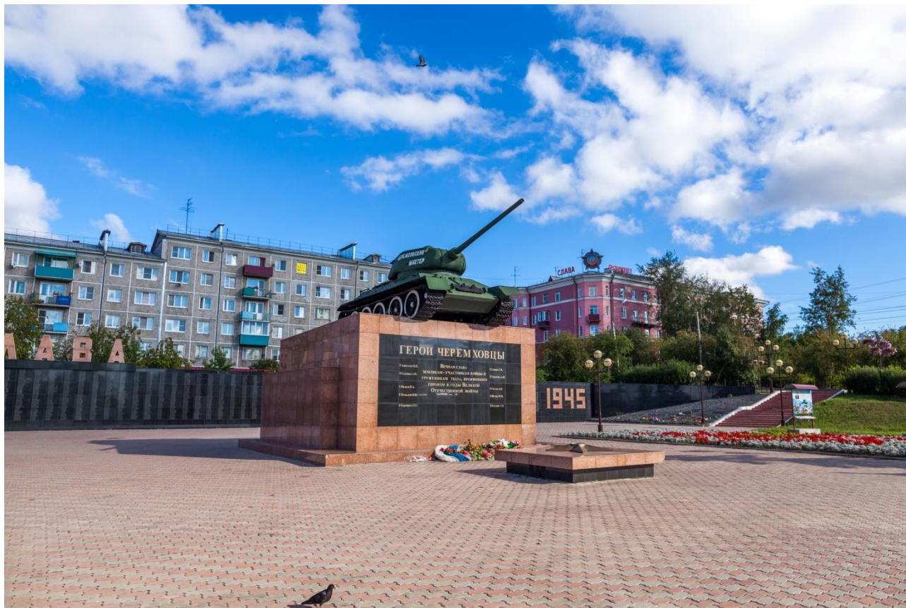
Мемориал «Слава героям Великой Отечественной войны».

пьедестал возведен легендарный танк Т-34 и оборудован «Вечный огонь». Кроме того, в Черемхово воздвигнуты памятники воинам-машиностроителям, воинам Рудоремонтного завода, педагогического училища (ныне колледжа). В память о воинах-железнодорожниках у железнодорожного вокзала установлен ретро-паровоз.